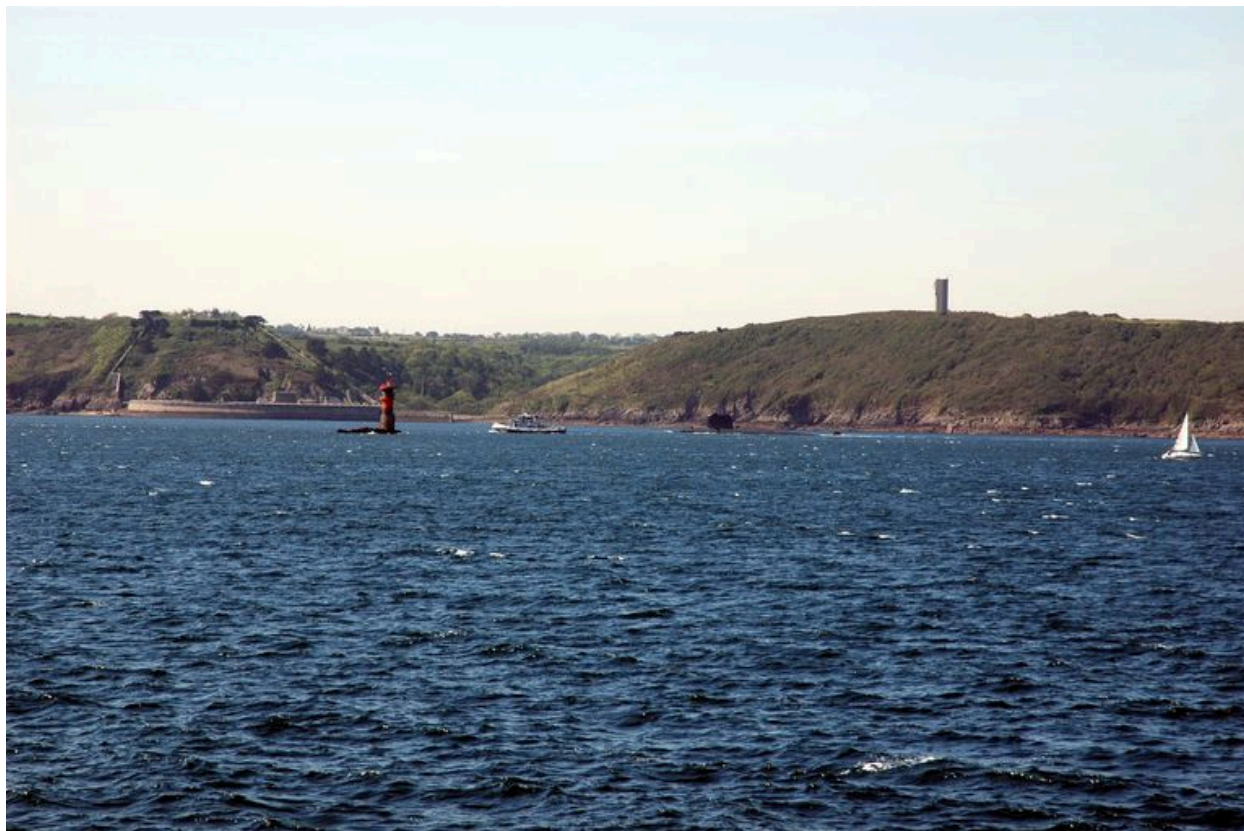
Vue d'un sous-marin dans le goulet de Brest depuis le poste lance-torpilles de la pointe de Cornouaille