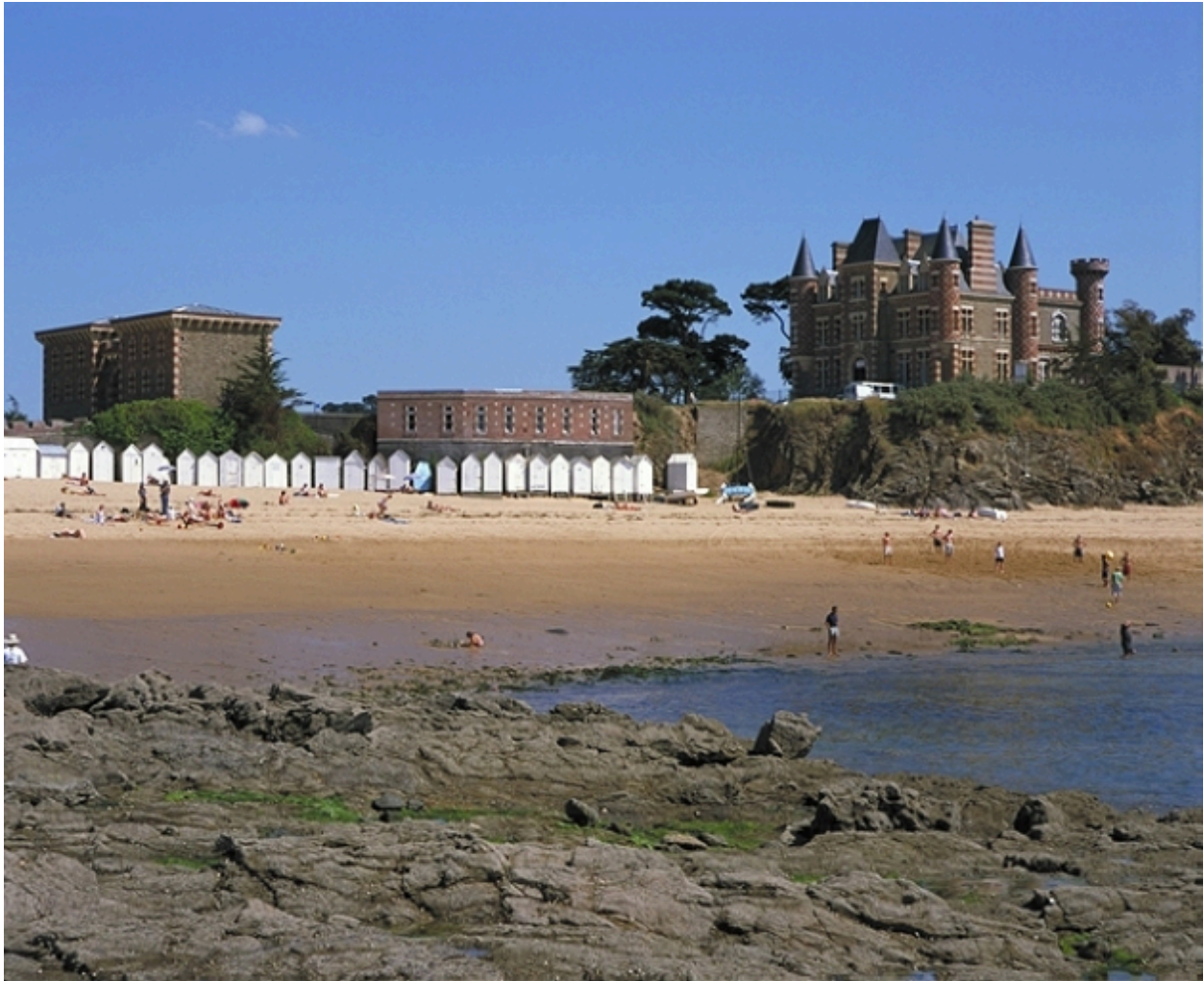
Vue de situation ouest