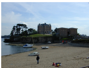
Vue de situation nord IVR53_20003509061NUCA