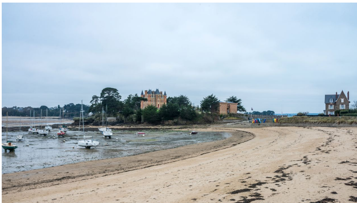
Vue de situation depuis la plage du Béchét au nord-ouest