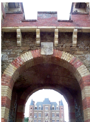
Vue depuis le corps de passage au nord