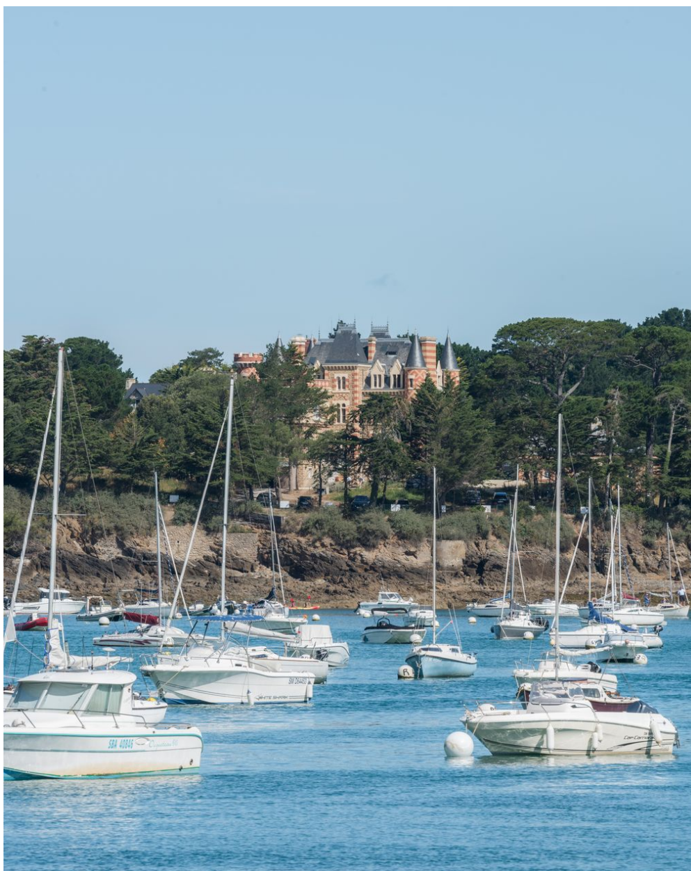
Vue de situation depuis le pont du Frémur