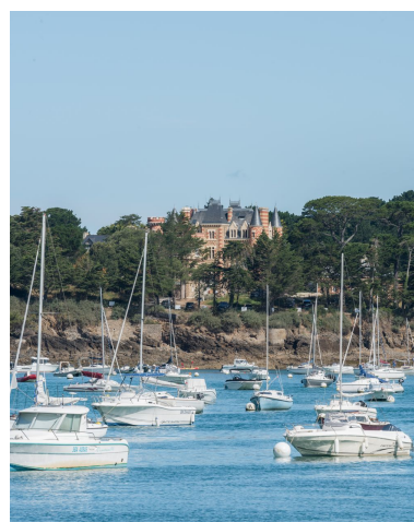
Vue de situation depuis le pont du Frémur IVR53_20203500605NUCA