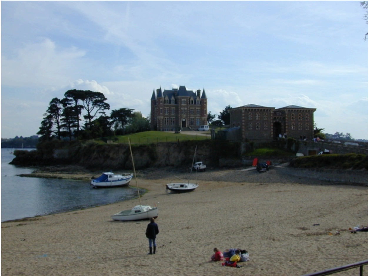
Vue de situation nord