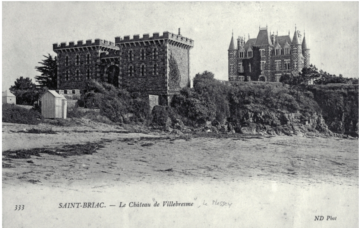
Vue générale nord-ouest au début du 20e siècle