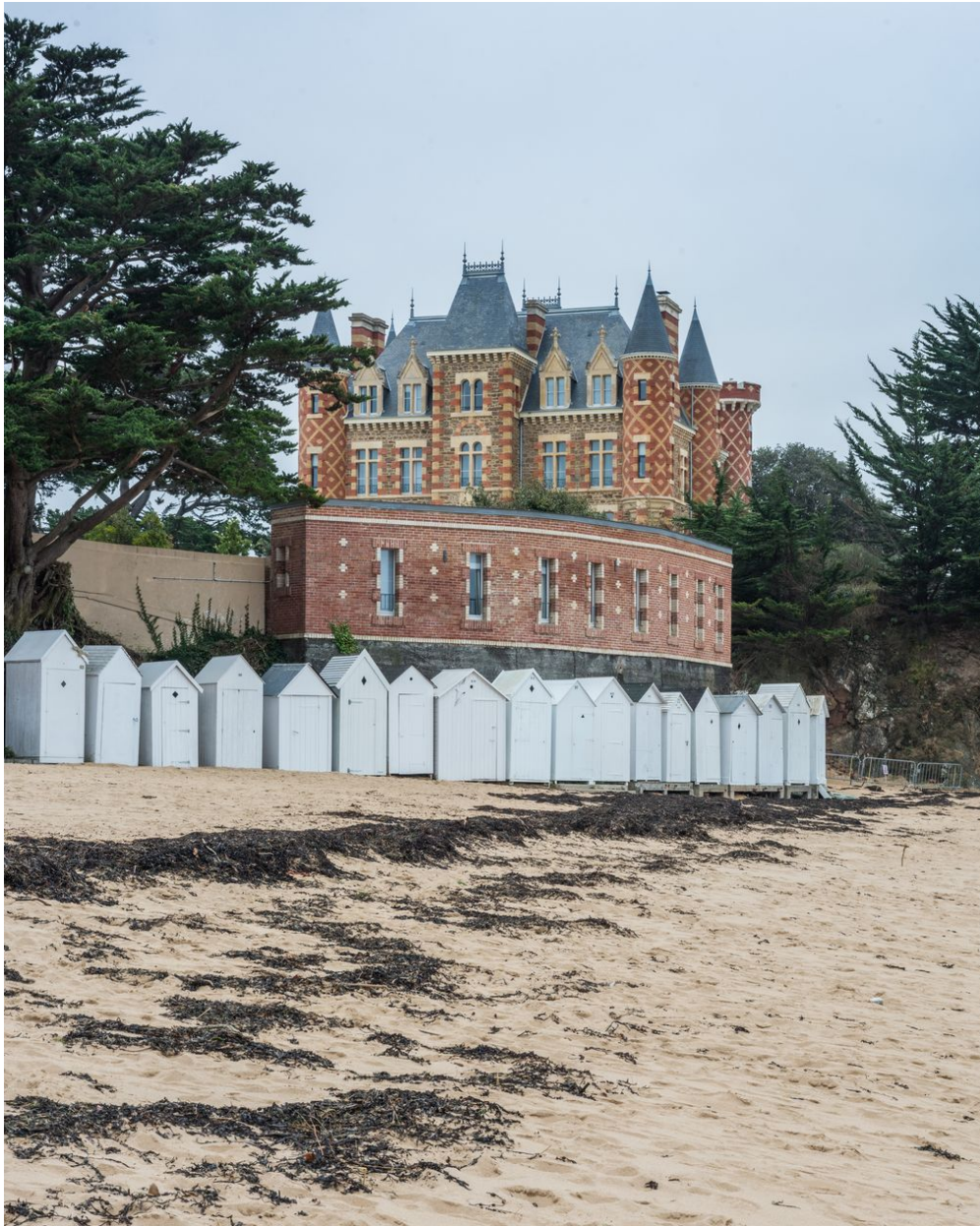
Vue de situation à l'ouest