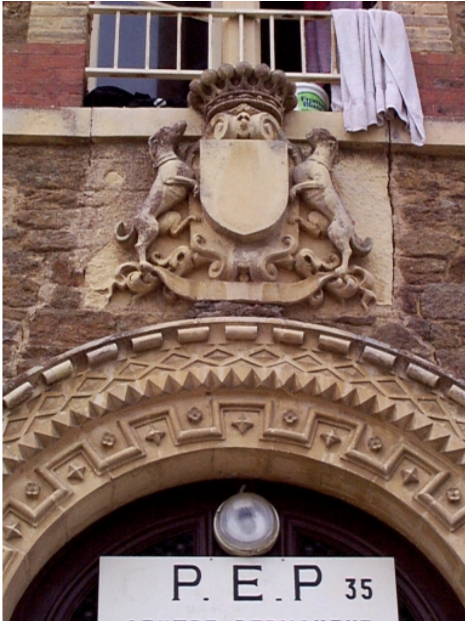
Détail : les armoiries muettes surmontées de la couronne comtale