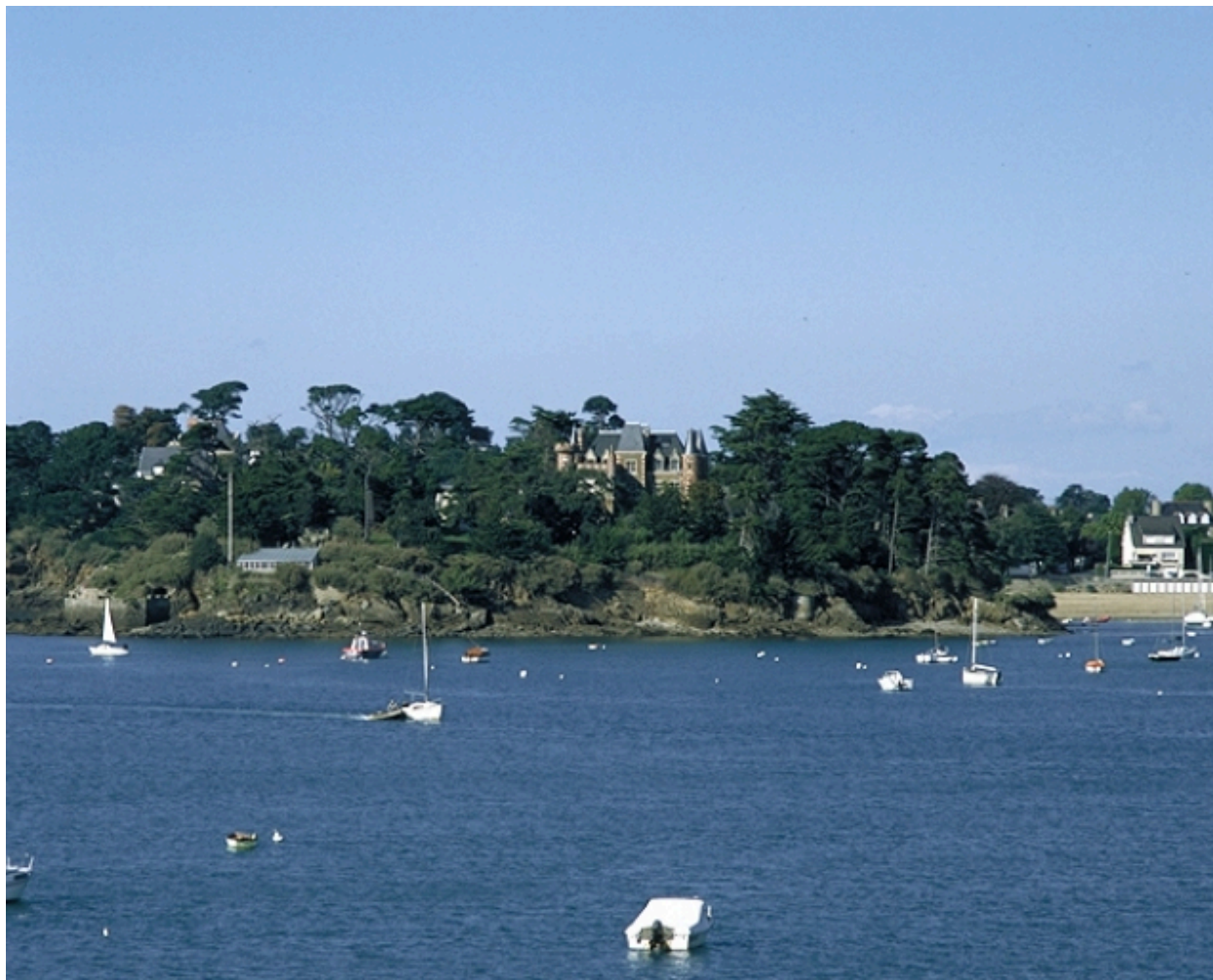
Vue de situation sud