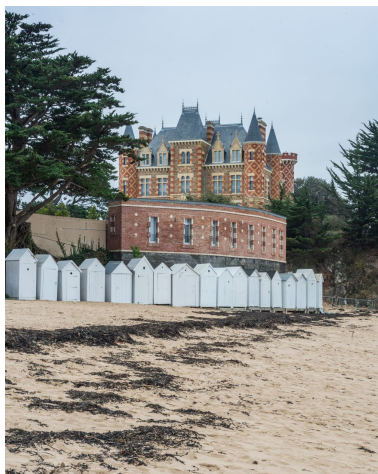
Vue de situation à l'ouest IVR53_20223500019NUCA