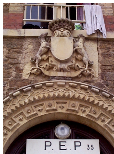
Détail : les armoiries muettes surmontées de la couronne comtale