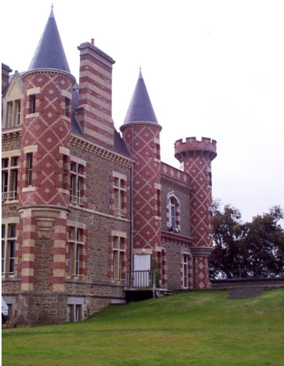
Elévation nord-ouest : vue générale