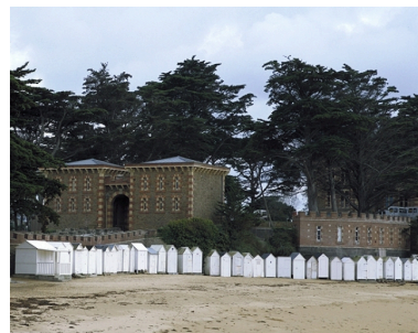
Vue de situation ouest IVR53_19993501921XA