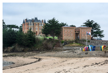
Vue depuis la plage du Bécet au nord-ouest: entrée du site avec les deux fausses redoutes et le corps de passage