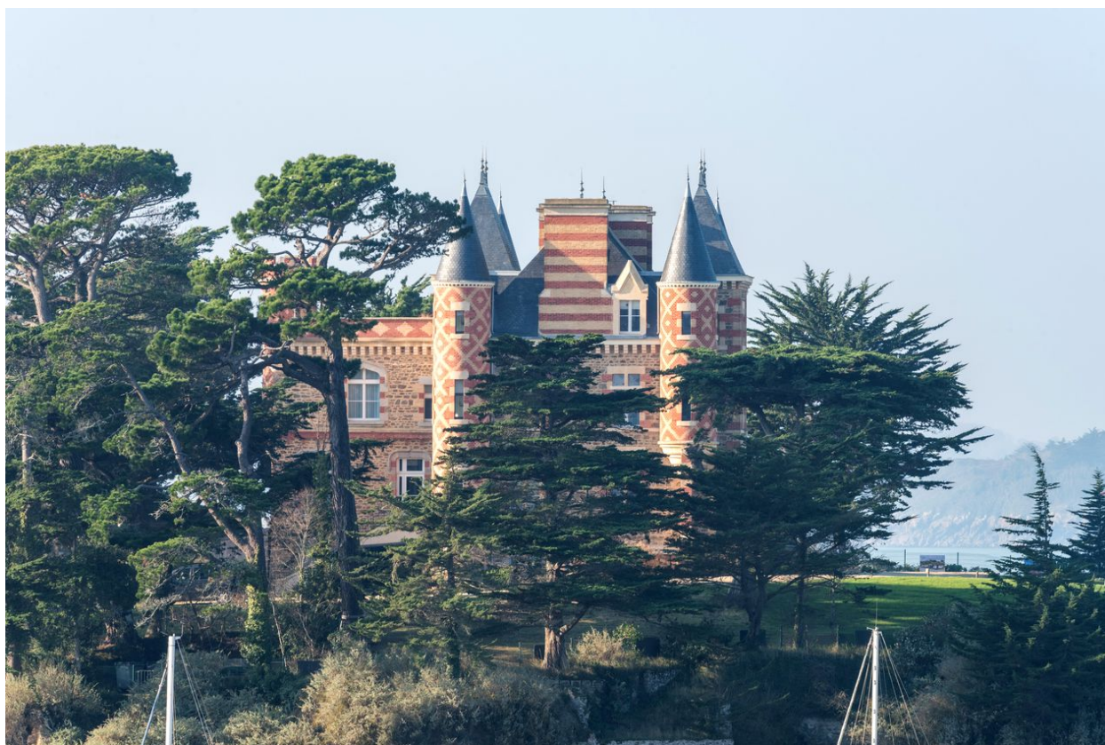
Vue générale depuis l'est