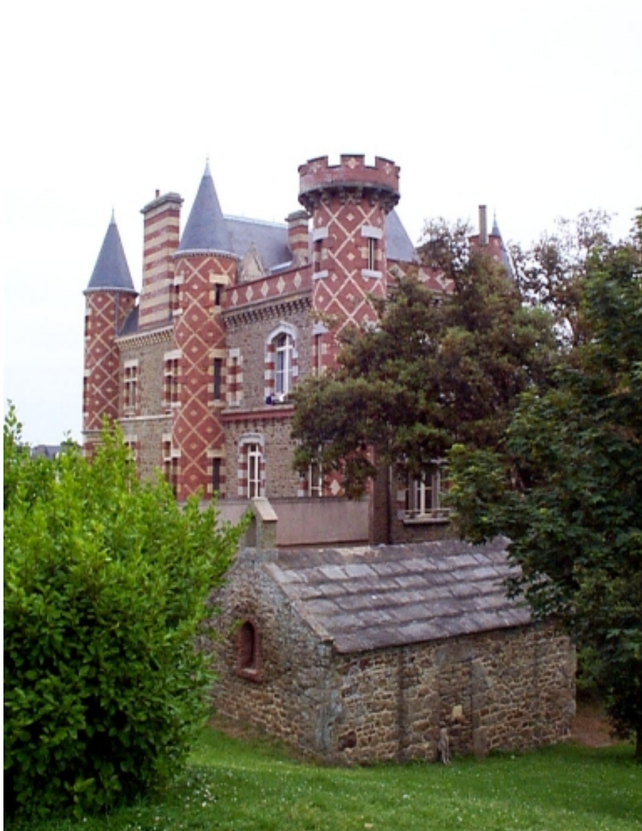
La chapelle : vue de situation sud