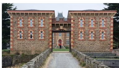
L'entrée et les deux fausses redoutes: vue d'ensemble, de face, depuis le nord IVR53_20223500017NUCA