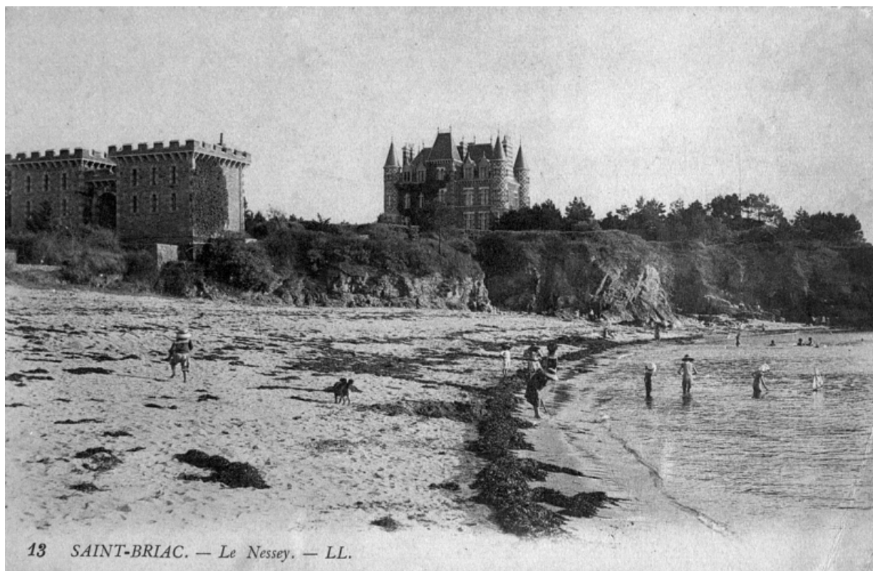
Le Nessay au début du 20e siècle