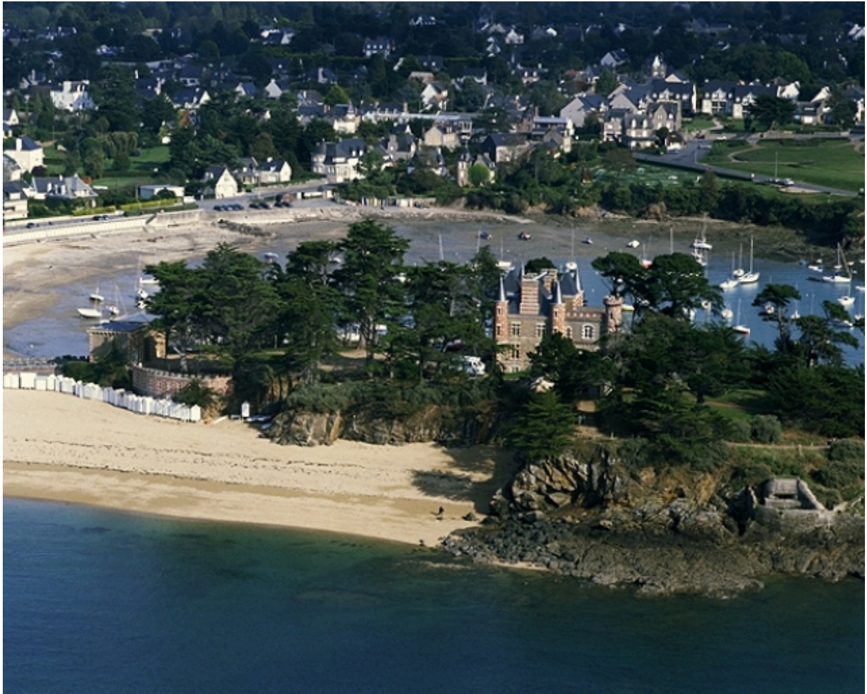
Vue aérienne depuis l'ouest