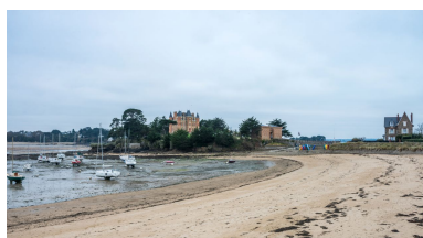
Vue de situation depuis la plage du Bécet au nord-ouest