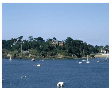
Vue de situation sud, IVR53_19993502041XA