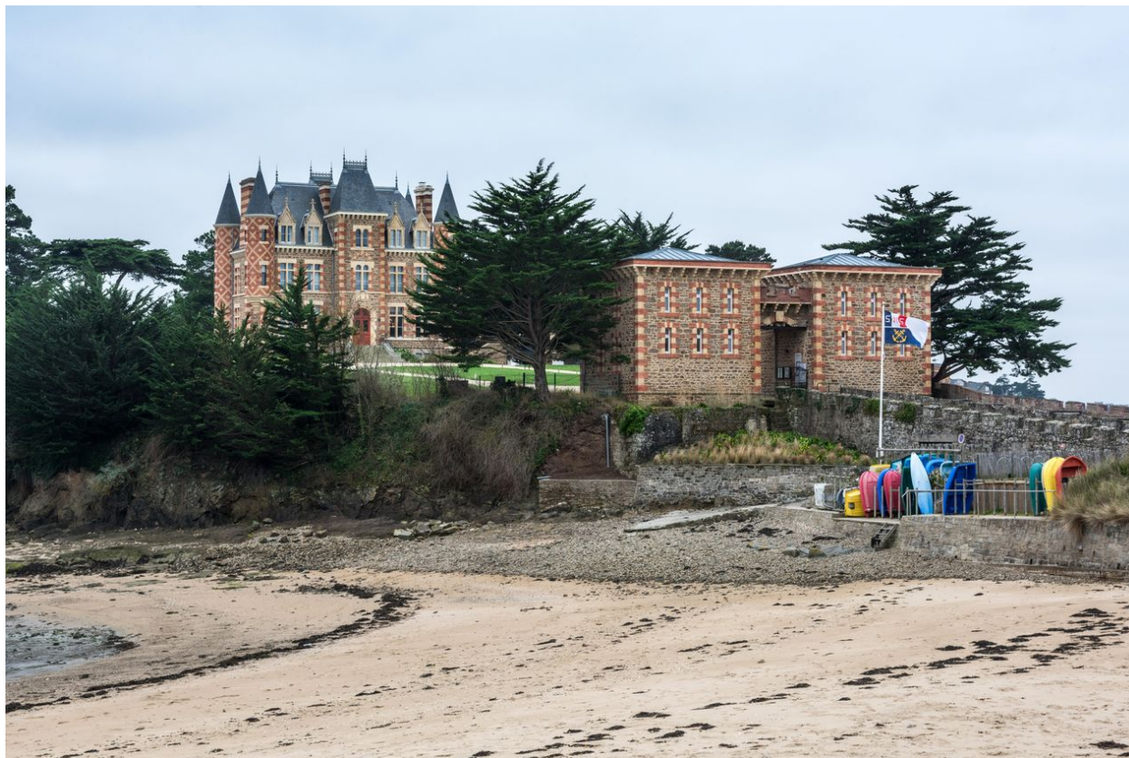
Vue depuis la plage du Béchet au nord-ouest: entrée du site avec les deux fausses redoutes et le corps de passage