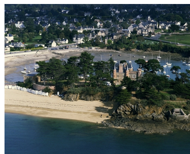
Vue aérienne depuis l'ouest