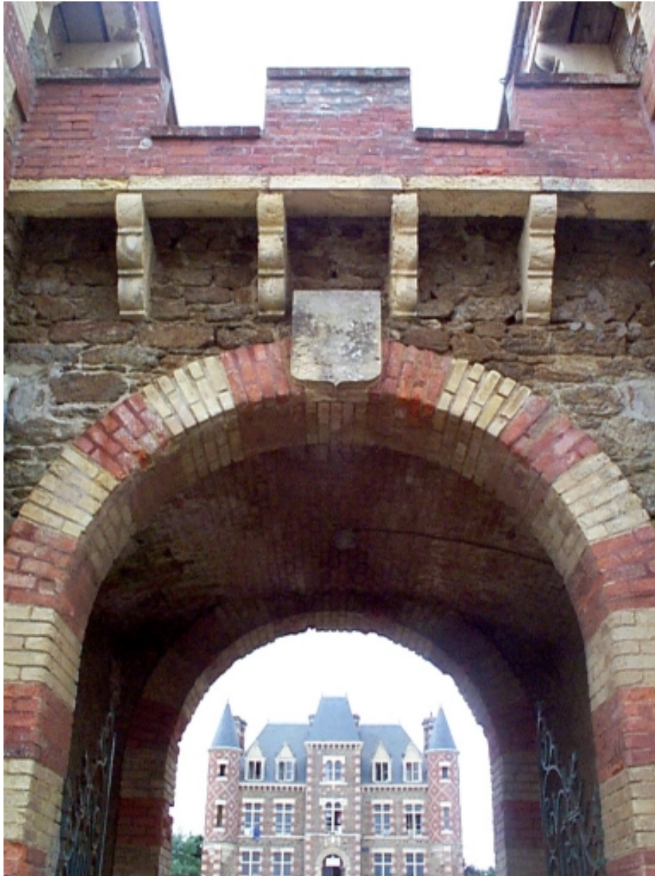
Vue depuis le corps de passage au nord