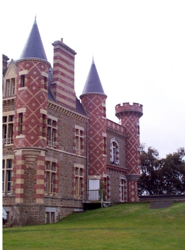
Elévation nord-ouest : vue générale IVR53_20003509080NUCA