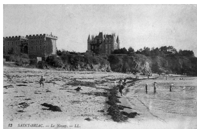
Le Nessay au début du 20e siècle