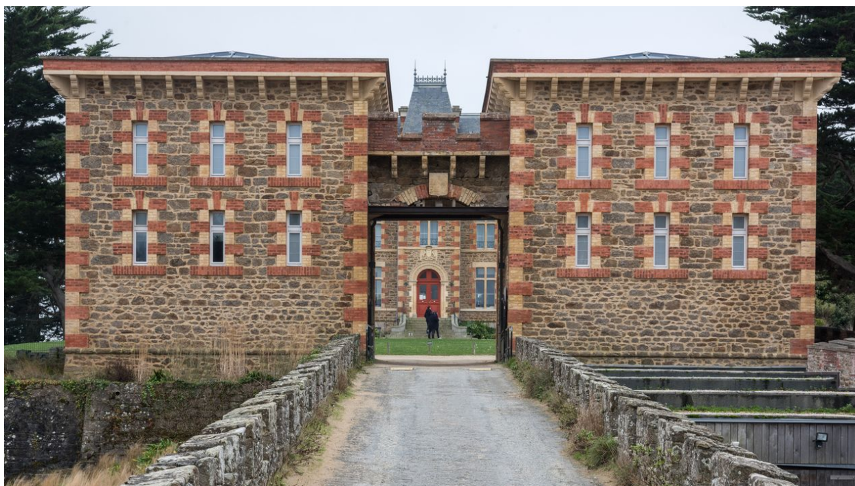
L'entrée et les deux fausses redoutes: vue d'ensemble, de face, depuis le nord