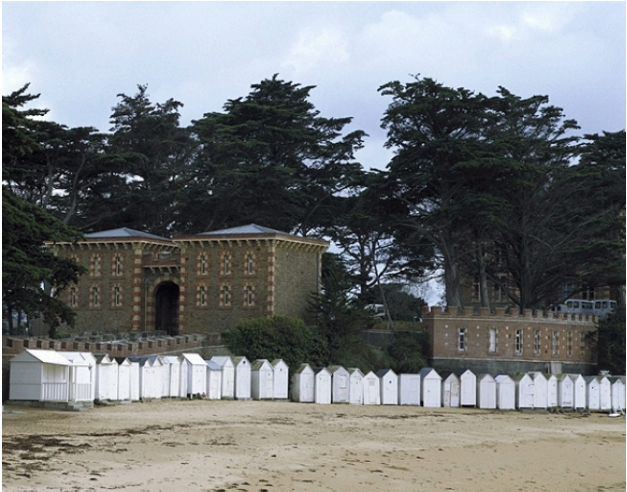
Vue de situation ouest