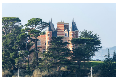
Vue générale depuis l'est IVR53_20223500044NUCA