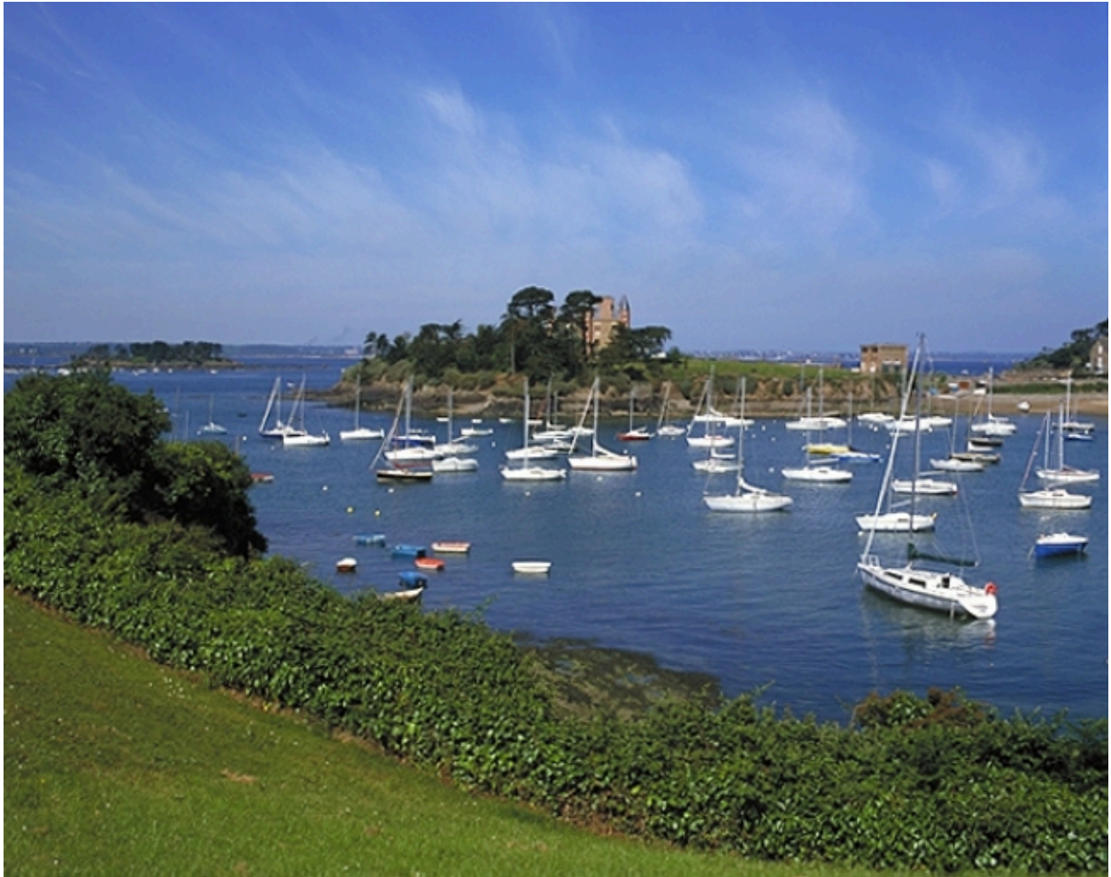
Vue de situation est