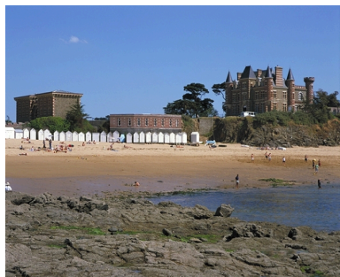
Vue de situation ouest IVR53_20003530657XA