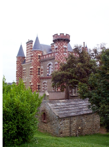
La chapelle : vue de situation sud IVR53_20003509081NUCA