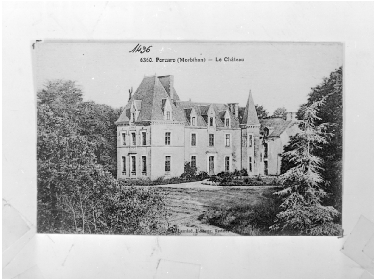
Le château (carte postale)