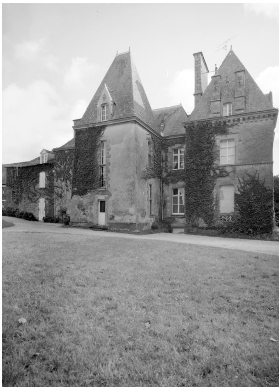
Elévation ouest du logis A.