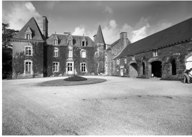
Vue générale sud-est. IVR53_19775600701V

Cadastre de 1847 (?), rénové en 1924, t. I, section C4 IVR53_19775600380V