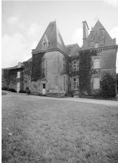
Elévation ouest du logis A. IVR53_19775600702V