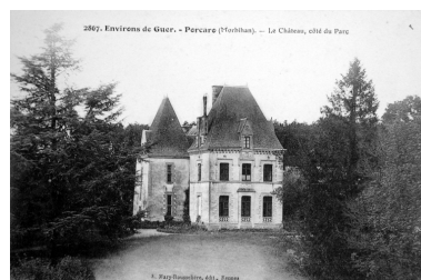
Vue latérale IVR53_20045606195NUCB