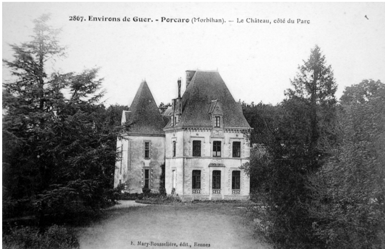
Vue latérale (Archives départementales d'Ille-et-Vilaine, 6 Fi Porcaro)