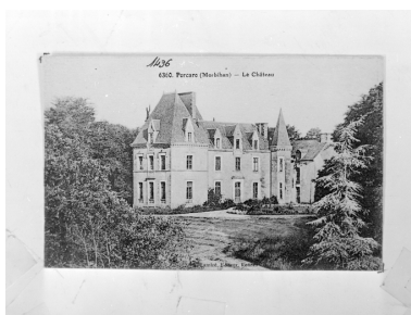
Le château (carte postale) IVR53_19785601307XB