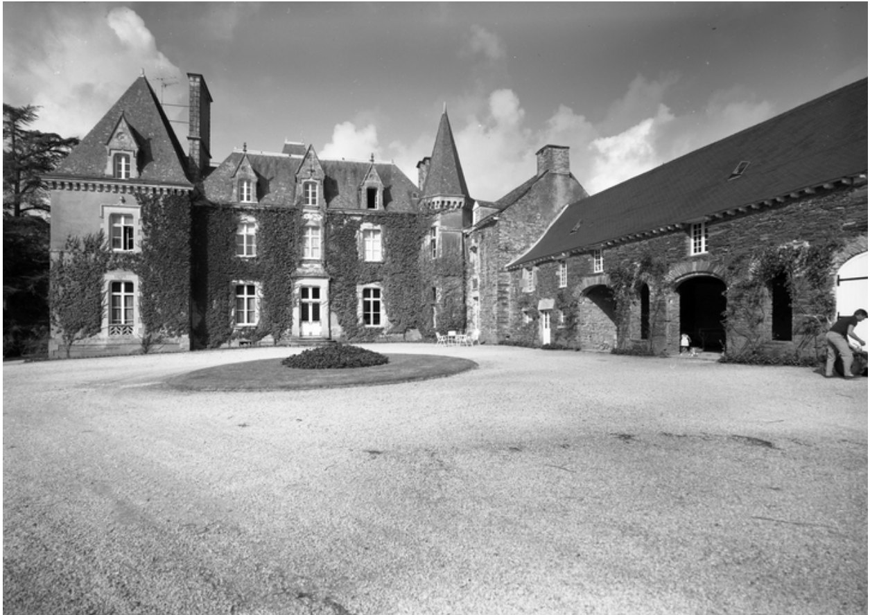
Vue générale sud-est.