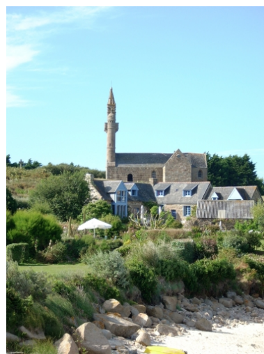
Carantec, chapelle Notre-Dame : vue de situation depuis le sud IVR53_20082906594NUCA