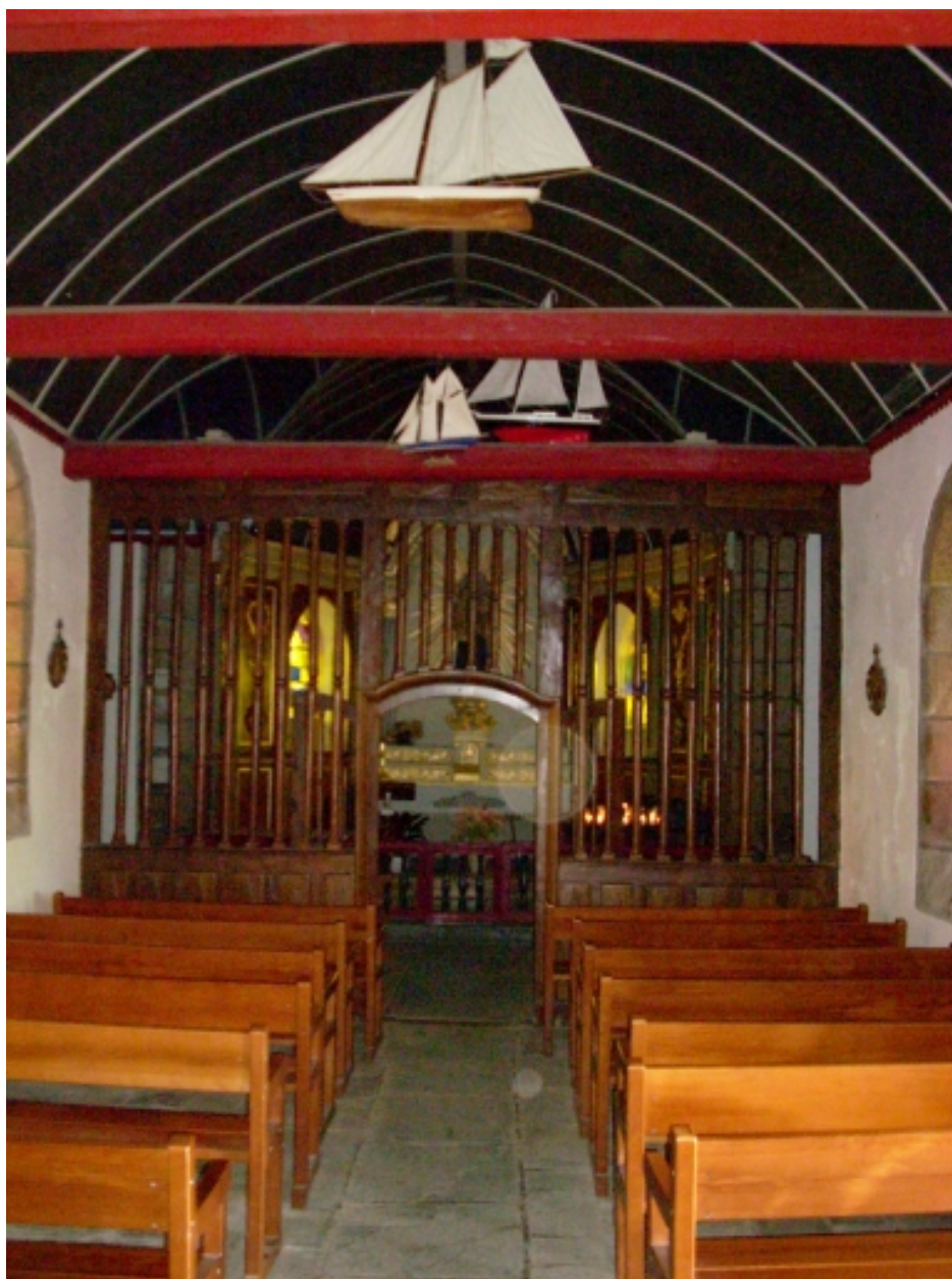
Carantec, chapelle Notre-Dame : vue axiale est