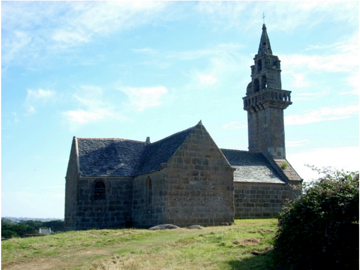
Carantec, chapelle Notre-Dame : vue générale nord-est