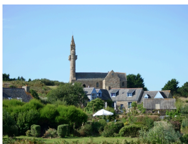
Carantec, chapelle Notre-Dame : vue de situation depuis le sud-ouest IVR53_20082906593NUCA