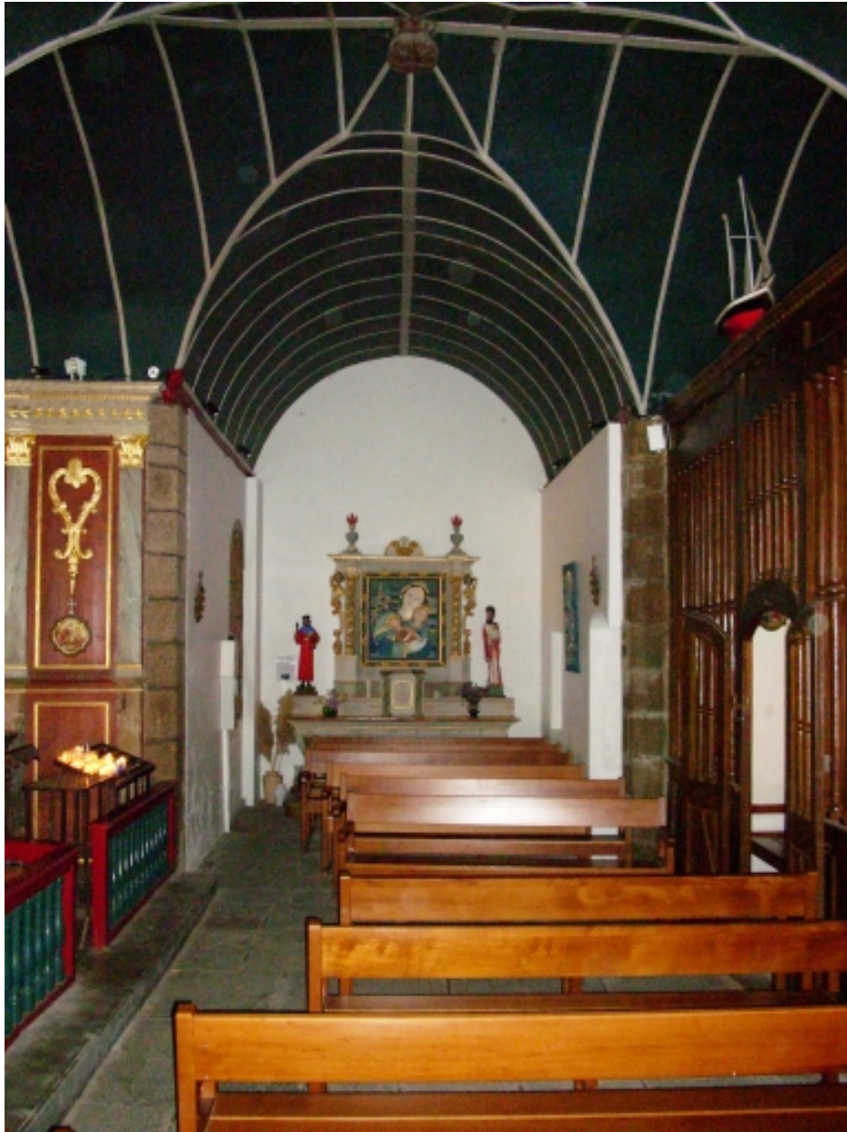
Carantec, chapelle Notre-Dame : vue axiale sud du bras sud du transept