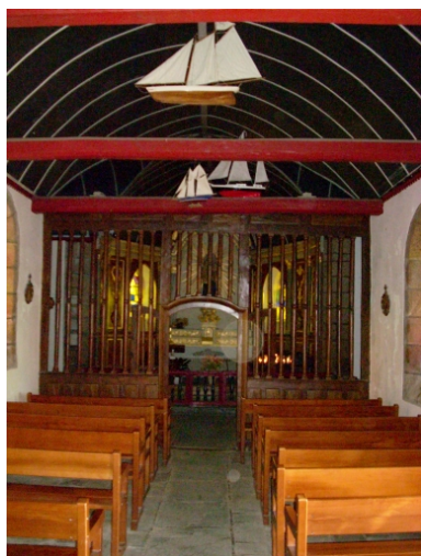
Carantec, chapelle Notre- Dame : vue axiale est IVR53_20082906598NUCA