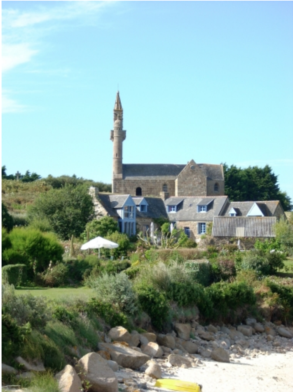
Carantec, chapelle Notre-Dame : vue de situation depuis le sud