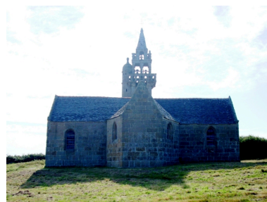
Carantec, chapelle Notre- Dame : élévation est IVR53_20082906597NUCA