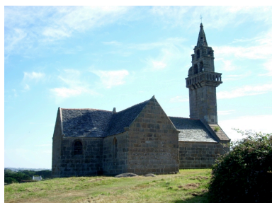
Carantec, chapelle Notre- Dame : vue générale nord-est IVR53_20082906595NUCA