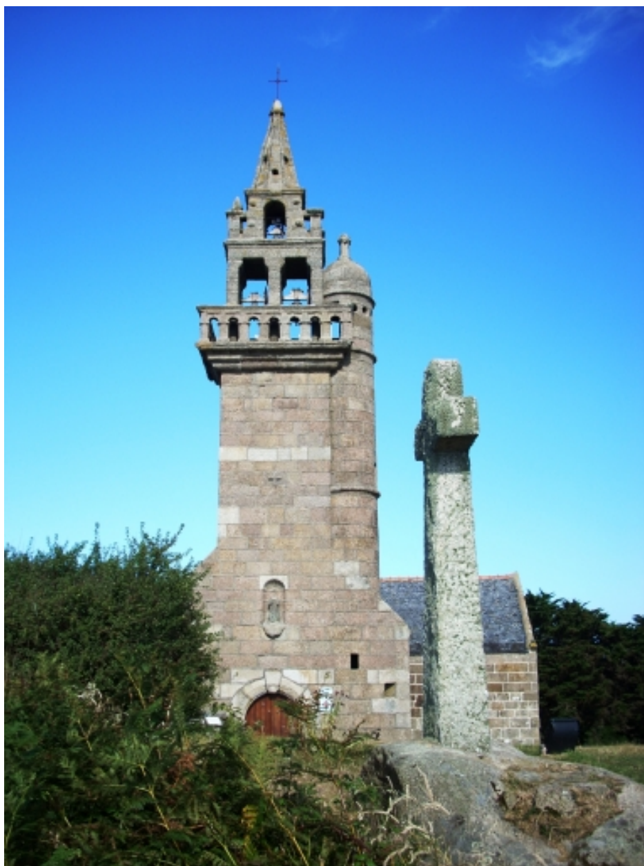
Carantec, chapelle Notre-Dame : élévation ouest