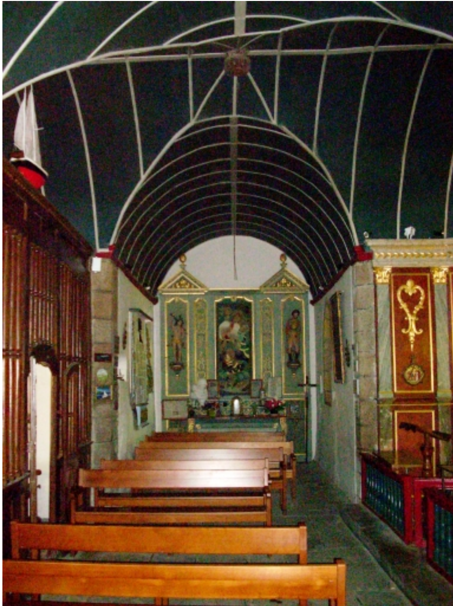
Carantec, chapelle Notre-Dame : vue axiale nord du bras nord du transept