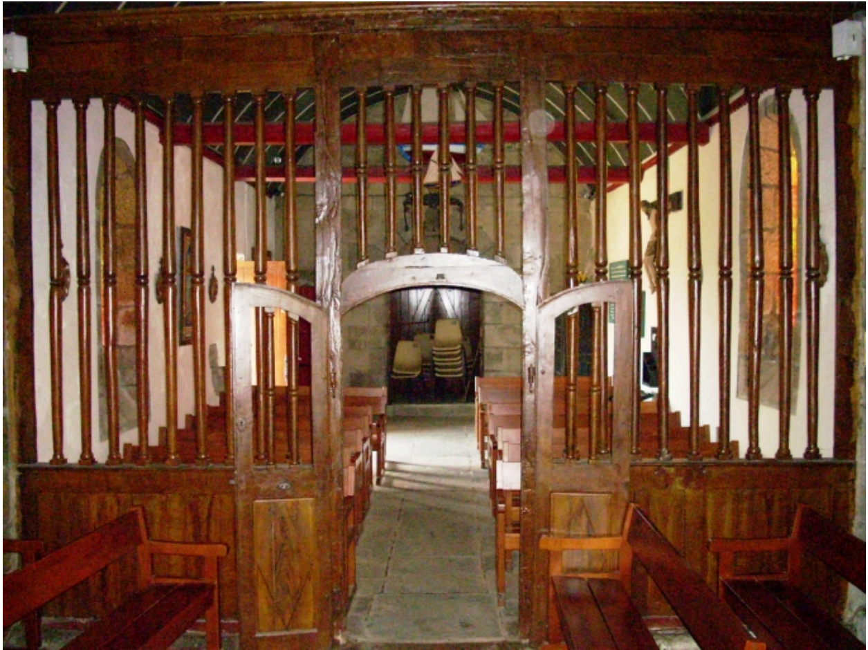
Carantec, chapelle Notre-Dame : vue axiale ouest