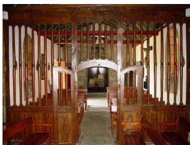
Carantec, chapelle Notre- Dame : vue axiale ouest IVR53_20082906599NUCA