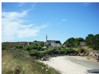
Carantec, chapelle Notre-Dame : vue de situation depuis le sud