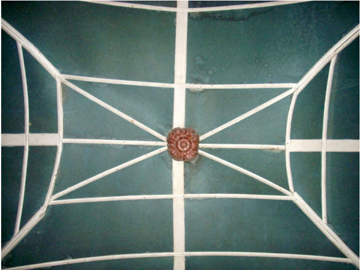
Carantec, chapelle Notre-Dame : lambris de couverture à la croisée du transept