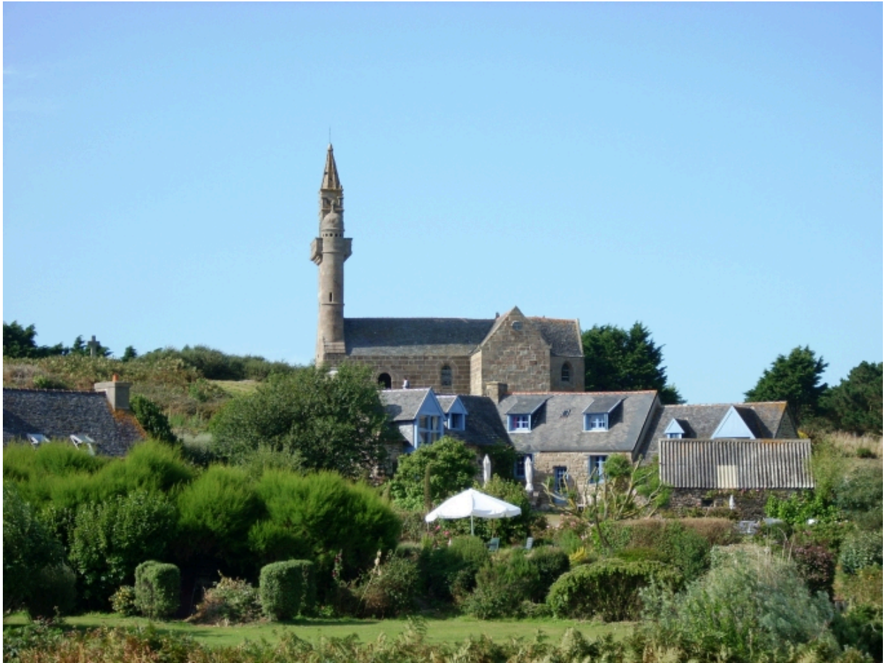
Carantec, chapelle Notre-Dame : vue de situation depuis le sud-ouest