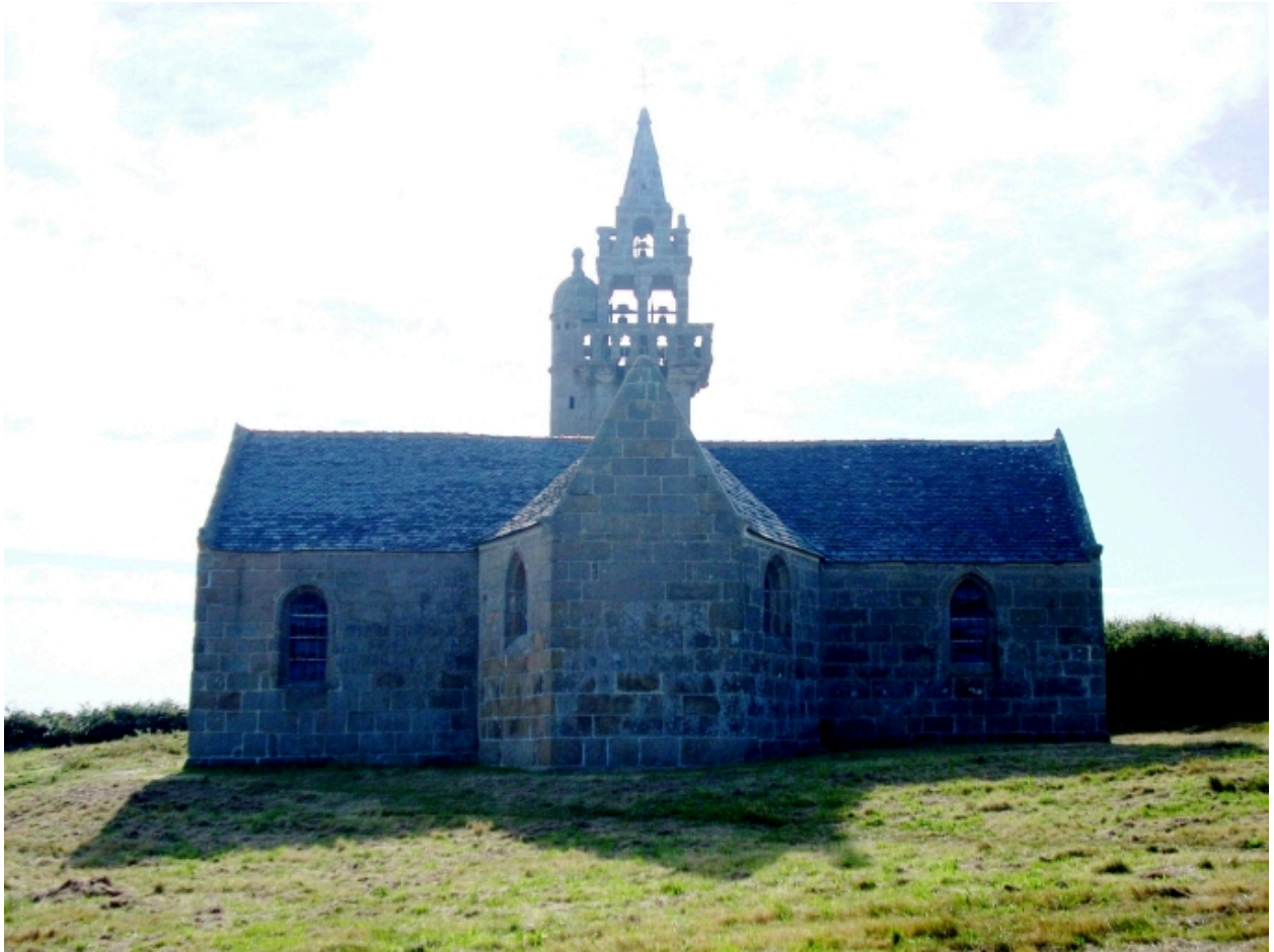
Carantec, chapelle Notre-Dame : élévation est