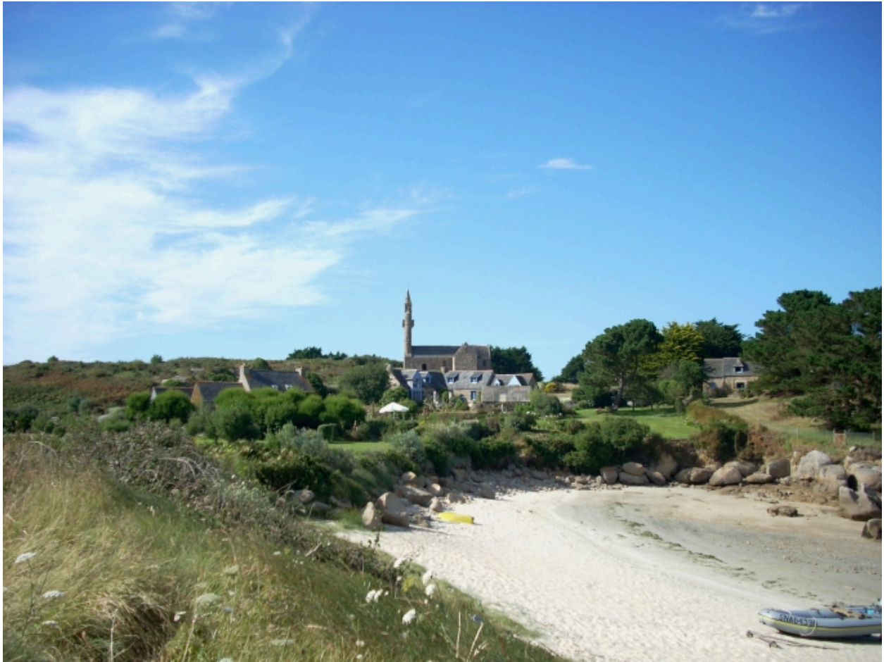
Carantec, chapelle Notre-Dame : vue de situation depuis le sud