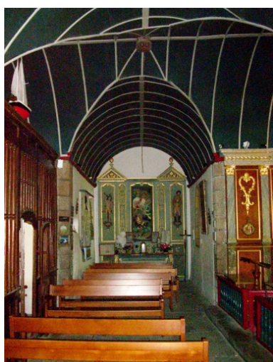
Carantec, chapelle Notre-Dame : vue axiale nord du bras nord du transept IVR53_20082906601NUCA