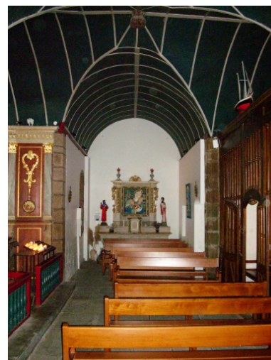
Carantec, chapelle Notre-Dame : vue axiale sud du bras sud du transept IVR53_20082906600NUCA