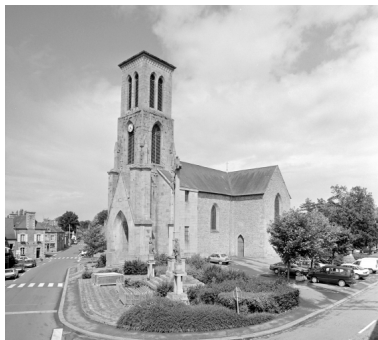
Elévation Sud-Ouest : vue générale IVR53_19943501318X