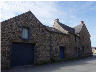
Vue de la façade nord