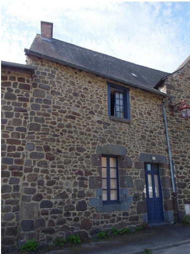
Vue de la façade nord