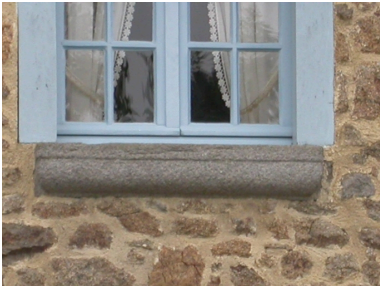
Détail de l'appui de la fenêtre de l'étage