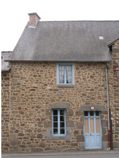
Vue générale nord IVR53_20053518221NUCA