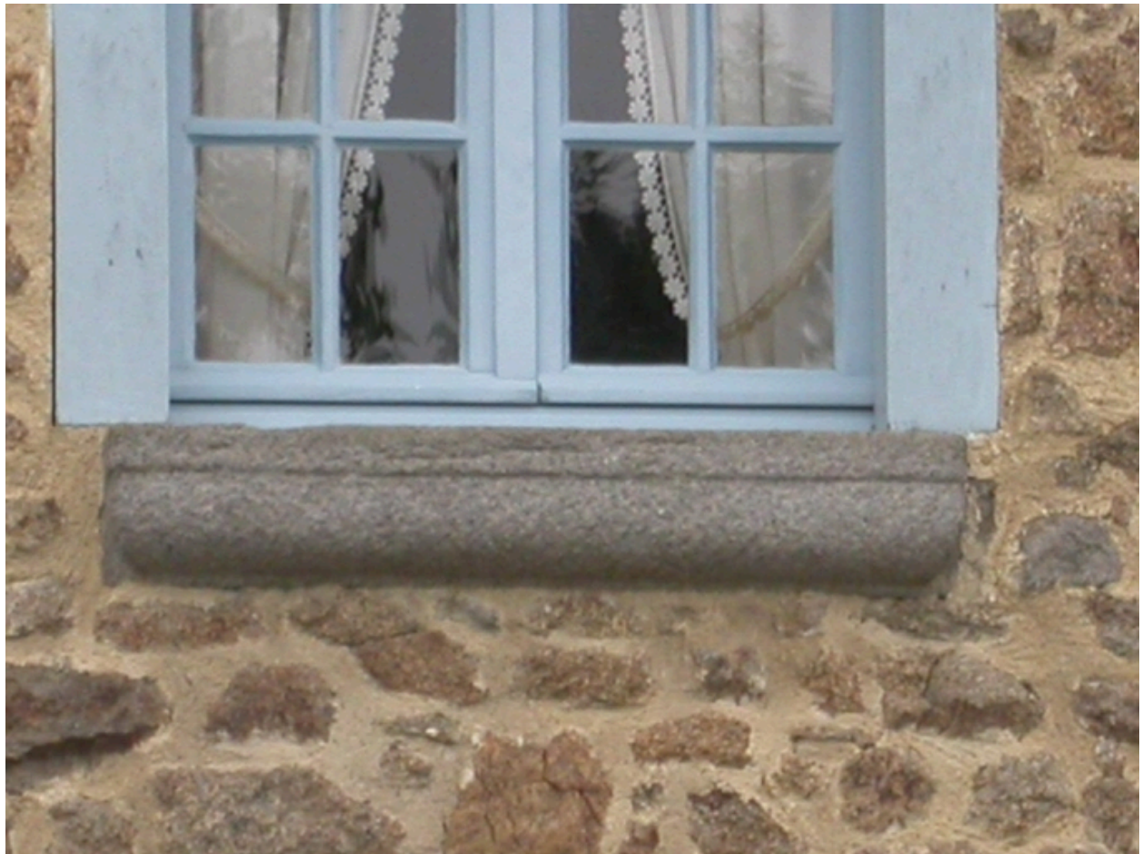
Détail de l'appui de la fenêtre de l'étage