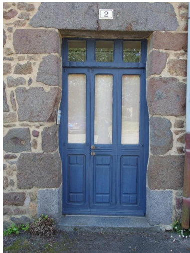
Détail de la façade nord IVR53_20243532298NUCA