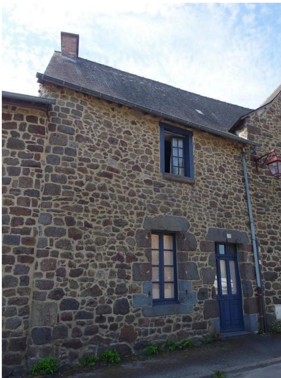
Vue de la façade nord