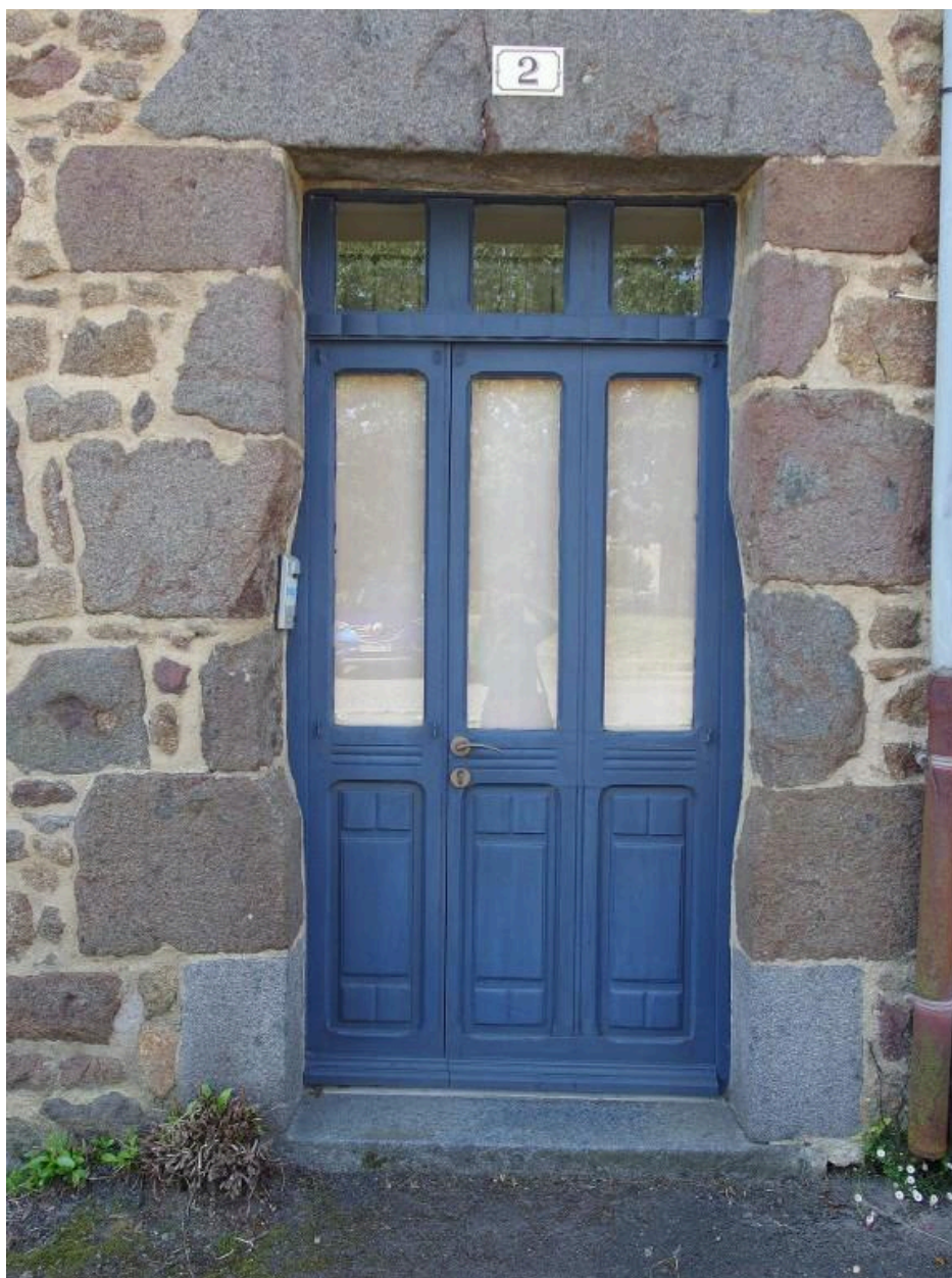
Détail de la façade nord