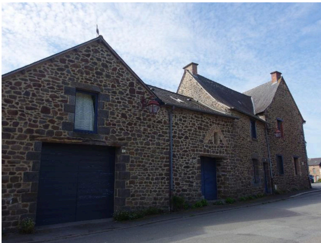
Vue de la façade nord