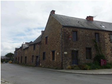
Vue de la façade nord depuis la place de l'église IVR53_20243532299NUCA