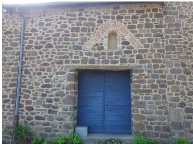
Détail de la façade nord