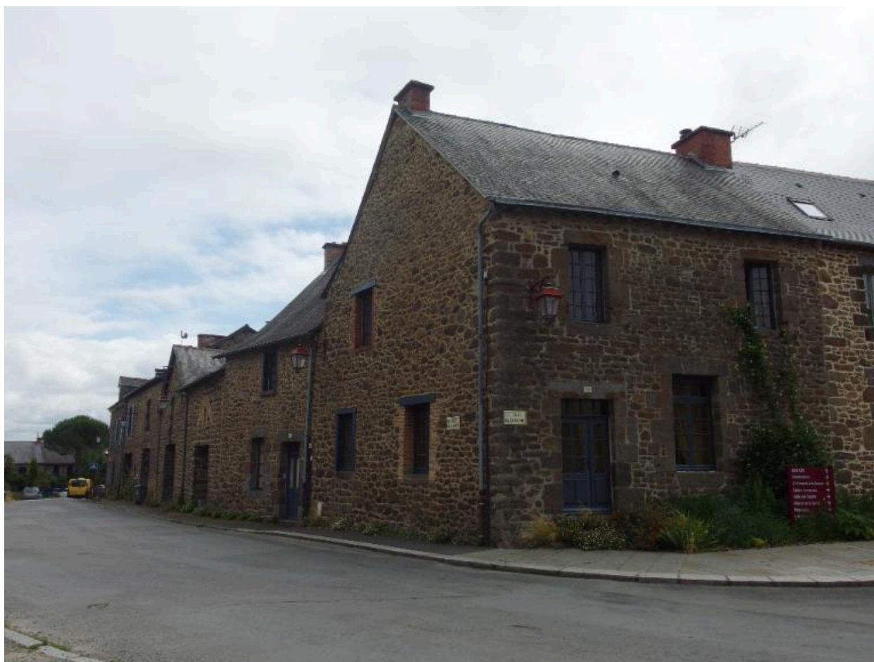
Vue de la façade nord depuis la place de l'église