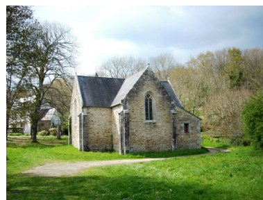
Moëlan-sur-Mer, chapelle de Lanriot : vue générale sud-est