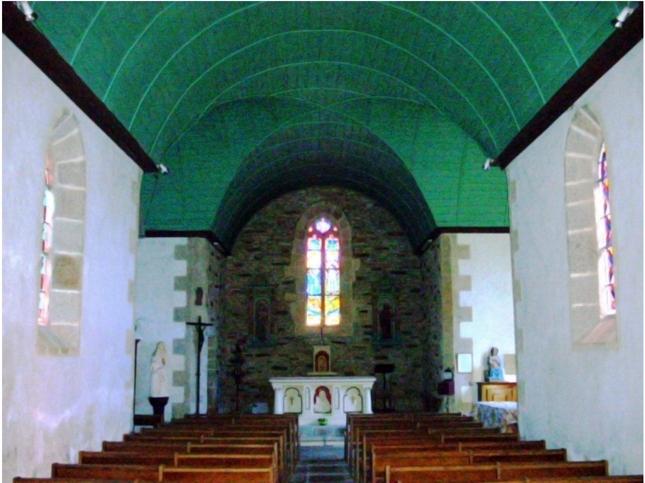
Moëlan-sur-Mer, chapelle de Lanriot : vue axiale est