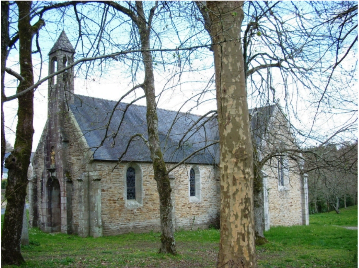
Moëlan-sur-Mer, chapelle de Lanriot : vue générale sud-ouest