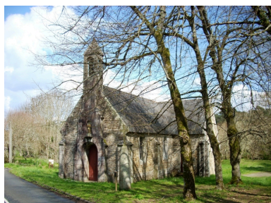
Moëlan-sur-Mer, chapelle de Lanriot : vue générale sud-ouest IVR53_20082905683NUCA