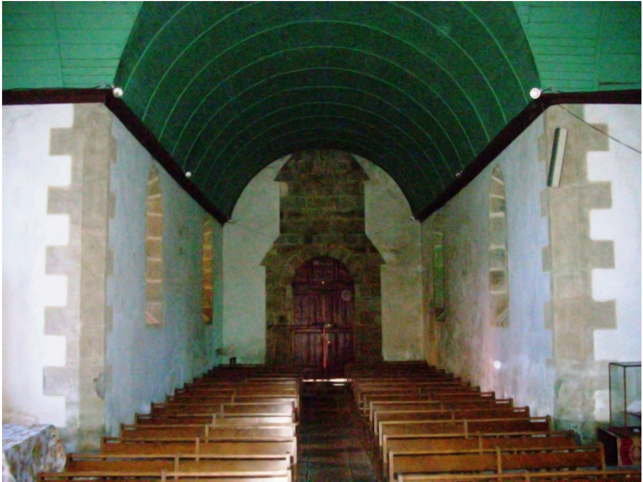
Moëlan-sur-Mer, chapelle de Lanriot : vue axiale ouest