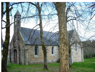
Moëlan-sur-Mer, chapelle de Lanriot : vue générale sud-ouest IVR53_20082905684NUCA