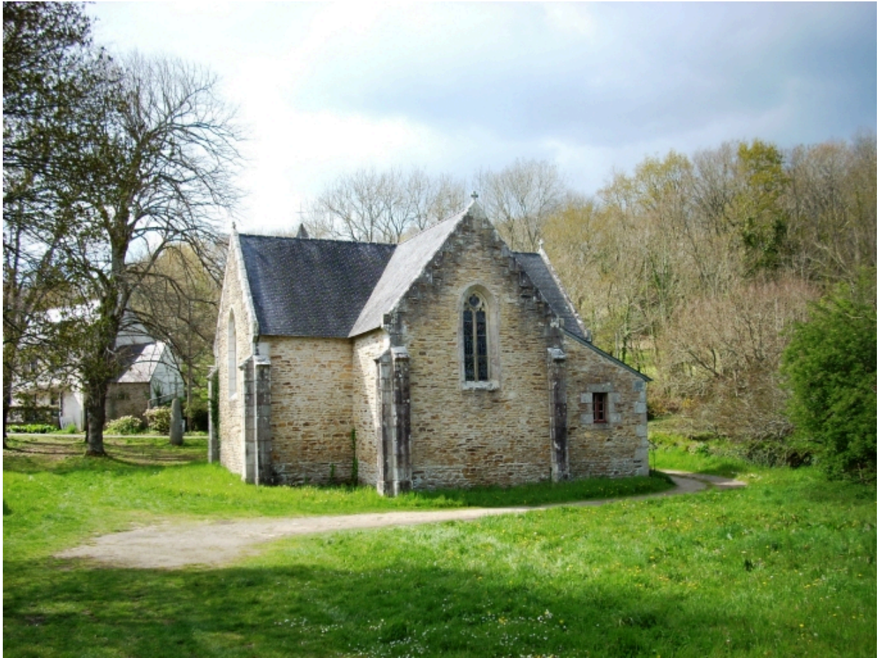
Moëlan-sur-Mer, chapelle de Lanriot : vue générale sud-est