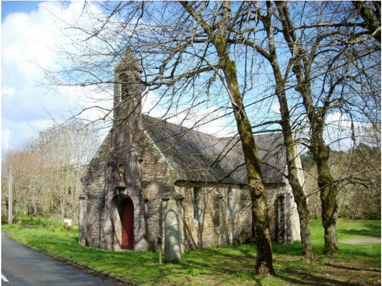
Moëlan-sur-Mer, chapelle de Lanriot : vue générale sud-ouest