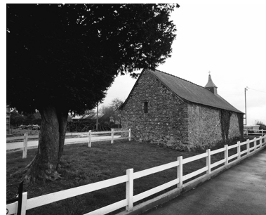
Vue de situation depuis le nord- est avec l'iff au premier plan.