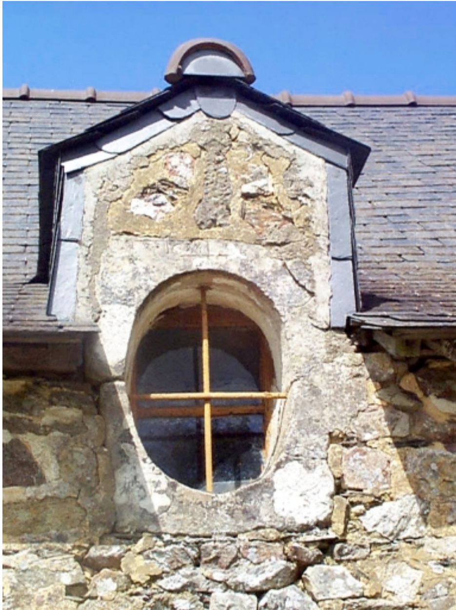
Oculus portant la date : 1674.