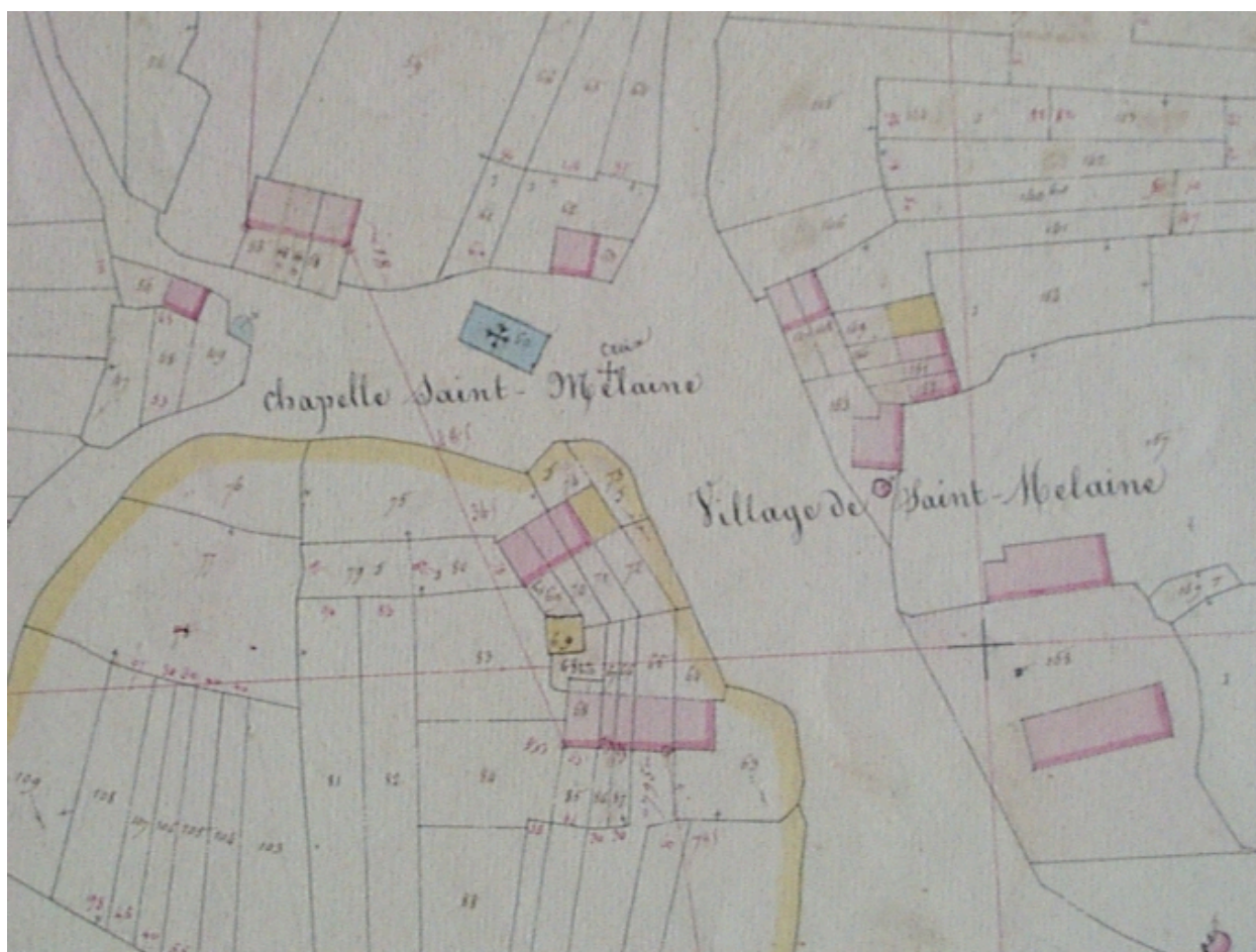
La chapelle sur le cadastre ancien de 1830