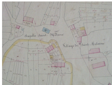
La chapelle sur le cadastre ancien de 1830 IVR53_19983503765NUC