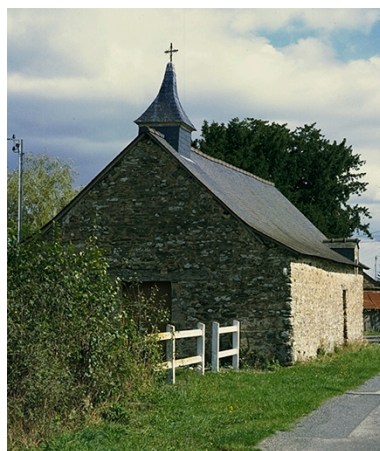
Vue générale sud ouest. IVR53_19993500693XA