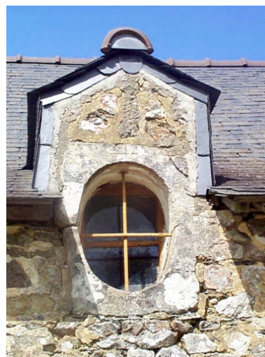
Oculus portant la date : 1674. IVR53_19983503726NUCA