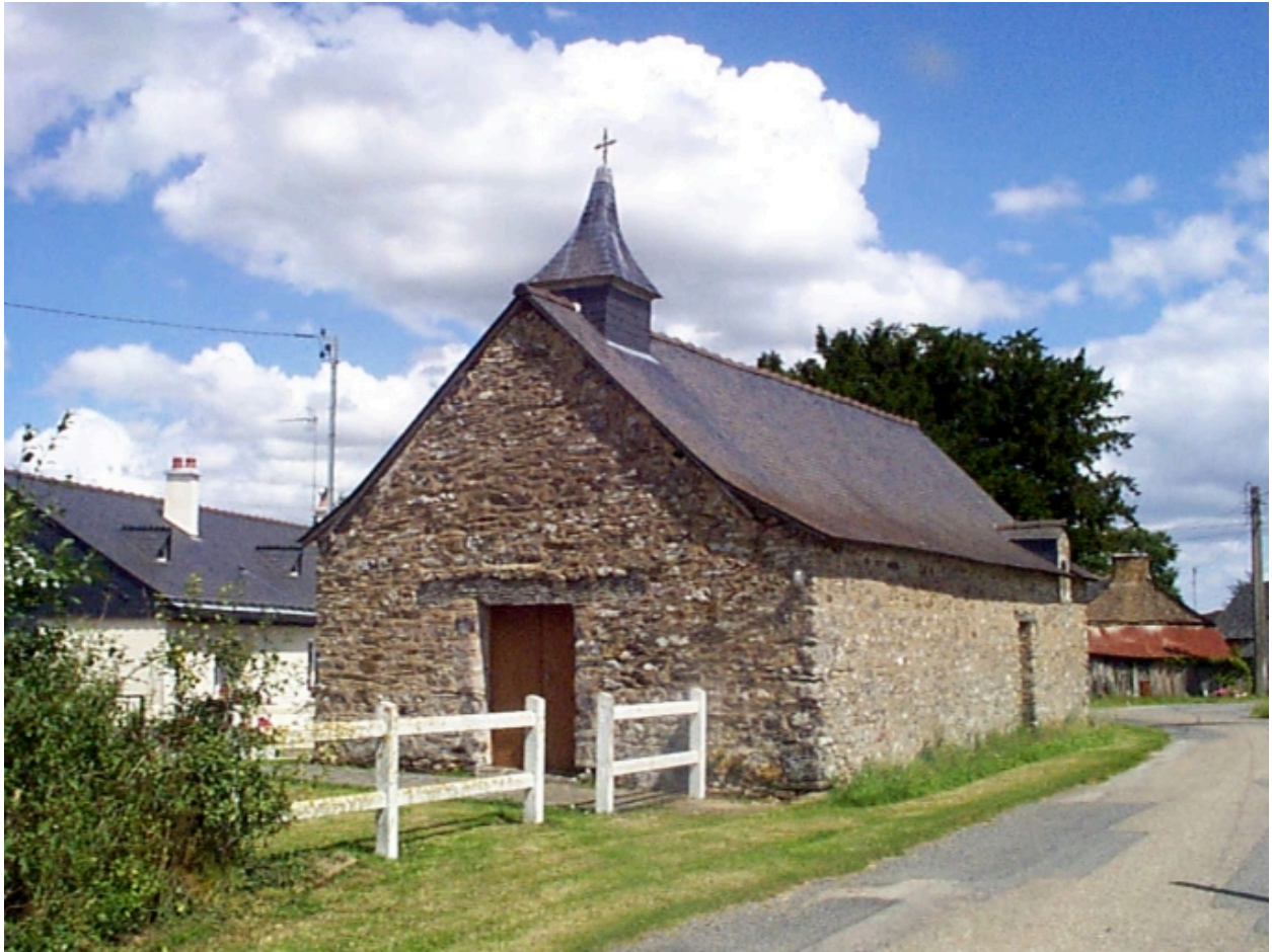
Vue générale sud ouest.