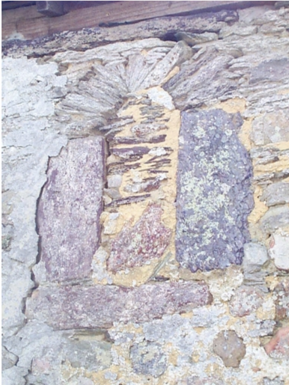
Petite fenêtre au nord côté est.