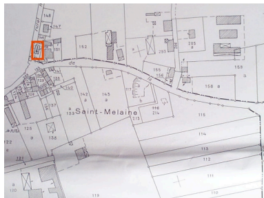
La chapelle sur le cadastre rénové de 1983