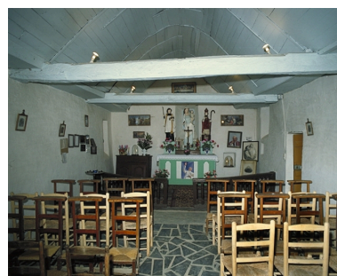
Vue intérieure IVR53_20003500109XA