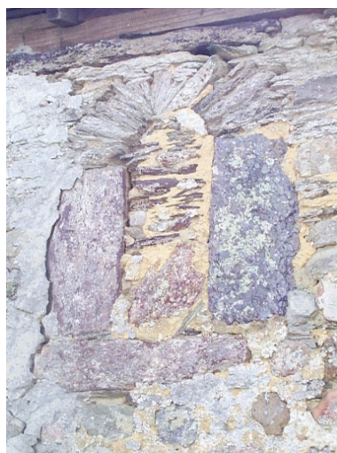
Petite fenêtre au nord côté est. IVR53_19983503725NUCA