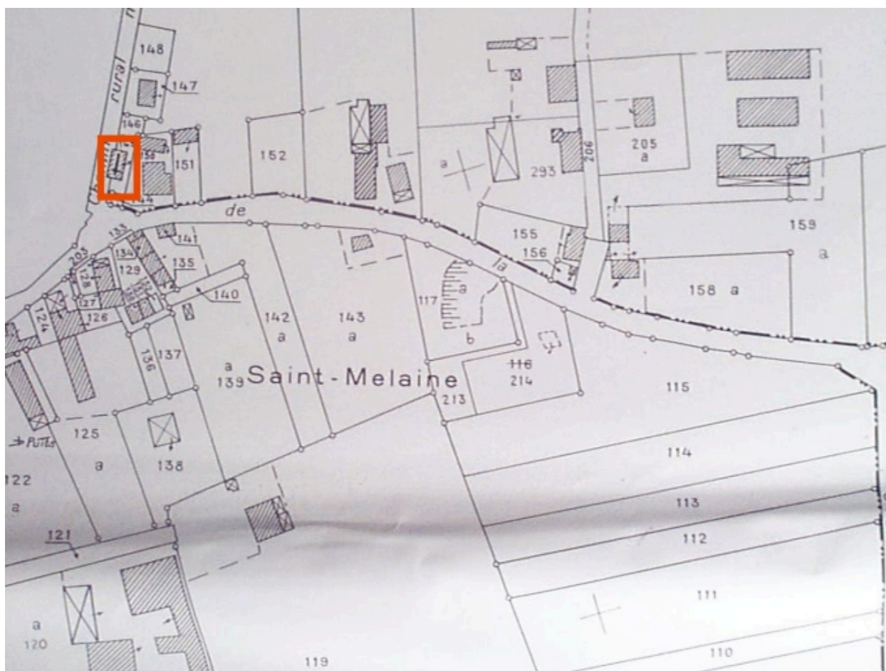
La chapelle sur le cadastre rénové de 1983