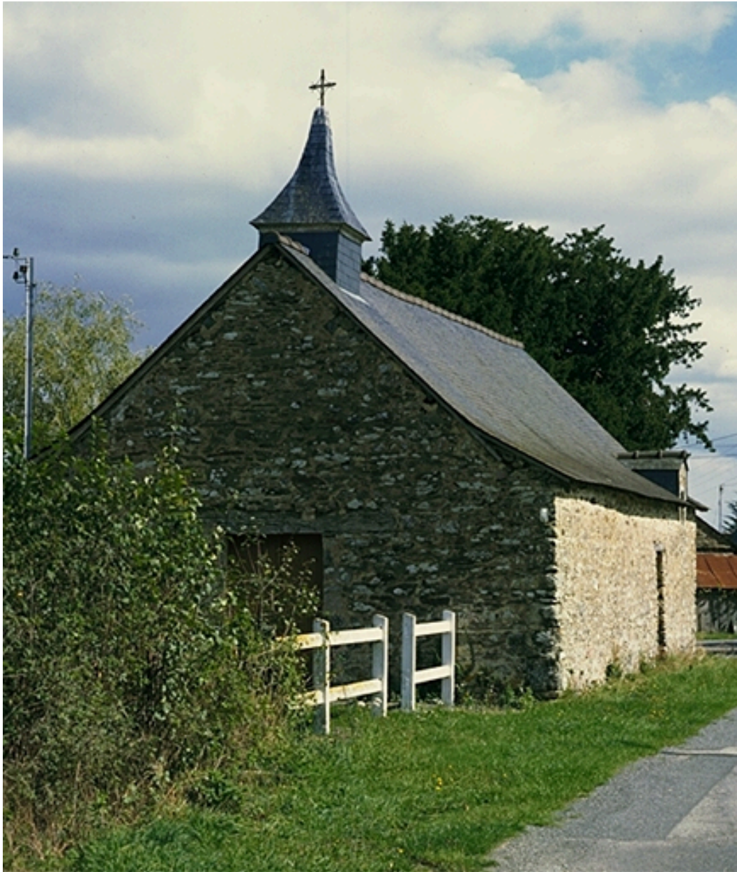
Vue générale sud ouest.