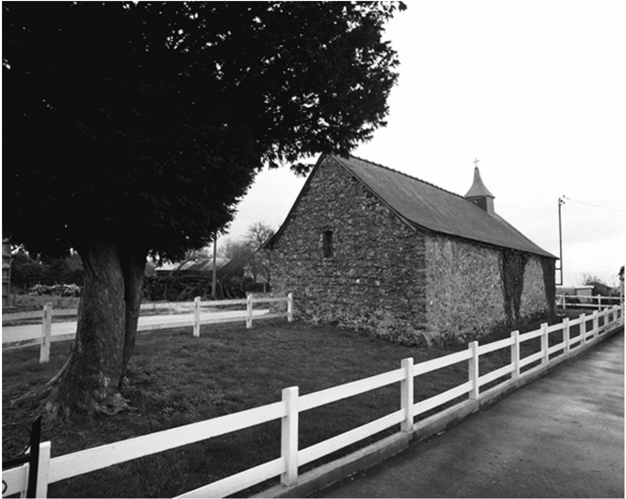
Vue de situation depuis le nord-est avec l'iff au premier plan.