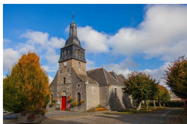
Vue générale, église Saint-André, Lanhélin IVR53_20153505415NUCA