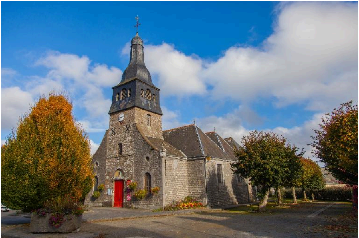
Vue générale, église Saint-André, Lanhélin