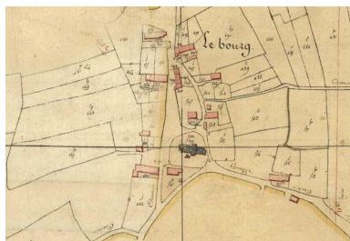
Extrait du cadastre. Section A1 et A2 de l'église, 1826 (A.D. Ille-et-Vilaine, 3 P 5376) IVR53_20153505416NUCA