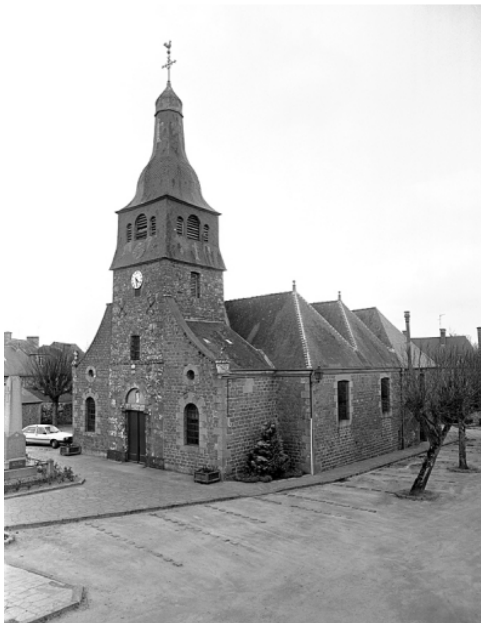
Elévation sud-ouest ; vue générale (état en 1994)