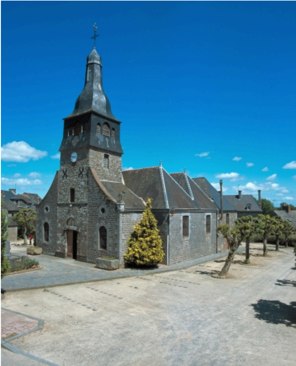
Vue générale sud-ouest (état en 2001)