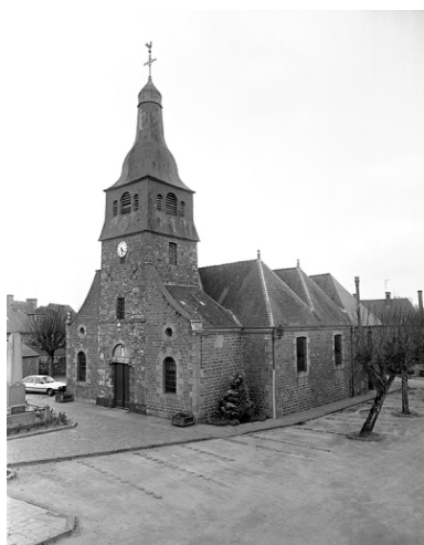
Elévation sud-ouest ; vue générale (état en 1994)