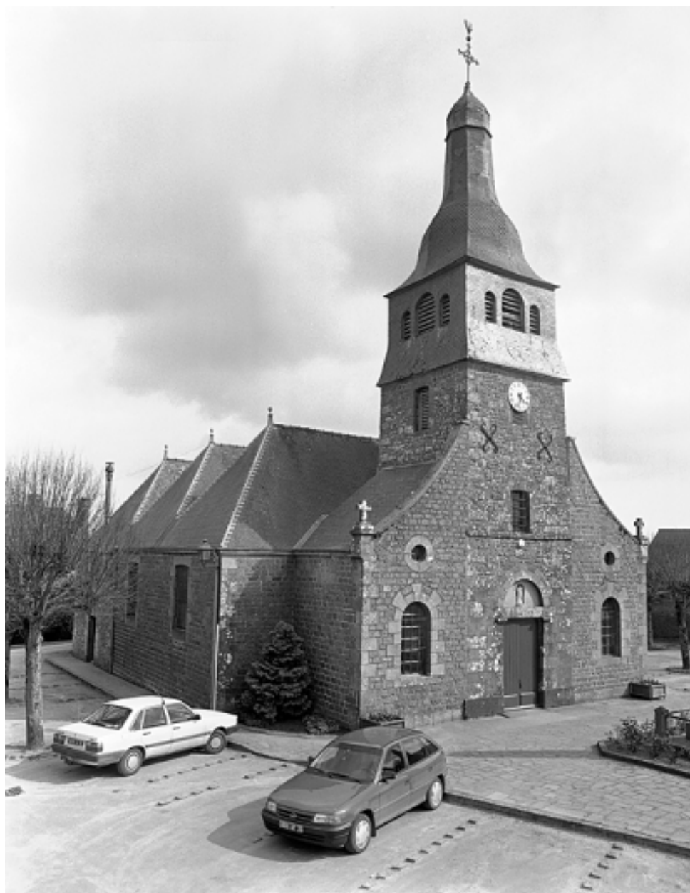
Elévation nord-ouest ; vue générale (état en 1994)