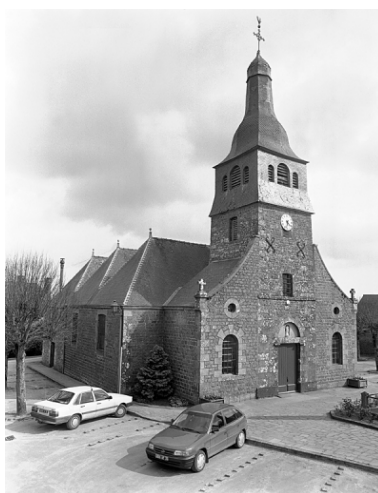
Elévation nord-ouest ; vue générale (état en 1994) IVR53_19943500764X