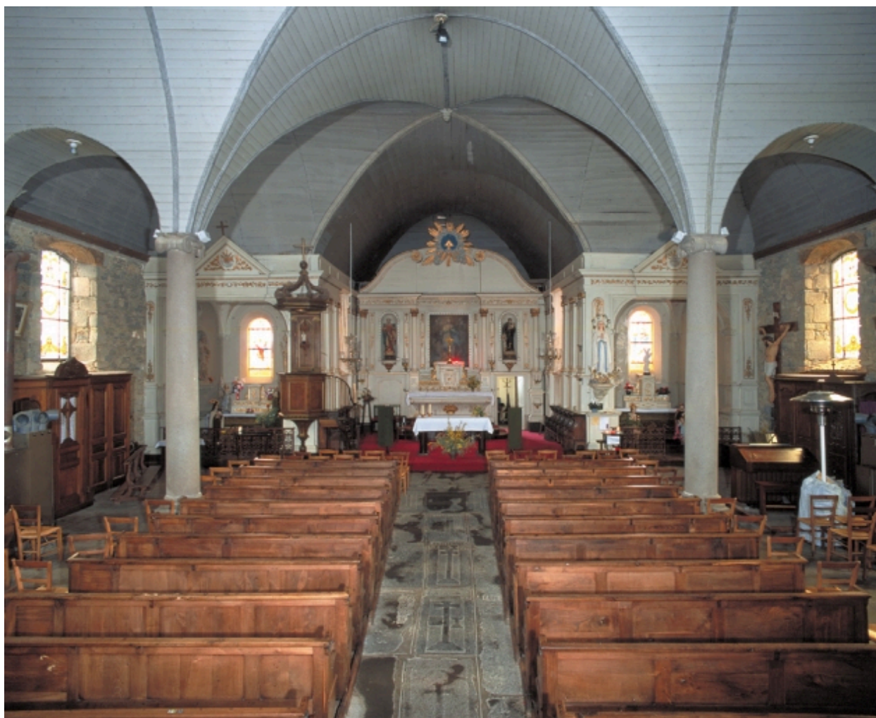
Vue intérieure vers le chœur (état en 2002)