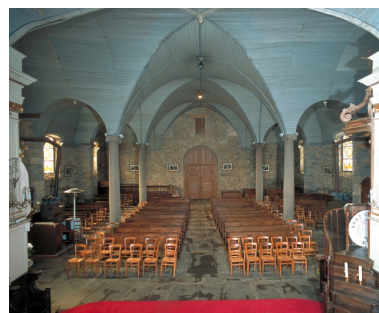
Vue intérieure prise du chœur vers la nef (état en 2002) IVR53_20023500505XA