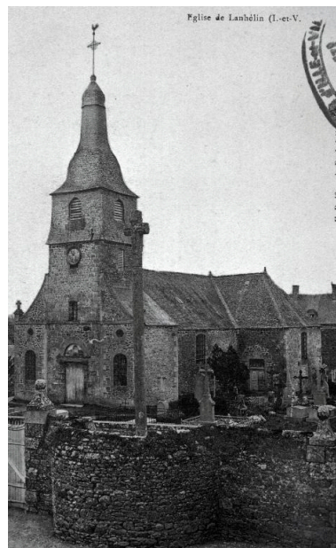
Élévation sud-ouest ; vue générale au début du 20e siècle IVR53_19933500579X