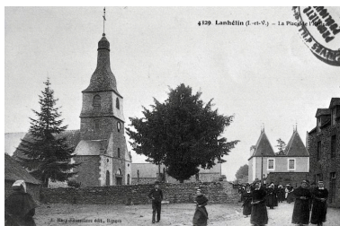
Élévation nord-ouest ; vue générale au début du 20e siècle IVR53_19933500584X