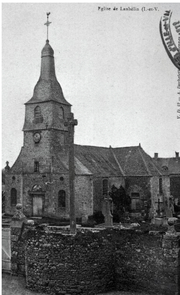
Elévation sud-ouest ; vue générale au début du 20e siècle