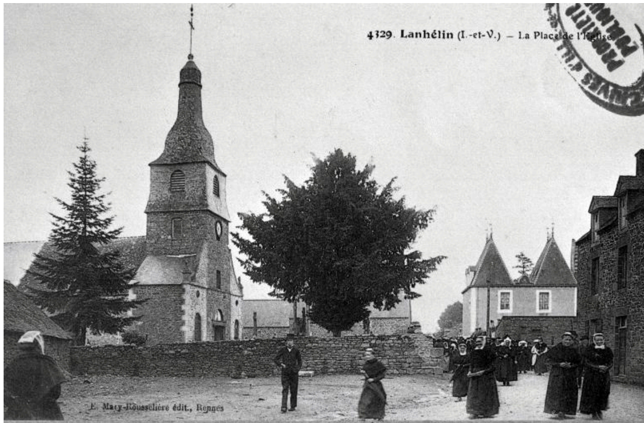
Elévation nord-ouest ; vue générale au début du 20e siècle