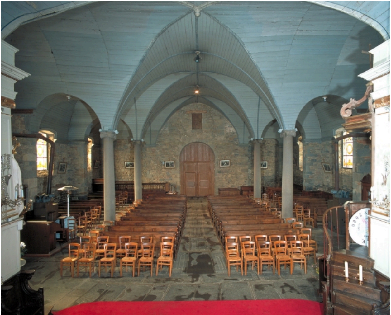
Vue intérieure prise du chœur vers la nef (état en 2002)