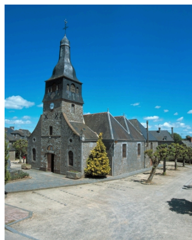
Vue générale sud-ouest (état en 2001) IVR53_20013501168XA