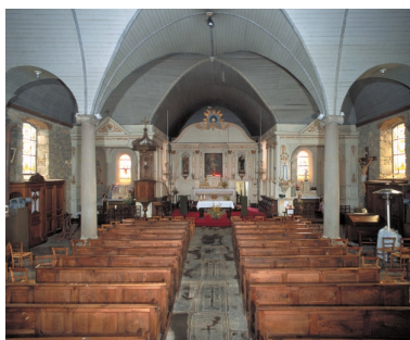
Vue intérieure vers le chœur (état en 2002) IVR53_20023500199XA