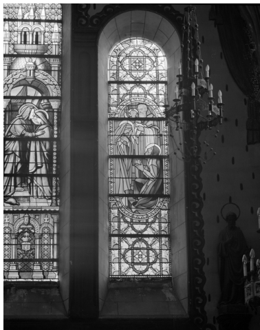
Baie 1 : vue générale. IVR53_19873500403X