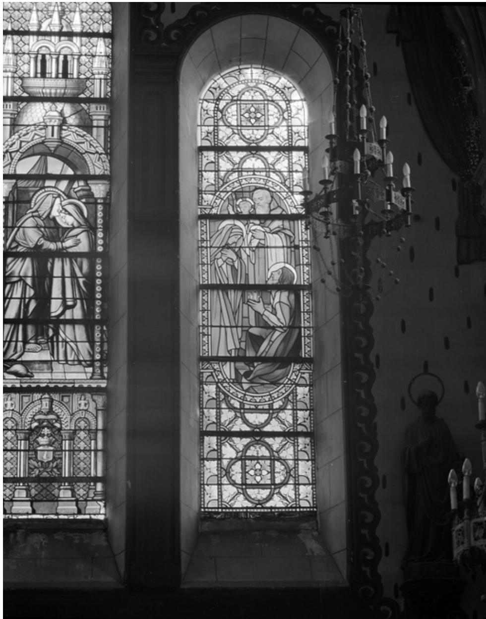
Baie 1 : vue générale.