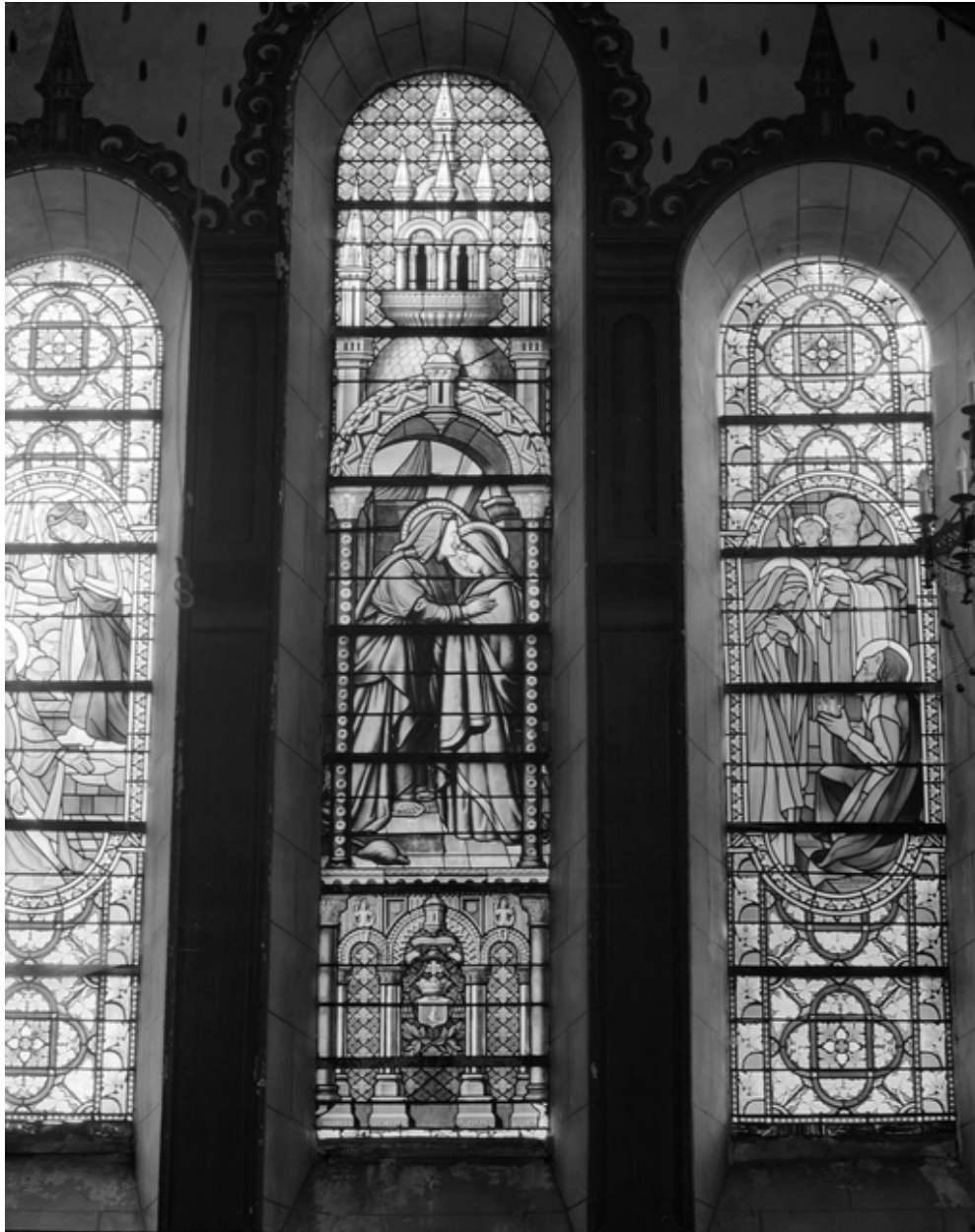
Baie 0 : vue générale.