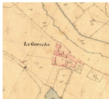
Extrait du cadastre de 1844, emplacement de l'ancien manoir et construction en cours du nouveau logis, aile arrière IVR53_20182206401NUCA