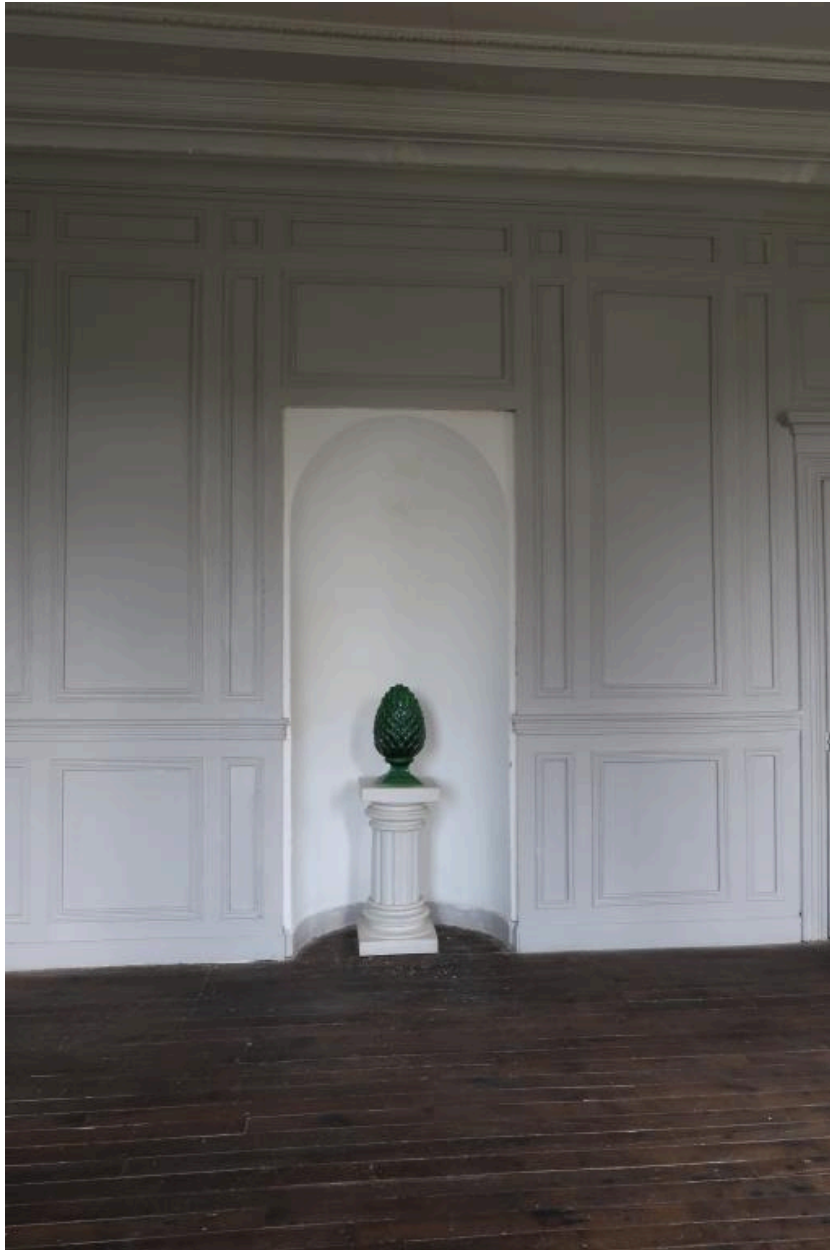
Lambris du rez-de-chaussée