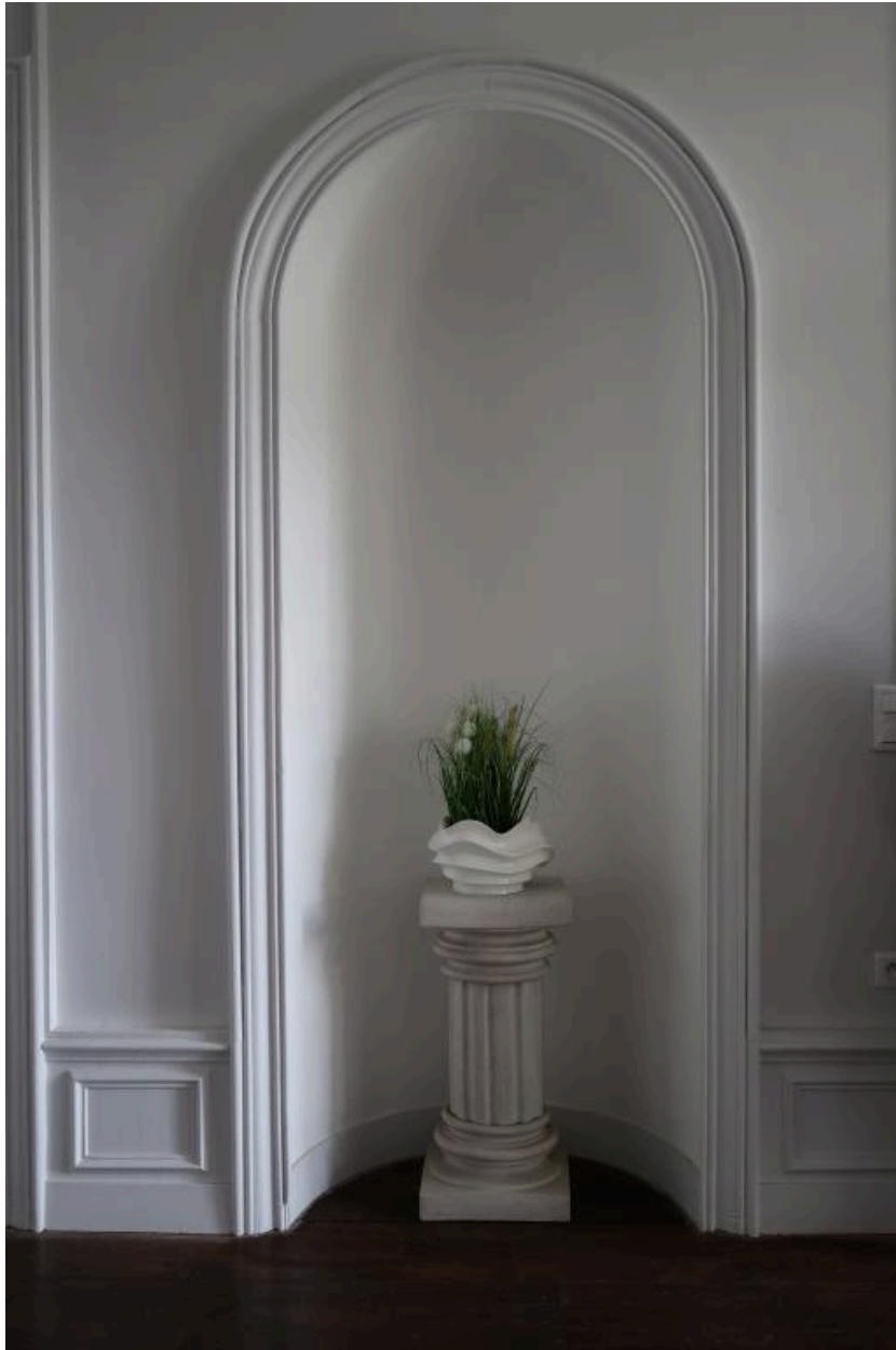
Lambris, du rez-de-chaussée, détail