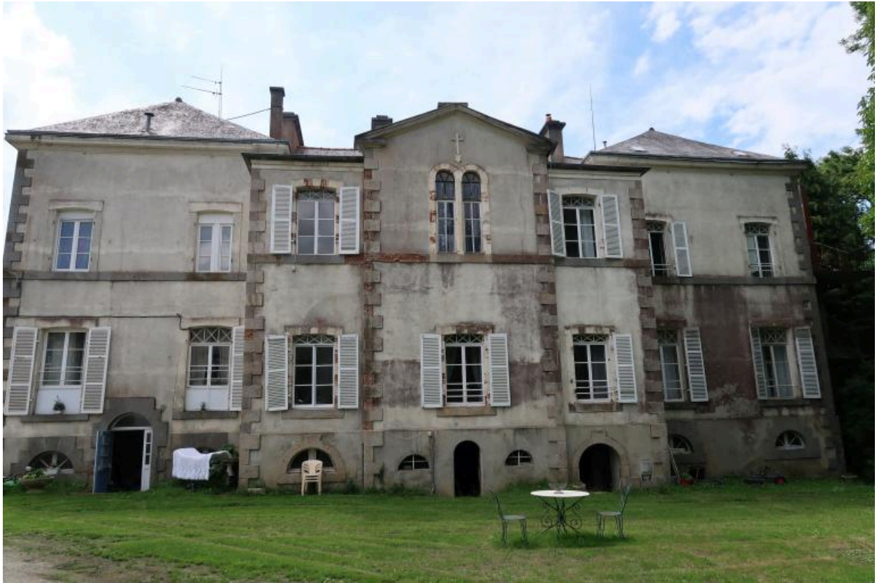
Vue générale arrière