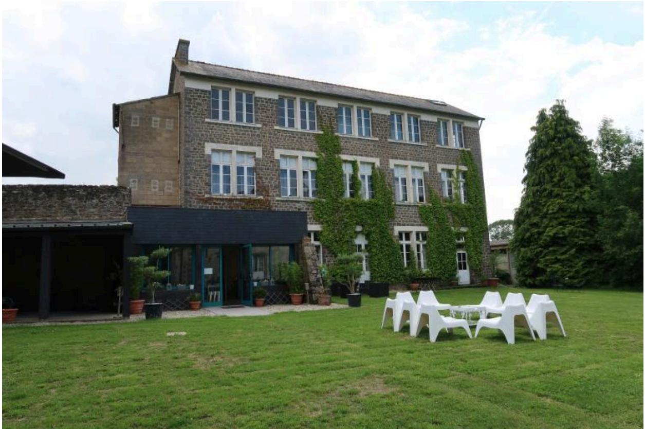
Le Bâtiment de formation