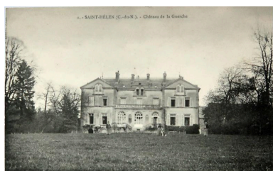
Carte postale, édition Rouxel, Dinan, le Château de la Guerche IVR53_20182206402NUCA