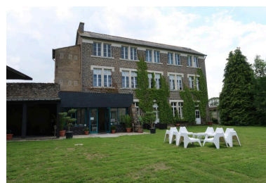
Le Bâtiment de formation