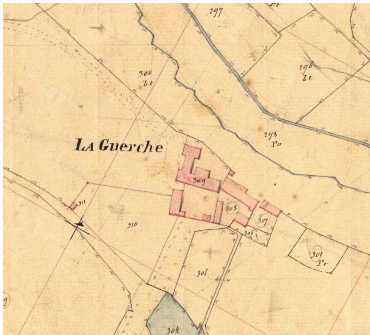
Extrait du cadastre de 1844, emplacement de l'ancien manoir et construction en cours du nouveau logis, aile arrière