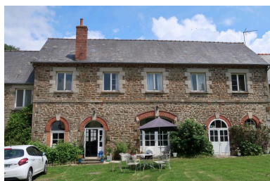
Communs, dépendance IVR53_20182206578NUCA