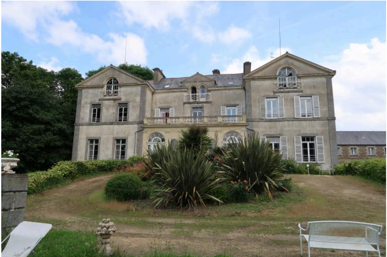
Vue générale de la façade principale