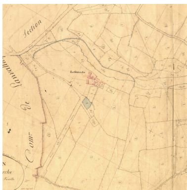
Extrait du cadastre de 1844, le manoir et son environnement IVR53_20182206400NUCA