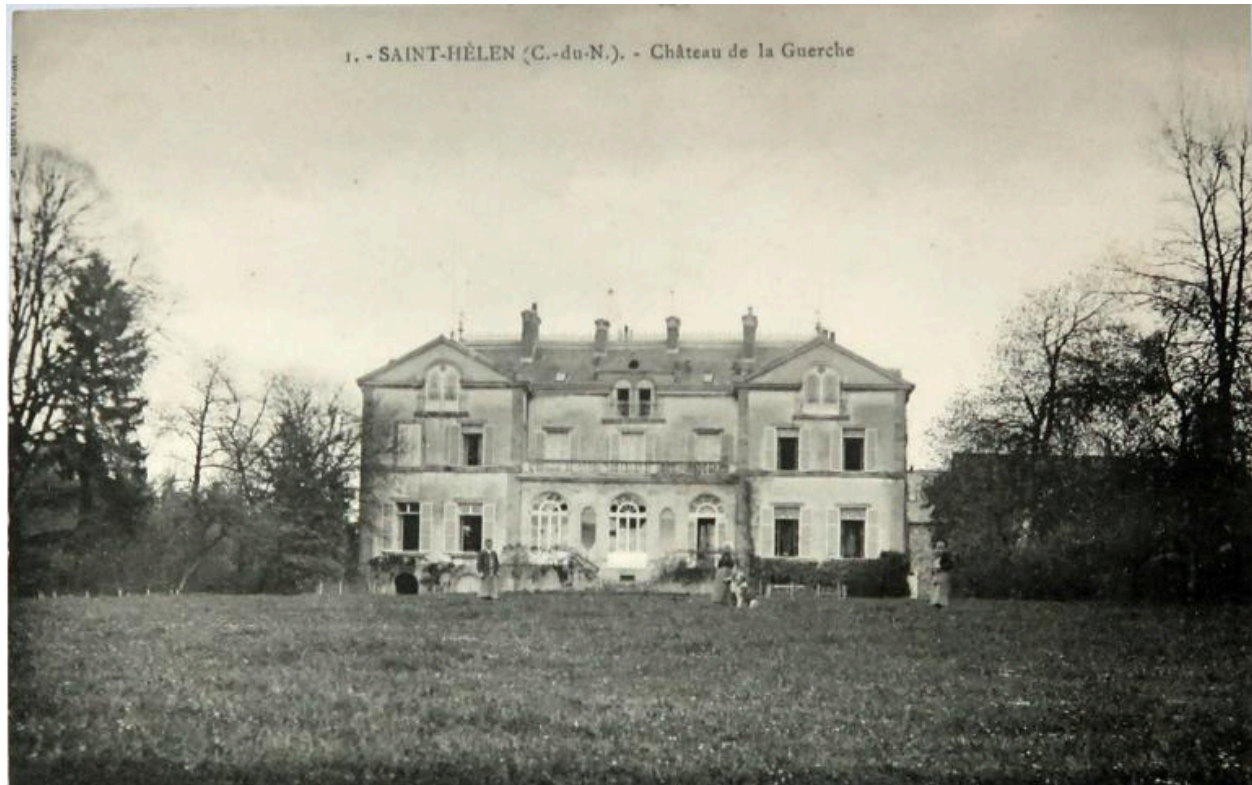
Carte postale, édition Rouxel, Dinan, le Château de la Guerche