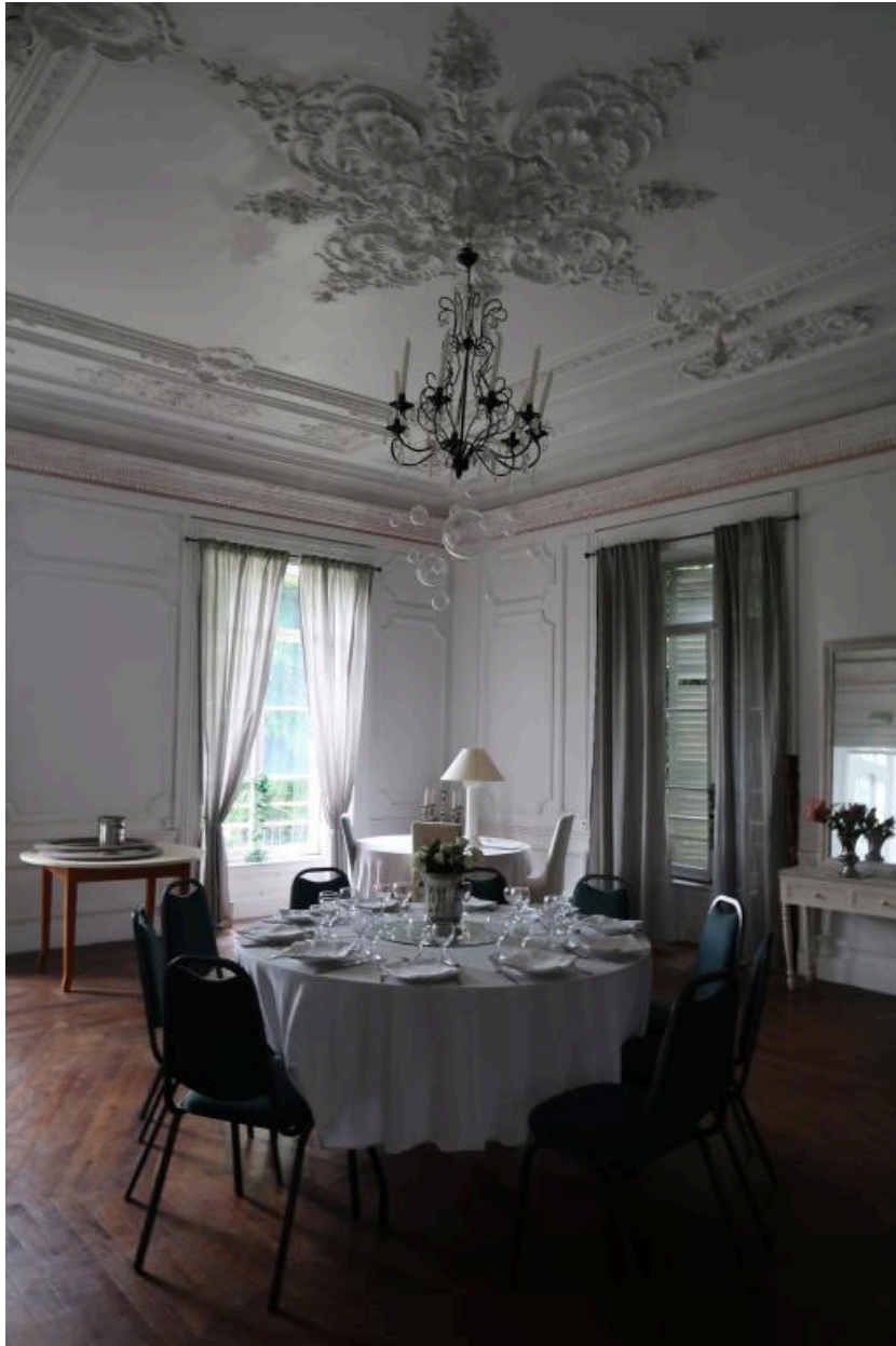
La salle à manger