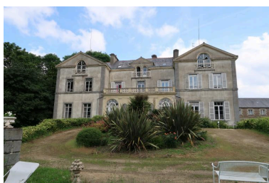
Vue générale de la façade principale IVR53_20182206570NUCA