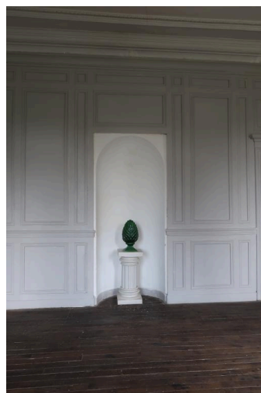
Lambris du rez-de-chaussée IVR53_20182206574NUCA