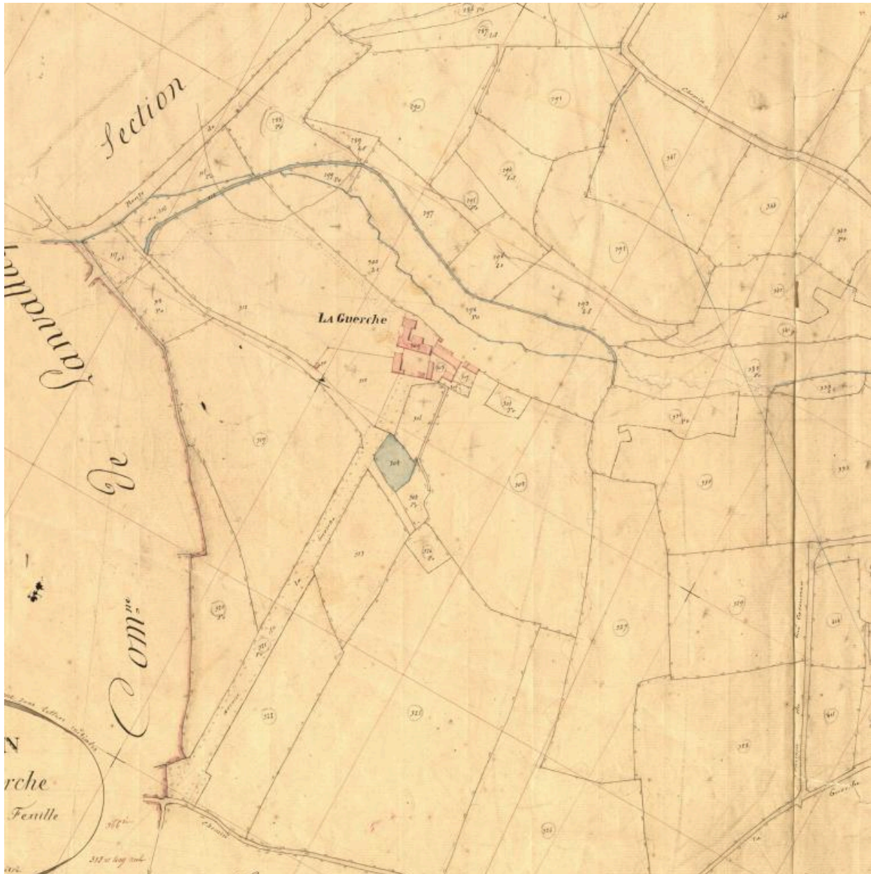
Extrait du cadastre de 1844, le manoir et son environnement