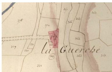
Extrait du cadastre de 1811 IVR53_20182206399NUCA