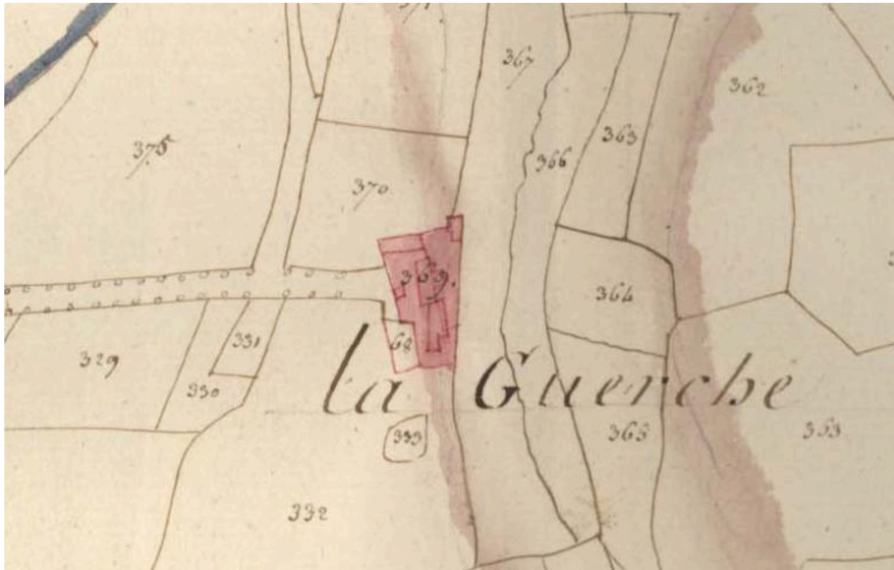
Extrait du cadastre de 1811