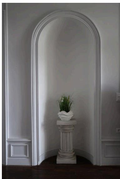
Lambris, du rez-de-chaussée, détail IVR53_20182206575NUCA