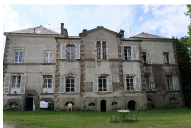
Vue générale arrière IVR53_20182206572NUCA