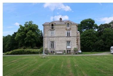
Vue latérale IVR53_20182206571NUCA