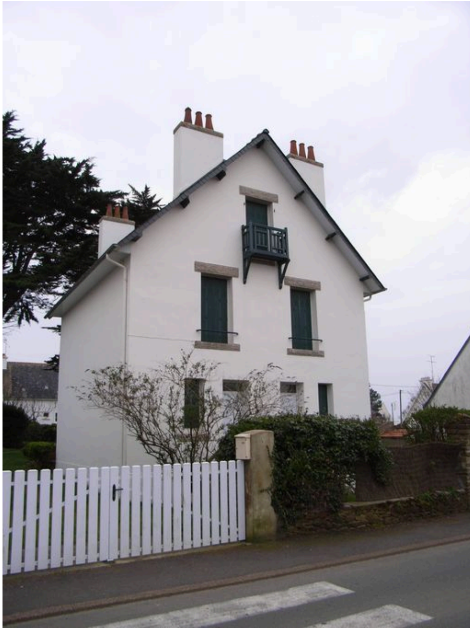
Vue générale de la villa 21 rue du Philosophe Alain