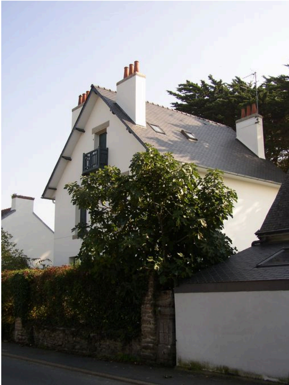
Villa 21 rue du Philosophe Alain