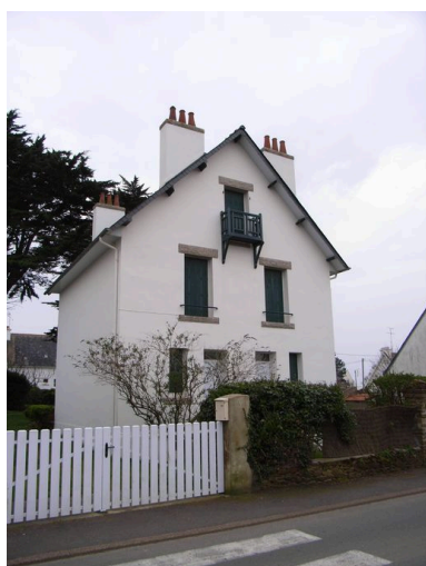
Vue générale de la villa 21 rue du Philosophe Alain IVR53_20072909070NUCA