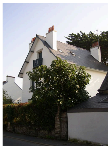
Villa 21 rue du Philosophe Alain IVR53_20062908691NUCA