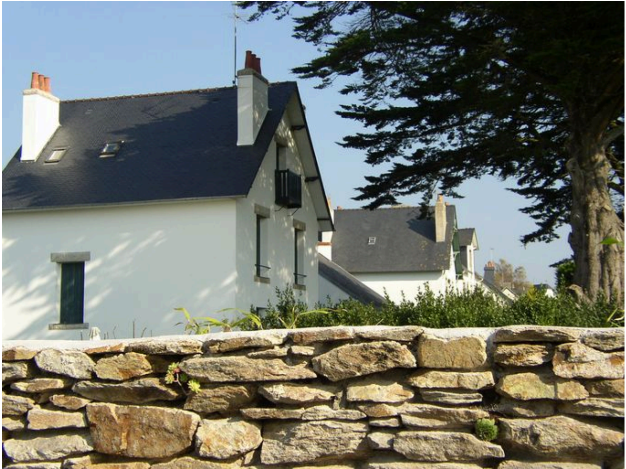
Villa 21 rue du Philosophe Alain, côté mer