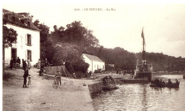
Le port du Pouldu au début du 20e siècle, avec la maison Jacob à gauche