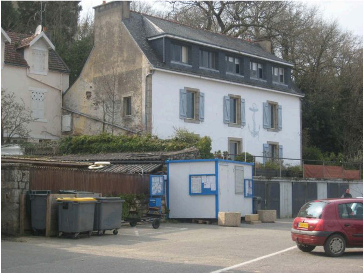
Pignon sud-est et façade principale de l'ancienne maison Jacob