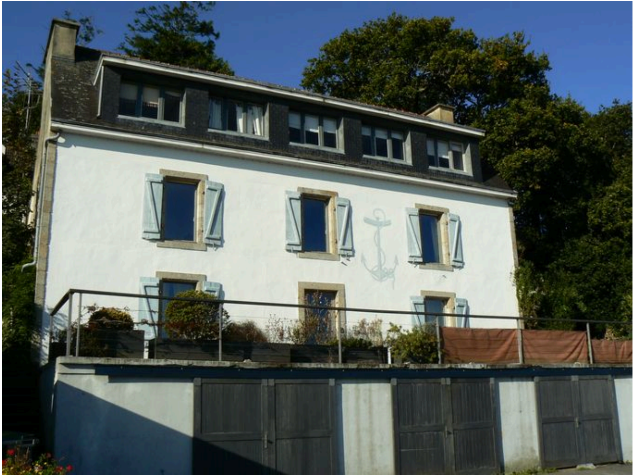
Ancienne maison Jacob, côté Laïta