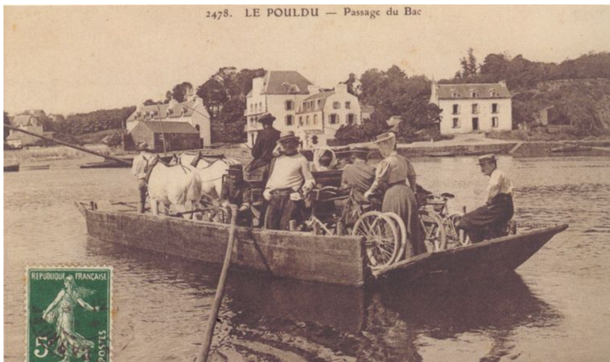
Passage du bac du Pouldu au début du 20e siècle, avec l'ancienne maison Jacob à droite