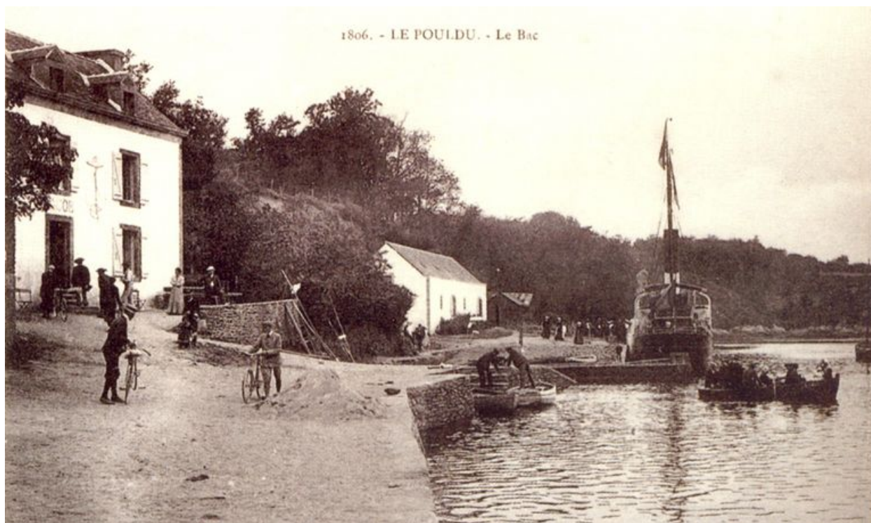
Le port du Pouldu au début du 20e siècle, avec la maison Jacob à gauche