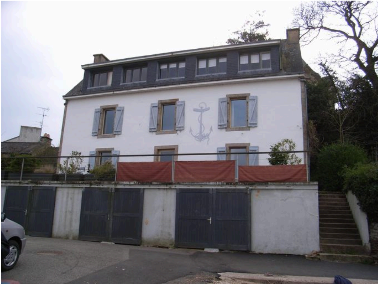
Vue générale de l'ancienne maison Jacob