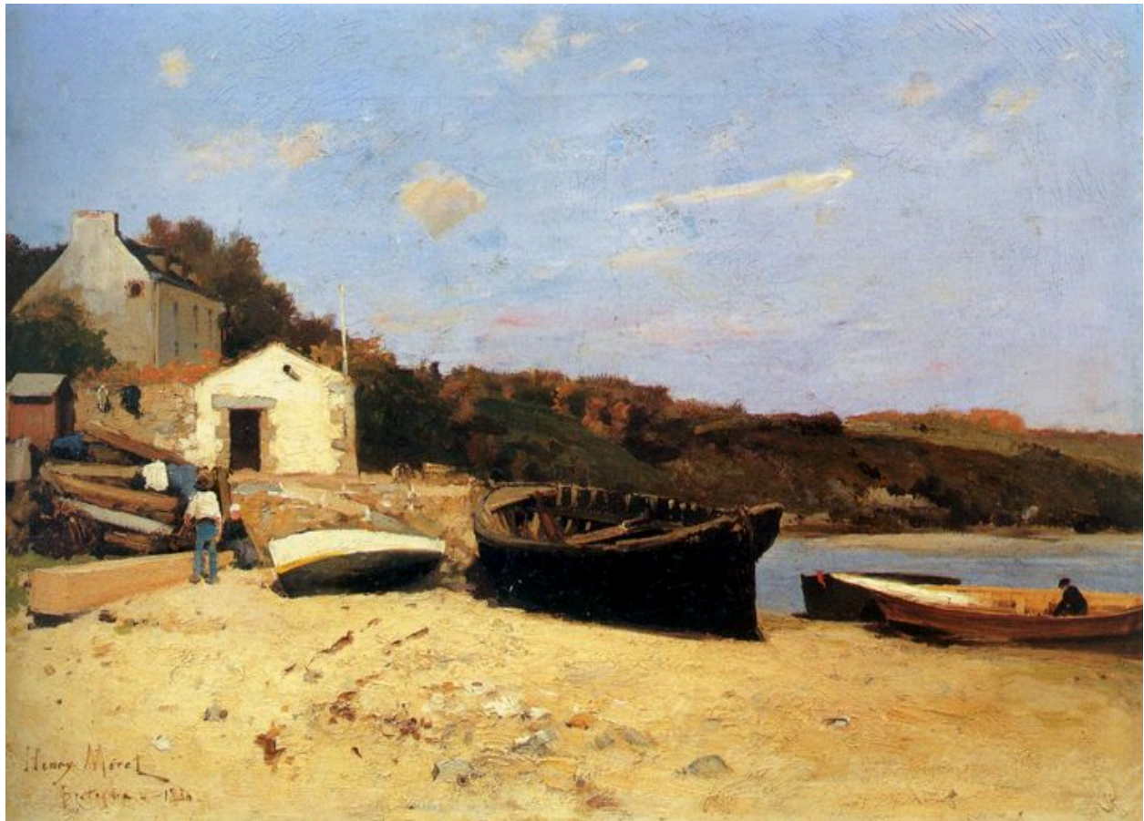
Peinture de Henry Moret, Le Pouldu, 1886, avec l'ancienne maison Jacob à gauche en arrière-plan