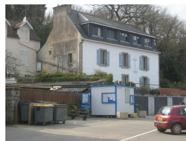
Pignon sud-est et façade principale de l'ancienne maison Jacob IVR53_20072909108NUCA