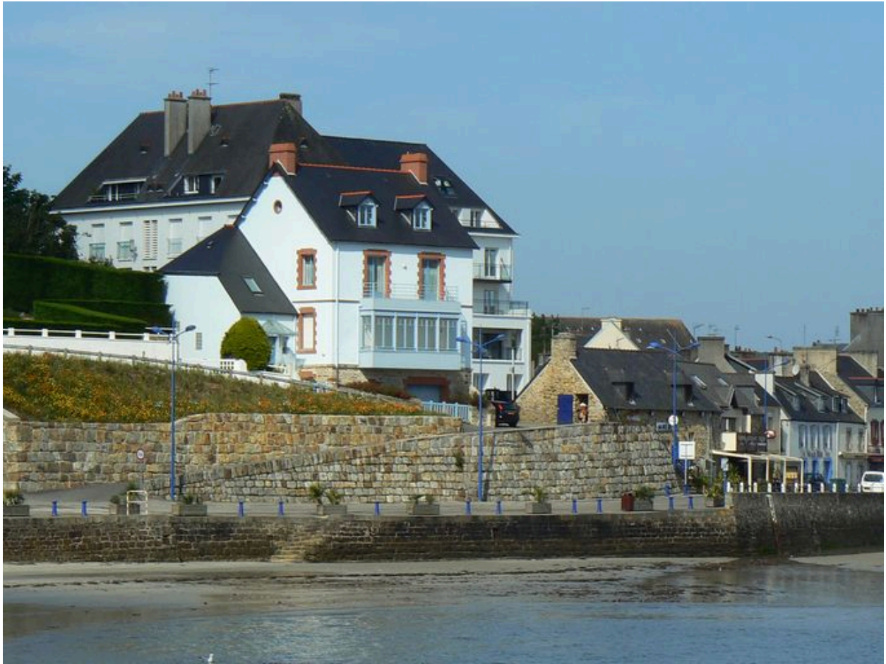
Vue générale d'une maison de conservateur