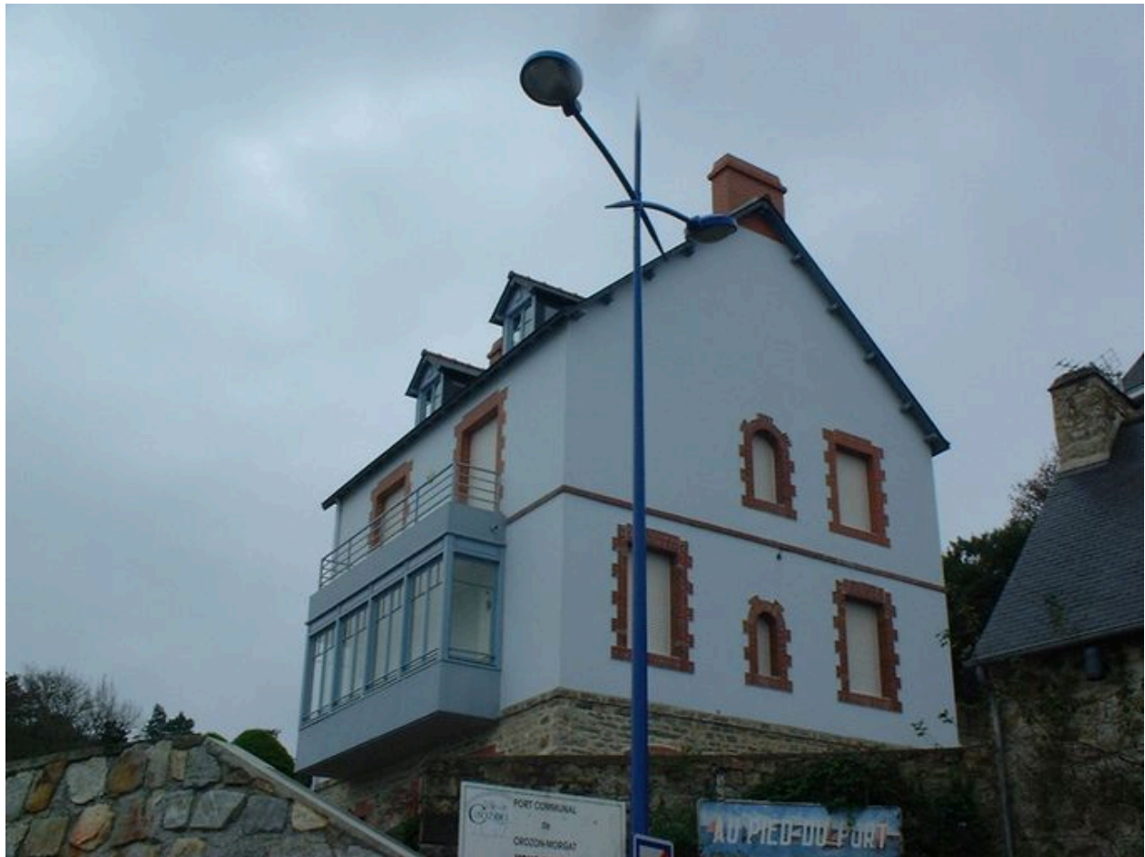
Vue de trois-quarts d'une maison de conservateur, côté mer