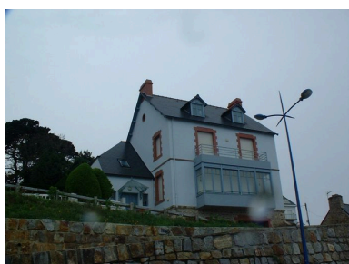
Maison de conserveur, côté mer IVR53_20062908622NUCA