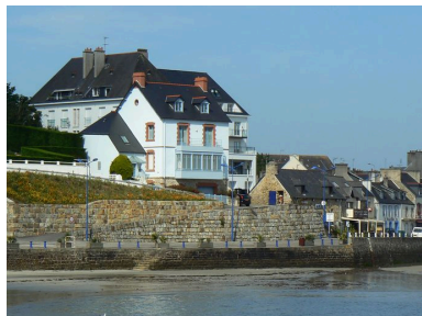
Vue générale d'une maison de conserveur IVR53_20072908659NUCA