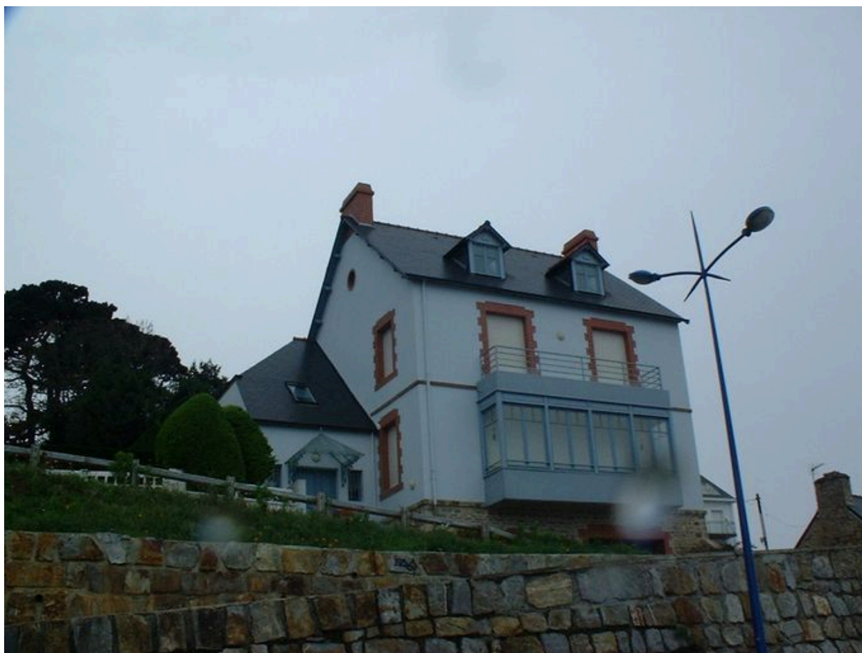
Maison de conservateur, côté mer