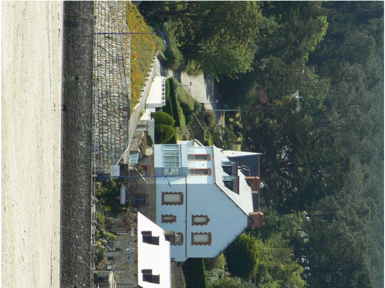
Maison de conservateur