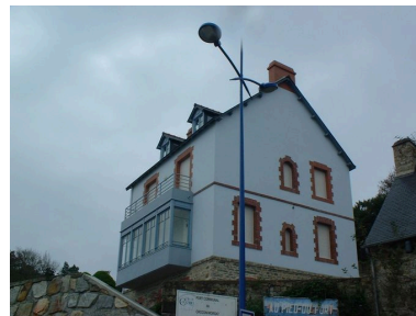
Vue de trois-quarts d'une maison de conserveur, côté mer IVR53_20062908623NUCA