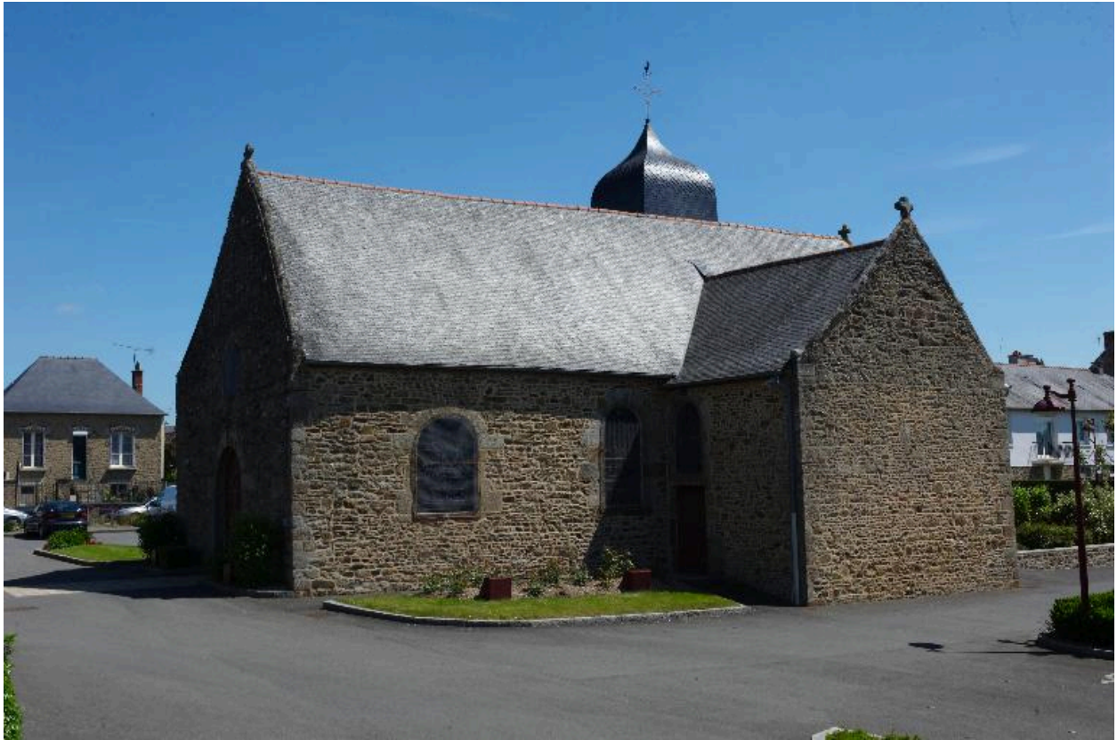
Vue générale : côté sud-ouest