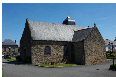
Vue générale : côté sud-ouest IVR53_20133501639NUCA