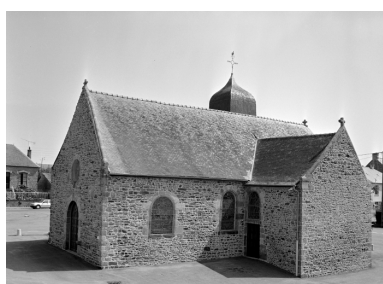
Elévation Sud-Ouest : vue générale IVR53_19943501455X