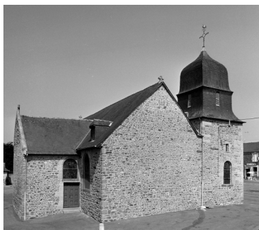
Elévation Est : vue générale IVR53_19943501454X