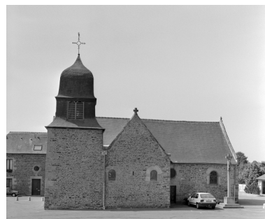
Elévation Nord : vue générale IVR53_19943501453X