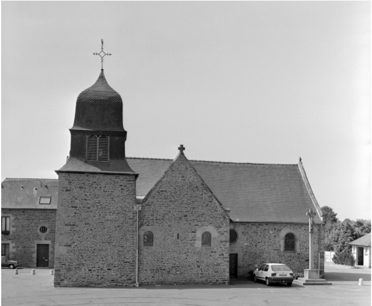
Elévation Nord : vue générale