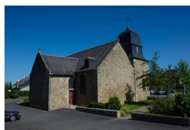
Vue générale : côté sud-est IVR53_20133501628NUCA