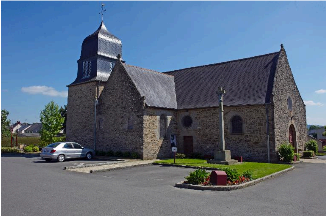
Vue générale : côté nord-ouest