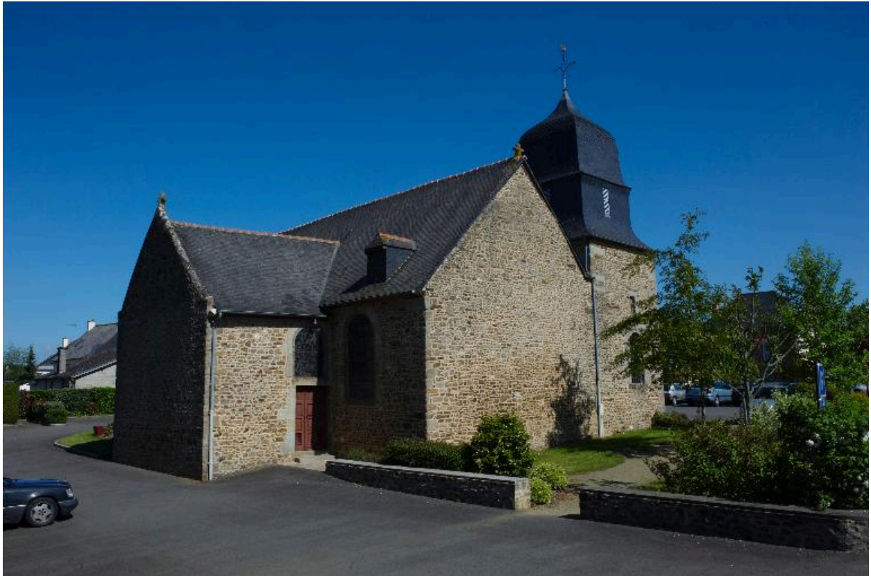
Vue générale : côté sud-est