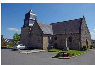
Vue générale : côté nord-ouest IVR53_20133501674NUCA