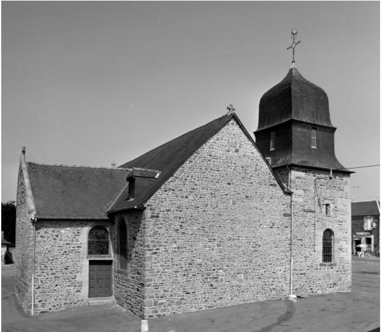
Elévation Est : vue générale