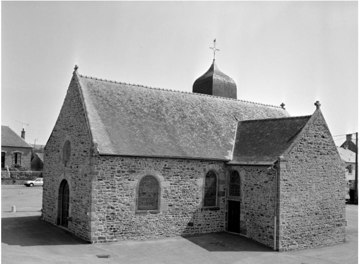
Elévation Sud-Ouest : vue générale