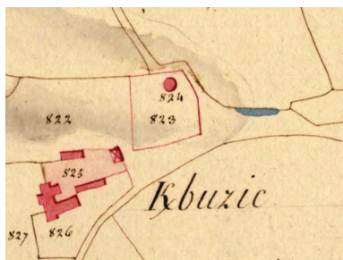
Extrait des plans cadastraux parcellaires de 1813 (AD 22).