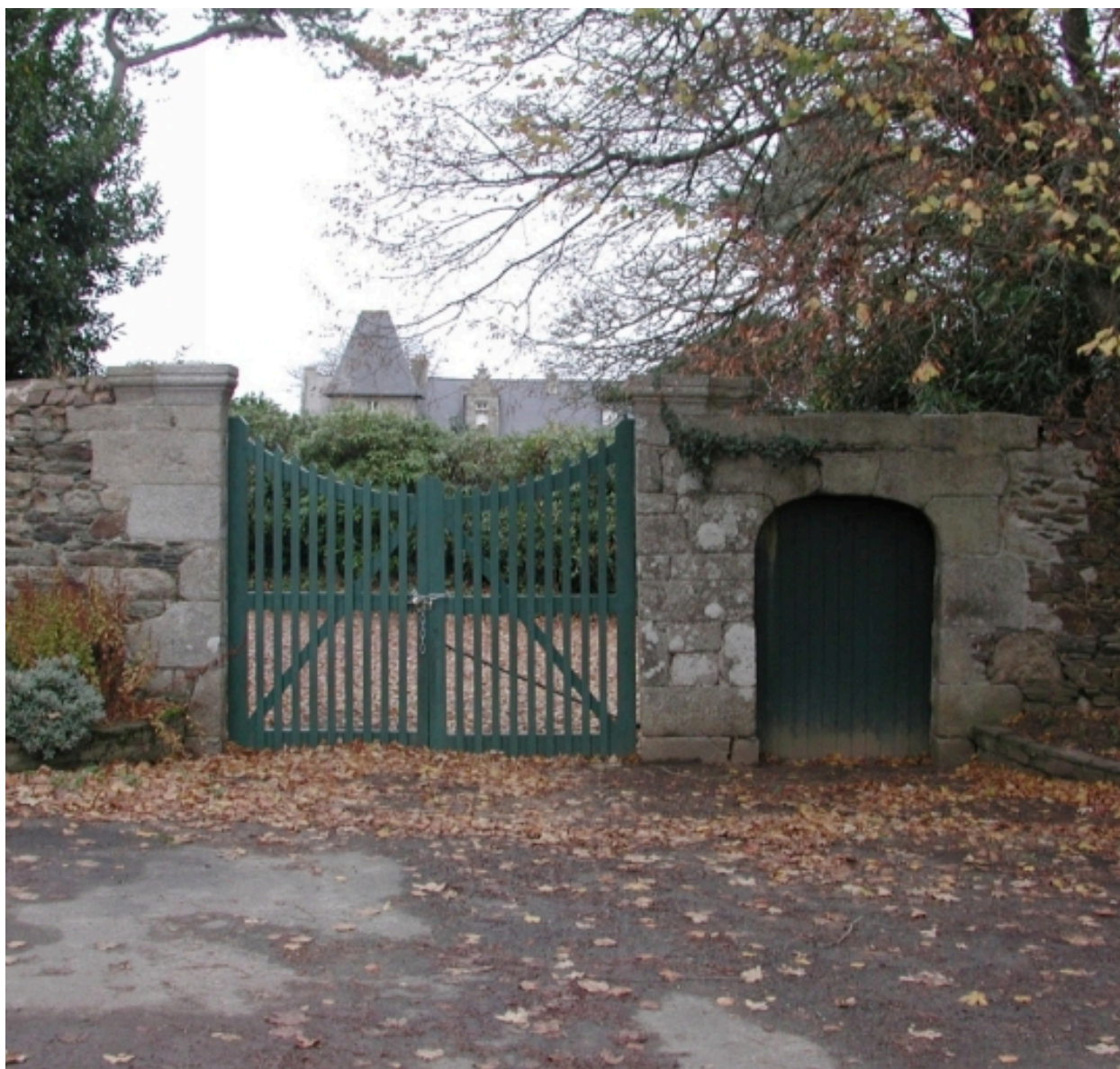
Portail daté 1740 (porte la date).