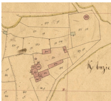
Extrait des plans cadastraux parcellaires de 1848 (AD 22).