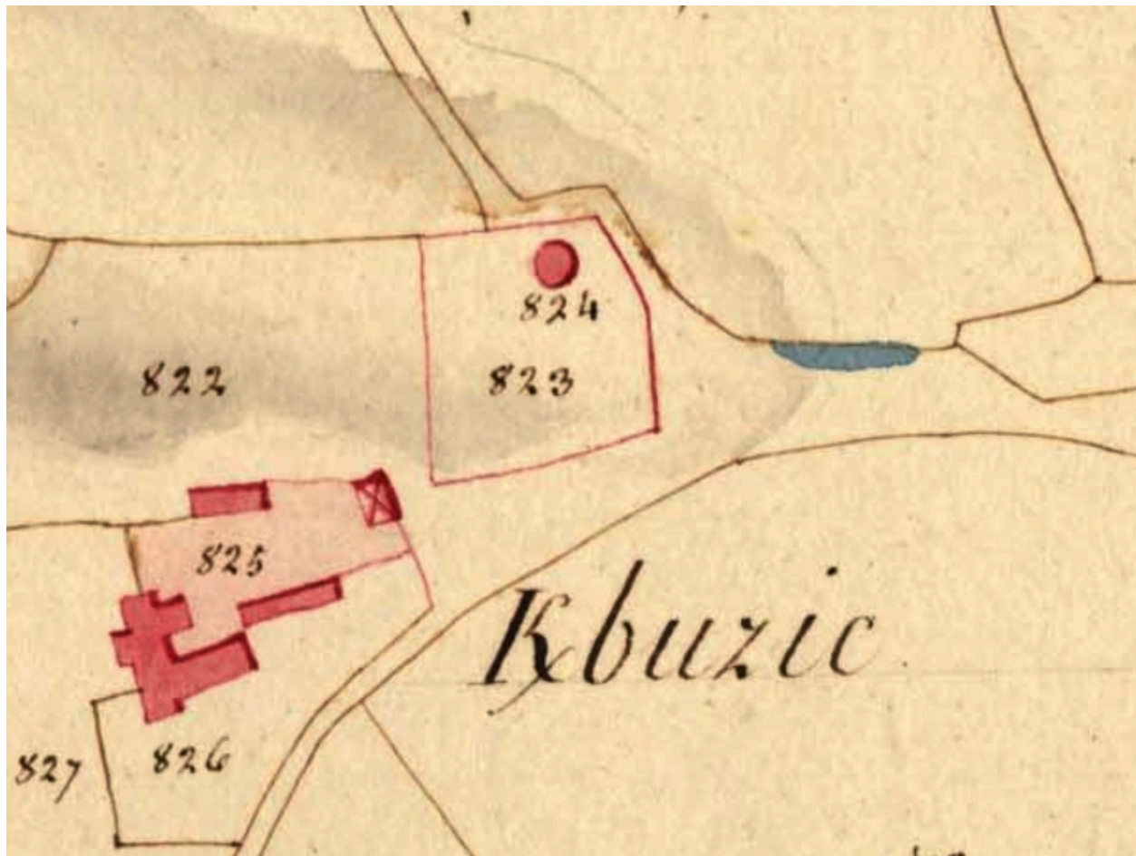
Extrait des plans cadastraux parcellaires de 1813 (AD 22).