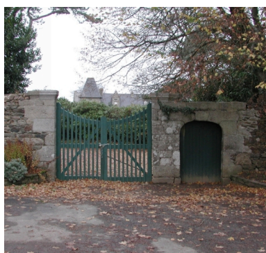
Portail daté 1740 (porte la date).