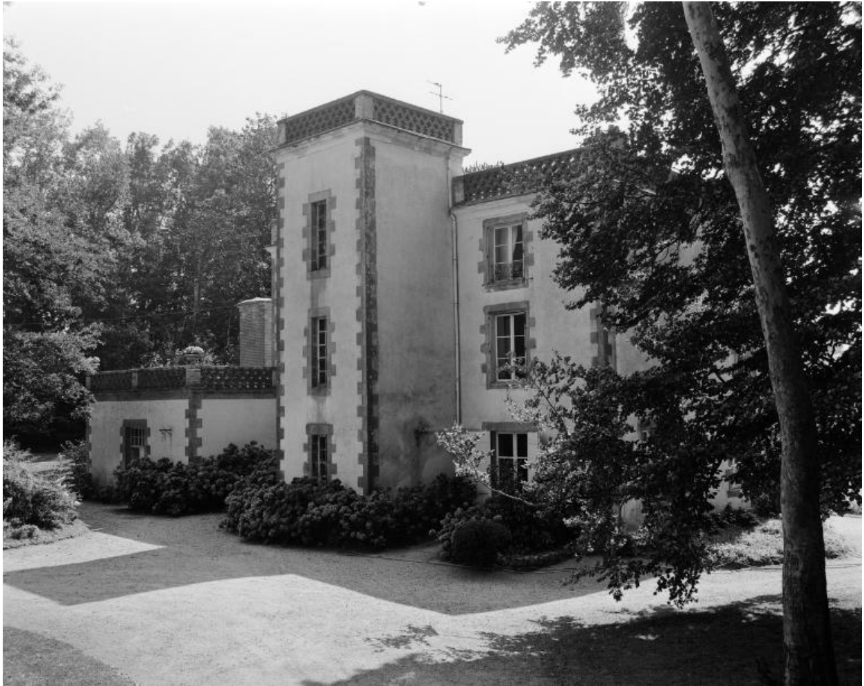
Logis, élévation nord, vue prise de l'ouest.