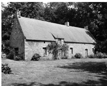
Ferme, vue générale sud.

IVR53_19915600910X