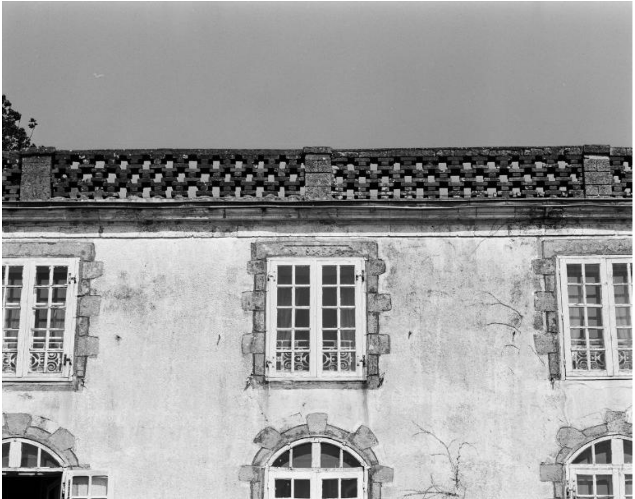
Logis, élévation sud, fenêtre médiane du 2ème étage.