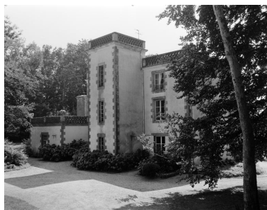
Logis, élévation nord, vue prise de l'ouest.

IVR53_19915600911X