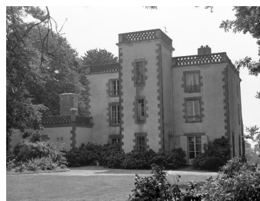
Logis, élévation nord.

IVR53_19915600908X