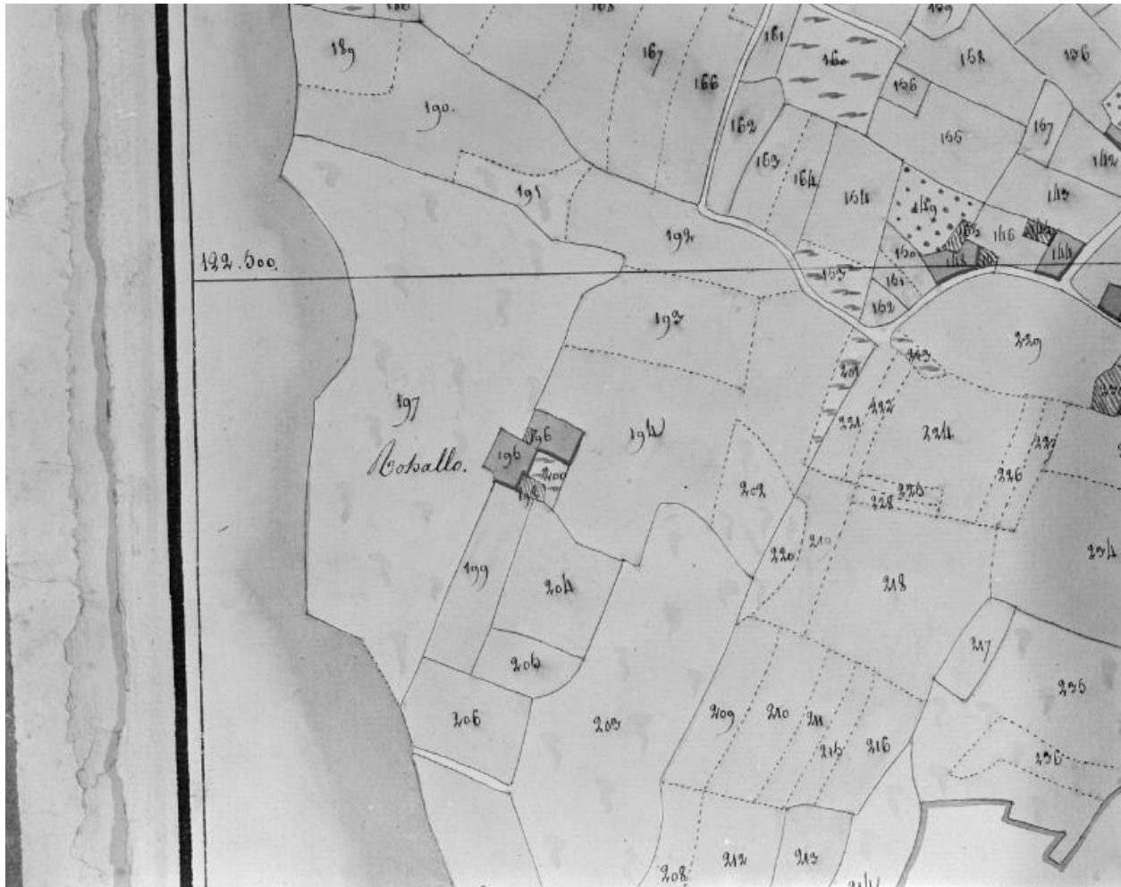
Plan cadastral 1809, section A.