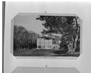
Le Rohello, château, carte postale ancienne, début XXe siècle.

IVR53_19935600261X