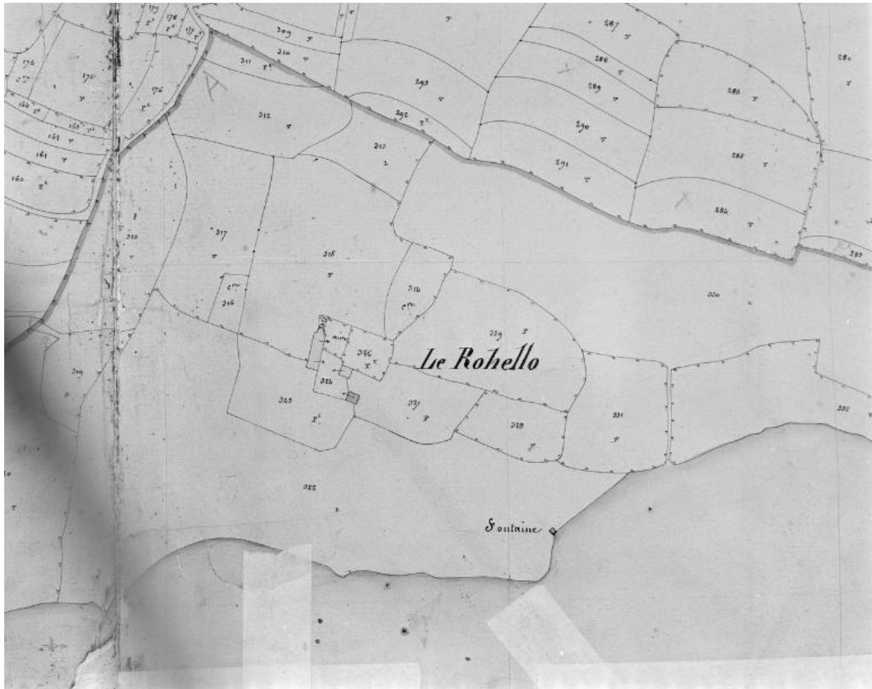
Plan cadastral 1852, section A1.