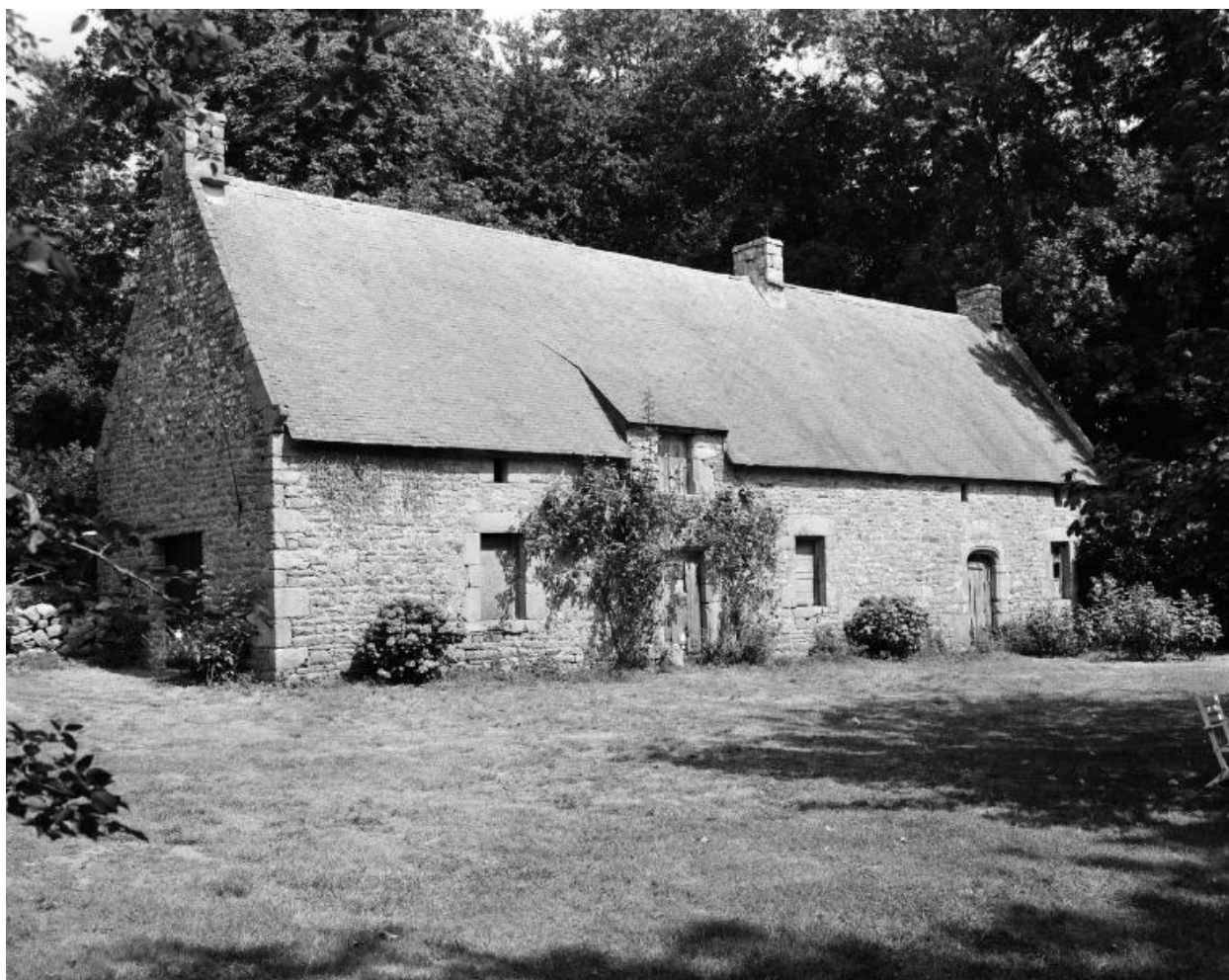
Ferme, vue générale sud.