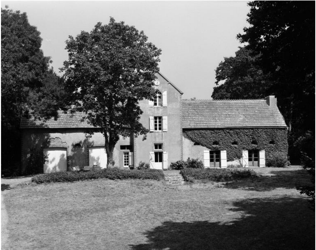
Communs, vue générale sud.