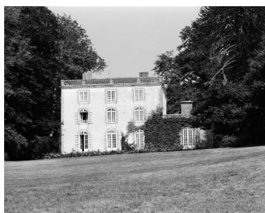
Logis, élévation sud.

Repro. Guy Artur, Repro. Norbert Lambart IVR53_19935600019XB