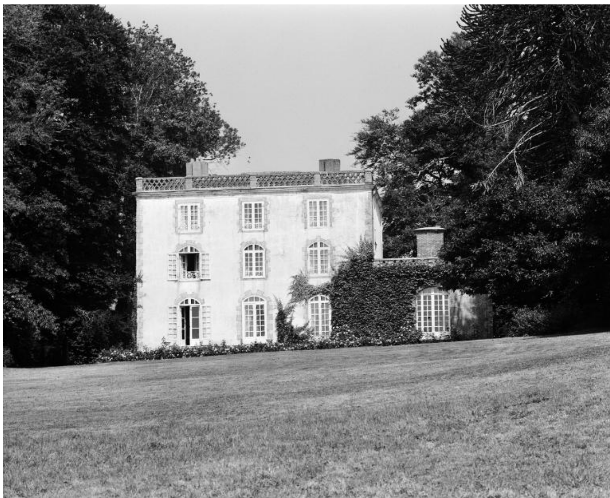
Logis, élévation sud.