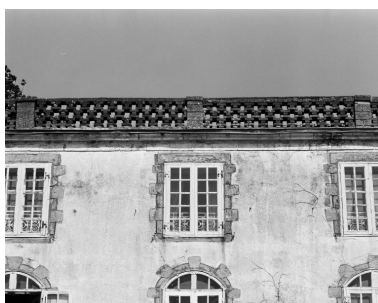
Logis, élévation sud, fenêtre médiane du 2ème étage.

IVR53_19915600907X