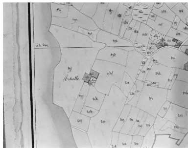
Plan cadastral 1809, section A.

Repro. Guy Artur, Repro. Norbert Lambart, Phot. Auteur inconnu IVR53_19935600189X