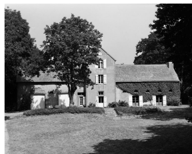
Communs, vue générale sud.

IVR53_19915600909X