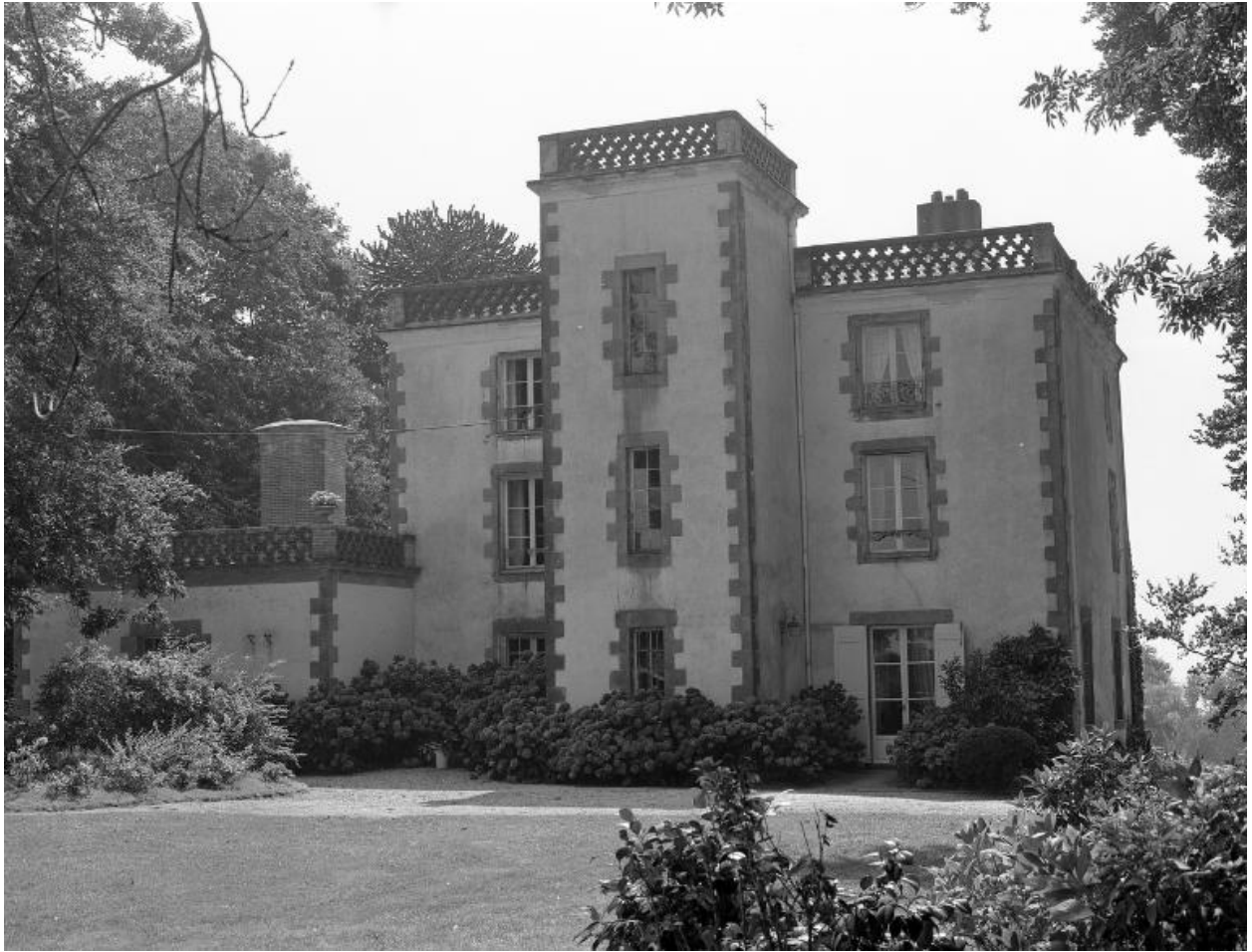
Logis, élévation nord.