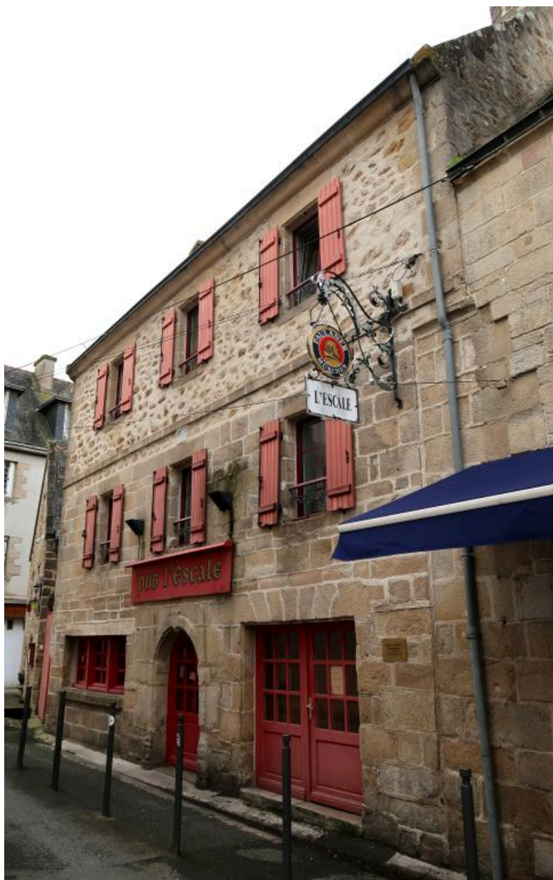
Elévation antérieure sud, vue prise de l'est. (2020)