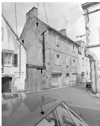
Elévation antérieure sud. (1983) IVR53_19832900963X