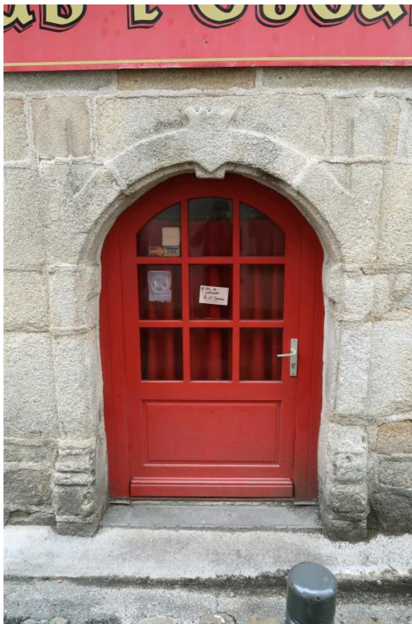
Elévation antérieure sud, détail de la porte d'entrée. (2020)