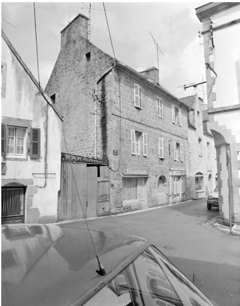
Elévation antérieure sud. (1983)