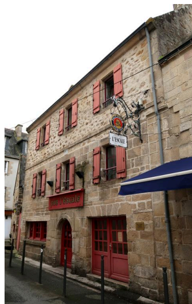
Elévation antérieure sud, vue prise de l'est. (2020)