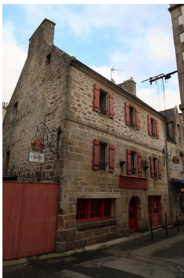
Elévation antérieure sud. (2020) IVR53_20232905652NUCA