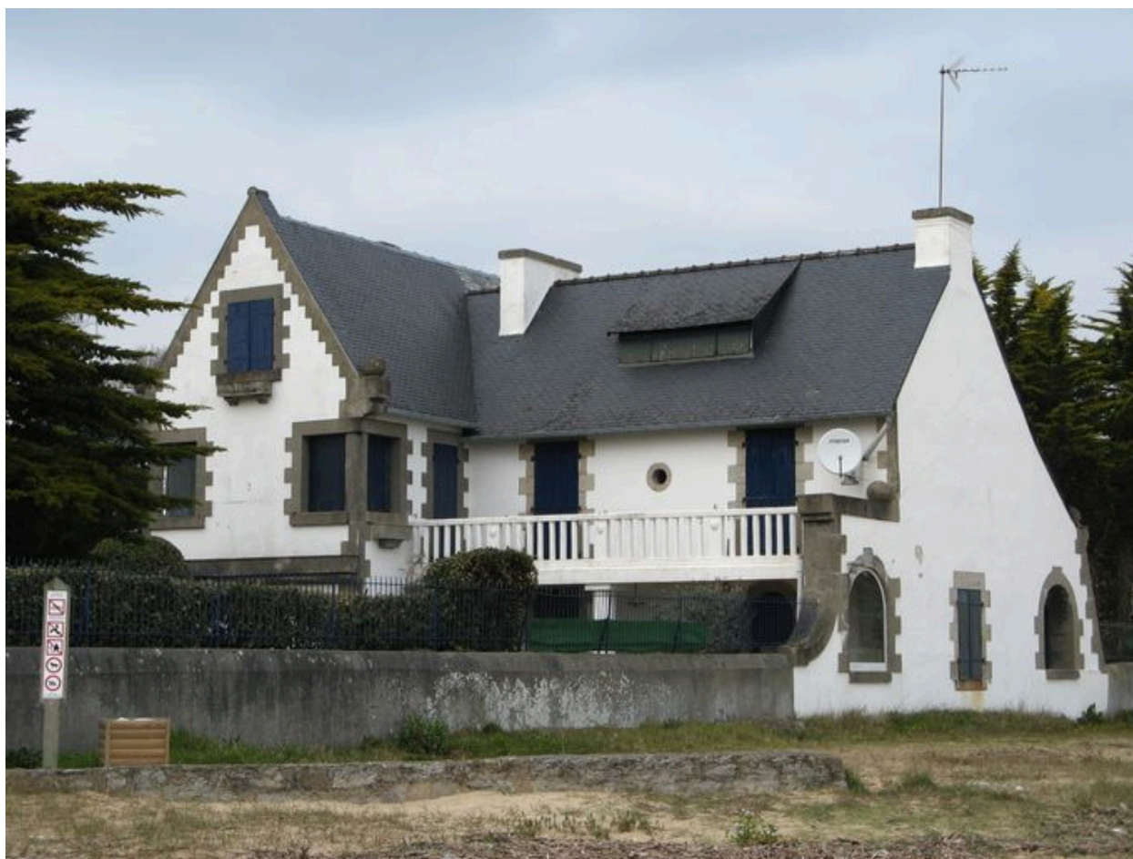
Villa Ker An Dour