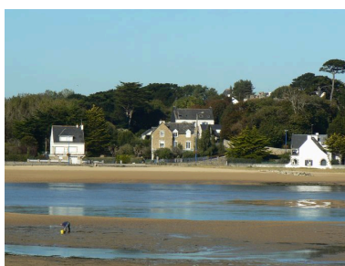
Vue générale des quartiers balnéaires du Bas-Pouldu