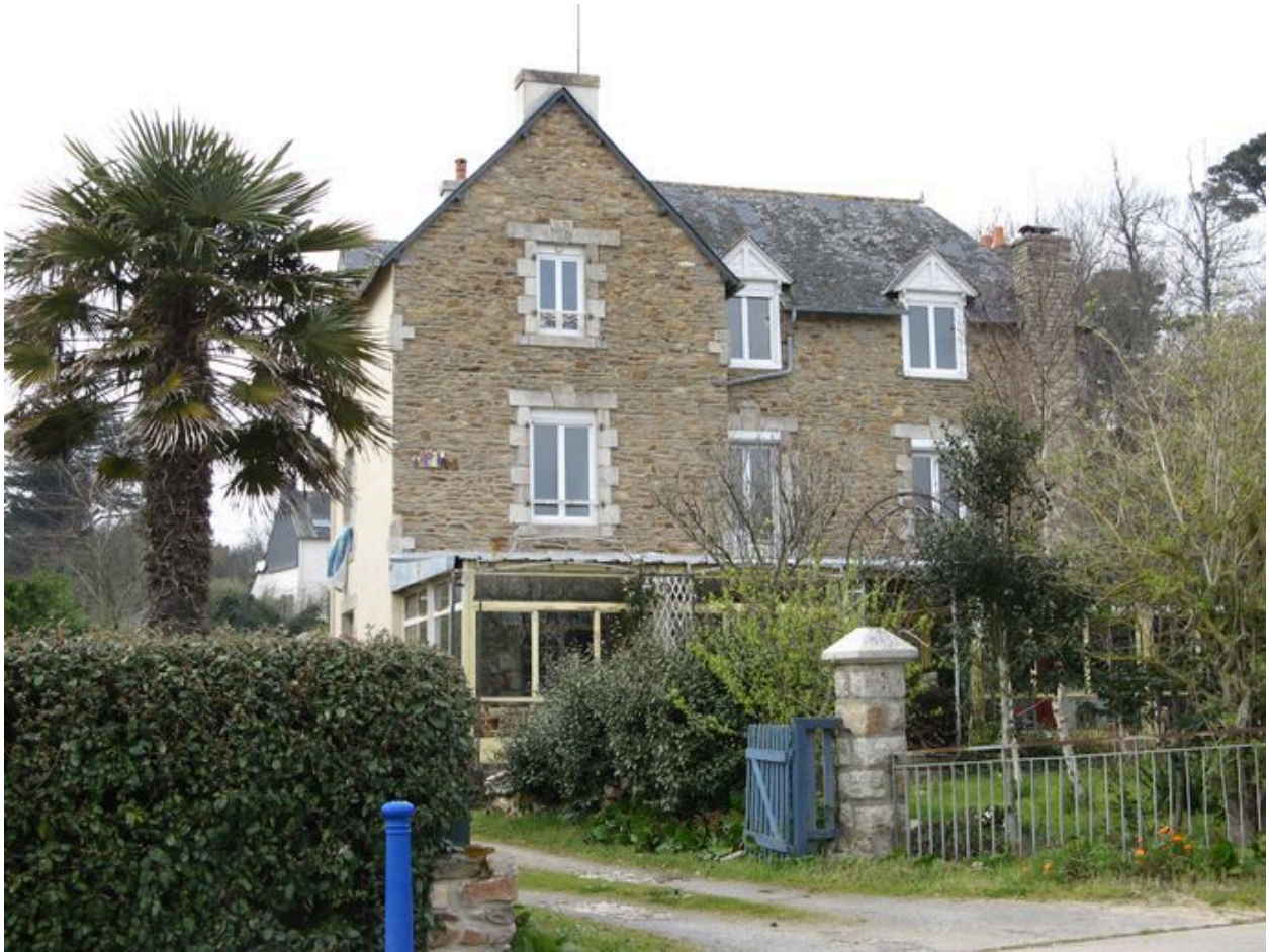
Villa 19 boulevard de la Laïta