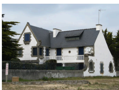
Villa Ker An Dour