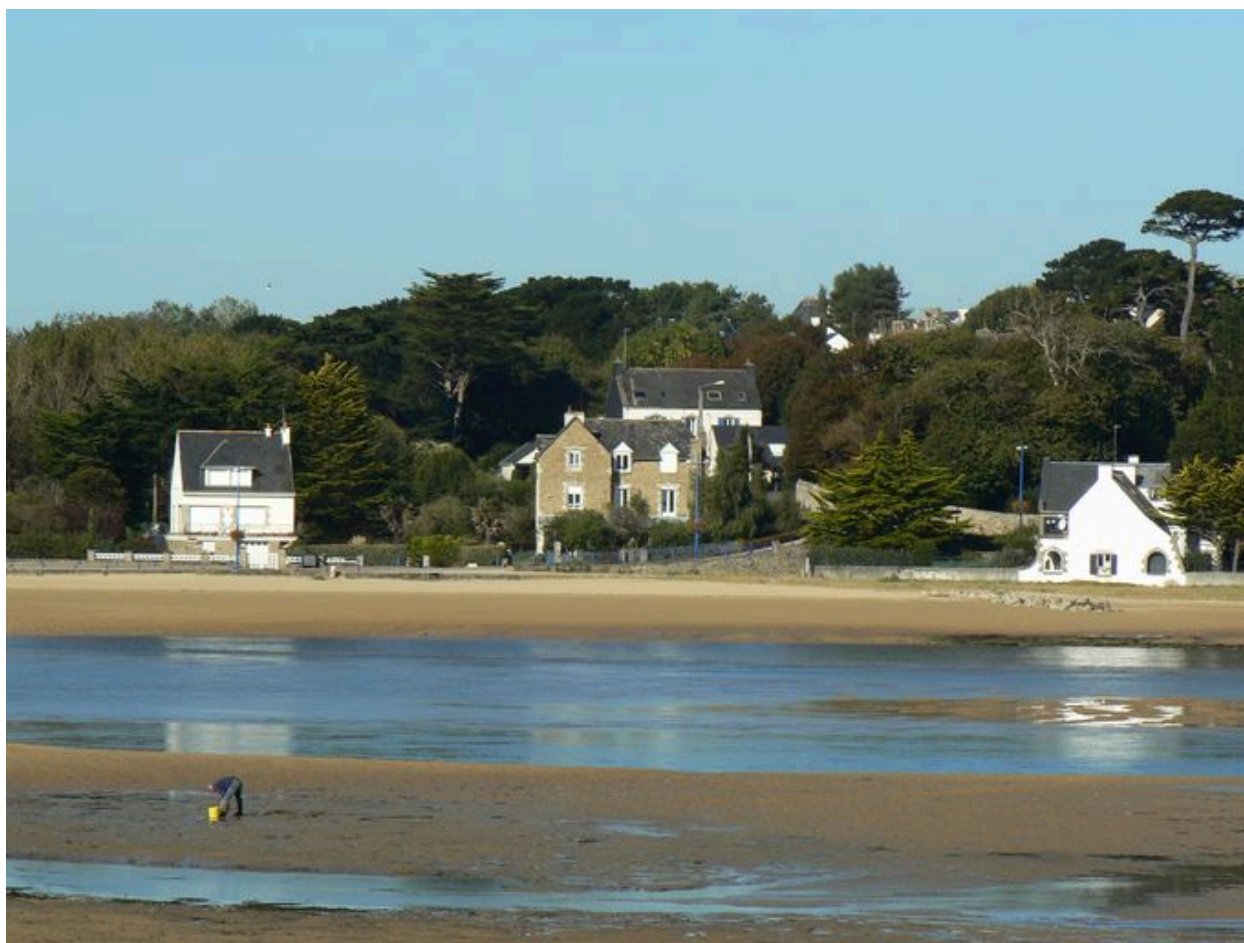
Vue générale des quartiers balnéaires du Bas-Pouldu