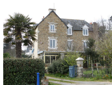
Villa 19 boulevard de la Laïta