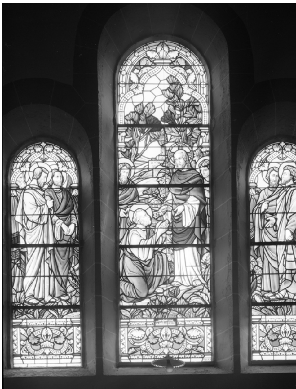
Verrière de la baie 3 : Remise des clés à saint Pierre (état en 1984)