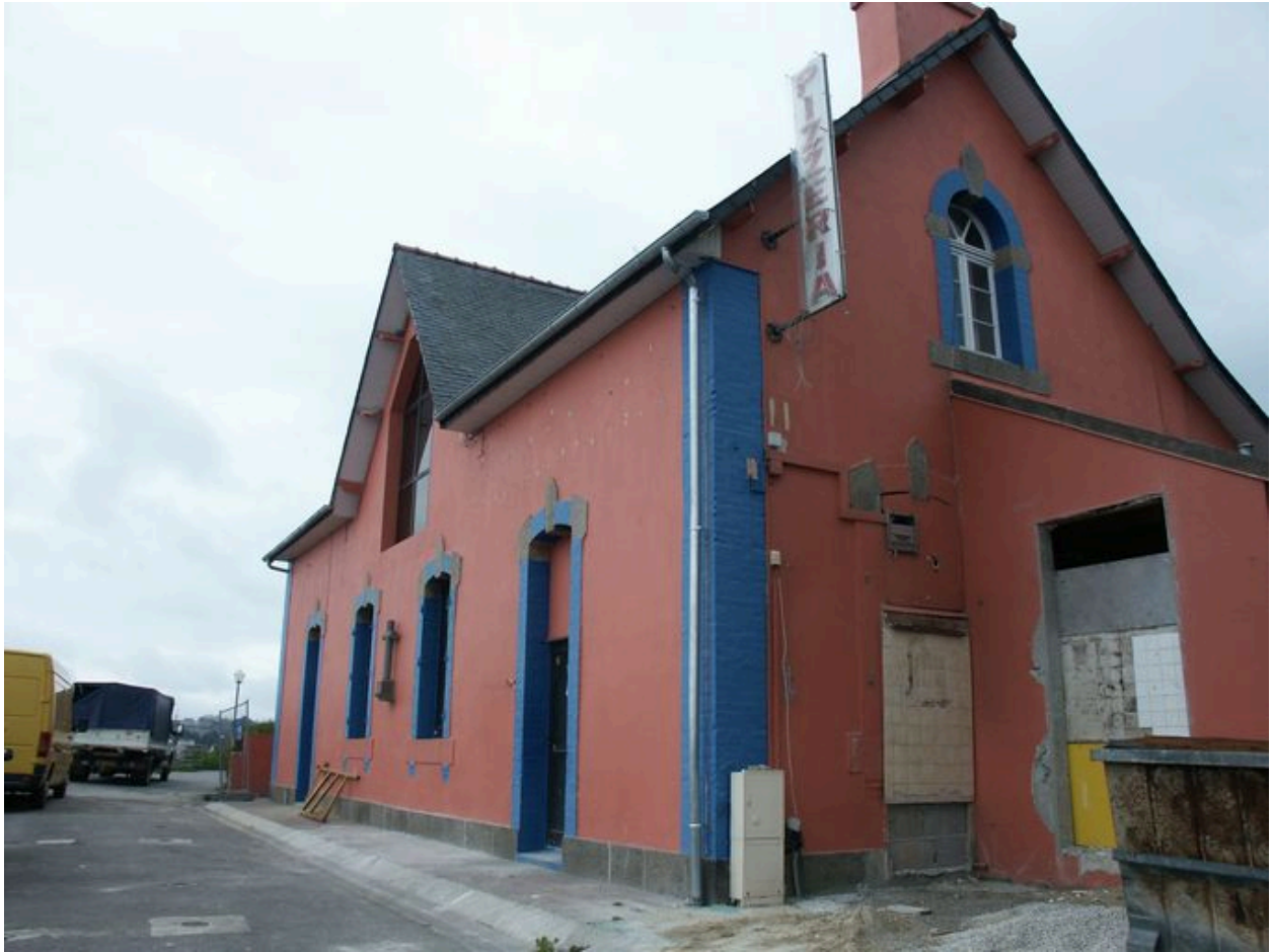
Vue de l'Abri du Marin prise depuis le nord