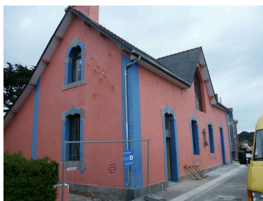
Vue de l'Abri du Marin prise depuis le sud IVR53_20062908355NUCA