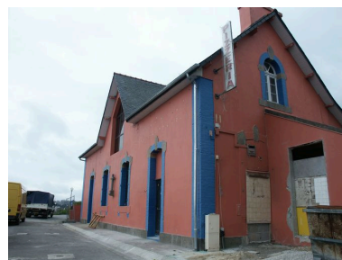
Vue de l'Abri du Marin prise depuis le nord