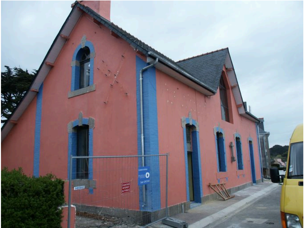
Vue de l'Abri du Marin prise depuis le sud