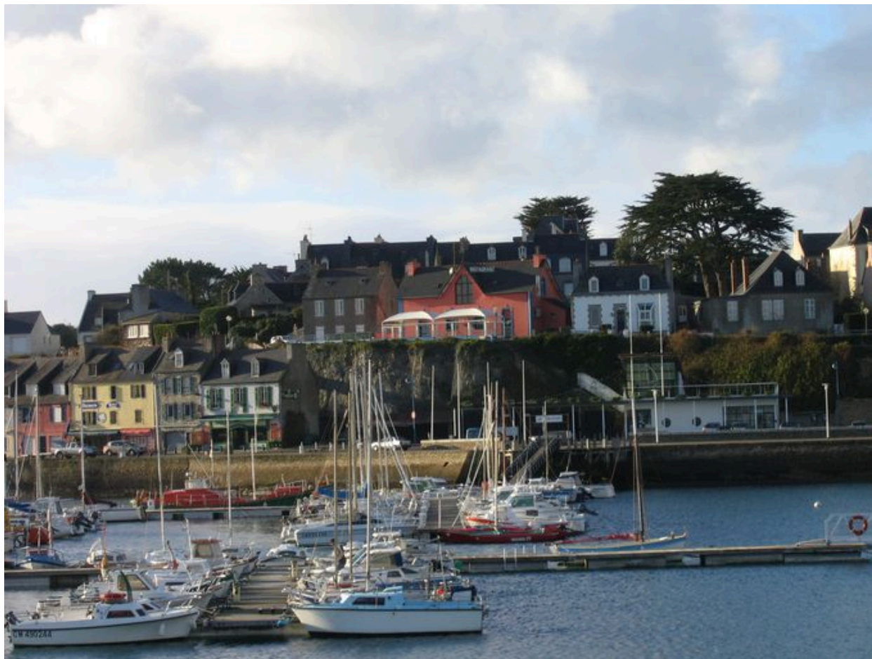
Vue générale de l'Abri du Marin prise depuis le sillon