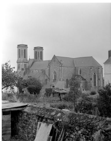
Elévation sud-est : vue générale IVR53_19943501478X