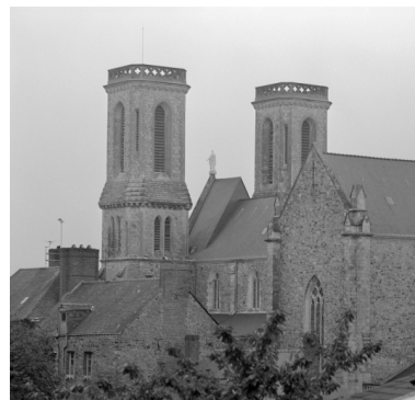
Elévation sud-est : vue générale rapprochée IVR53_19943501477X