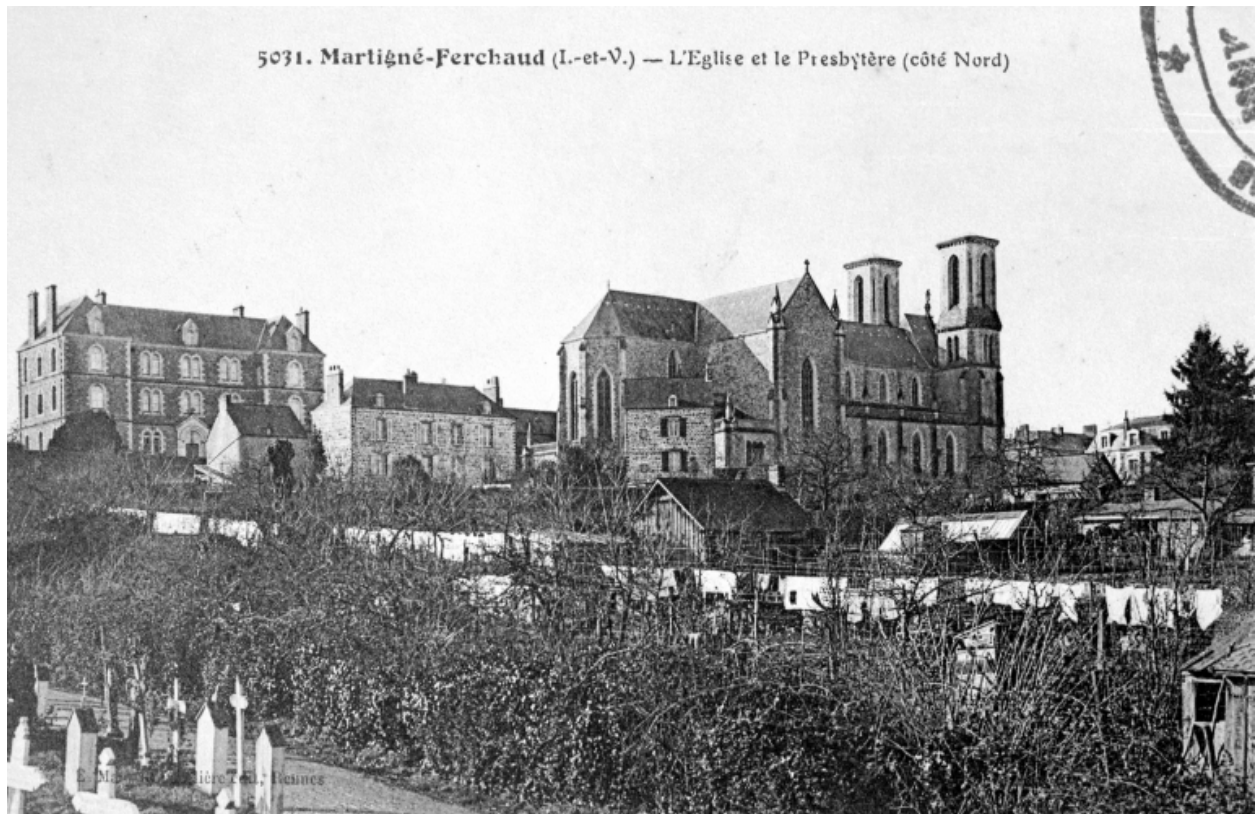
Carte postale ancienne. Elévation ouest : vue de situation.