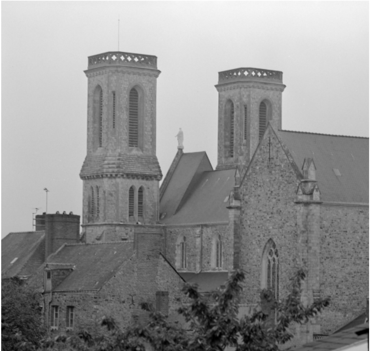
Elévation sud-est : vue générale rapprochée