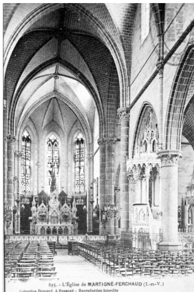
Carte postale ancienne. Intérieur : vue générale vers le chœur. IVR53_19933500735X