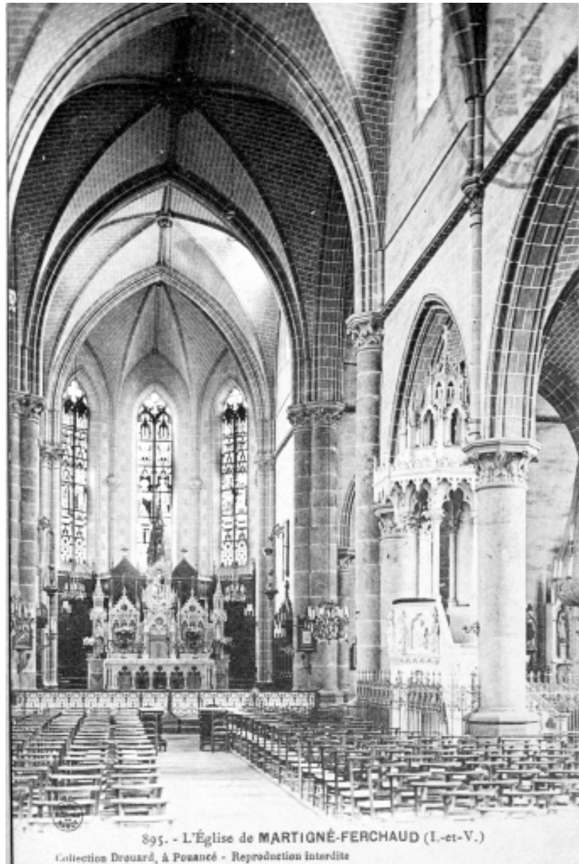
Carte postale ancienne. Intérieur : vue générale vers le chœur.