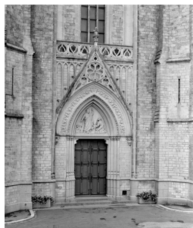
Elévation ouest, porte : vue générale IVR53_19943501487X