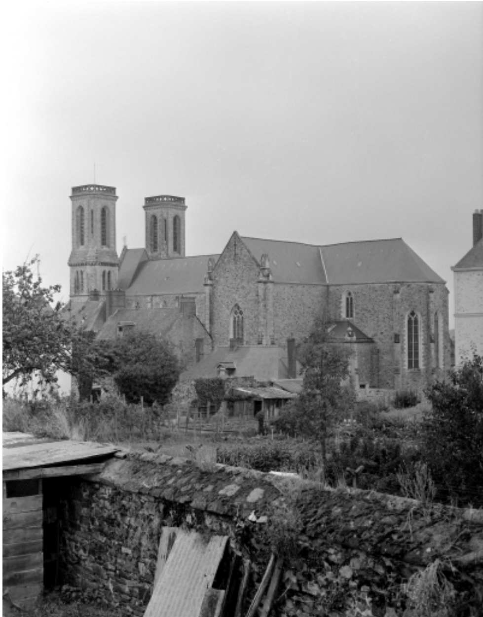
Elévation sud-est : vue générale