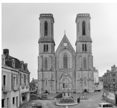
Elévation ouest : vue générale IVR53_19943501486X