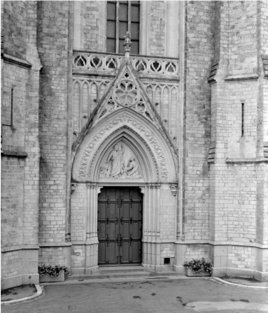
Elévation ouest, porte : vue générale