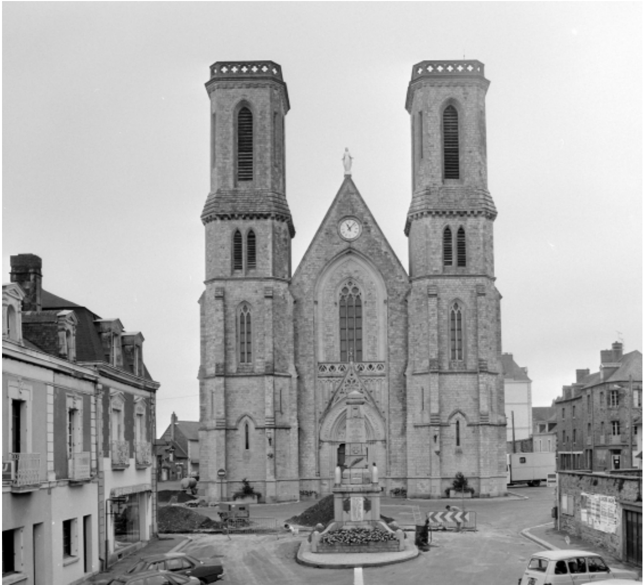
Elévation ouest : vue générale