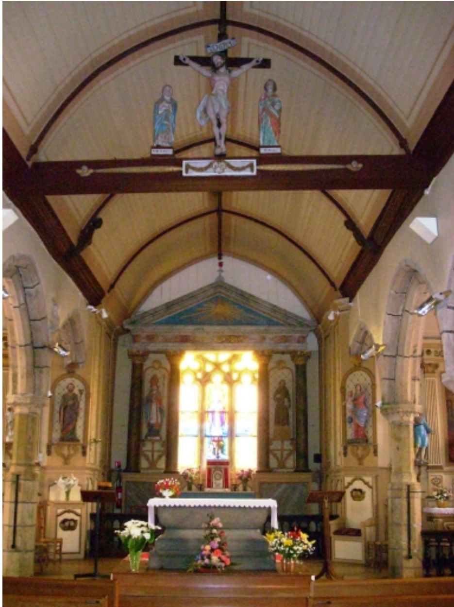
Saint-Vougay, église paroissiale Saint-Vougay : détail choeur et poutre de gloire