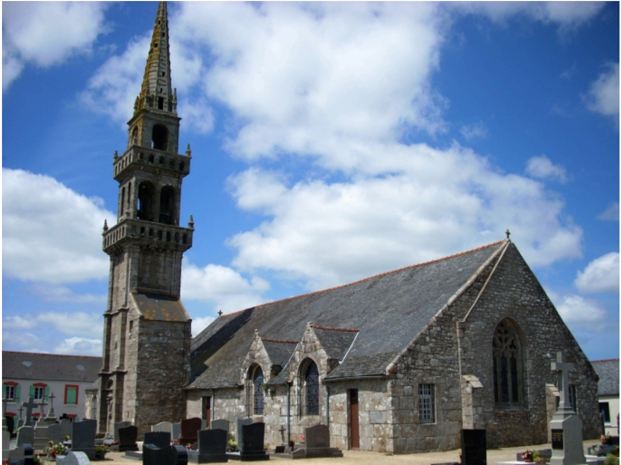
Saint-Vougay, église paroissiale Saint-Vougay : vue générale sud-est