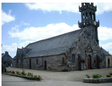
Saint-Vougay, église paroissiale Saint-Vougay : vue générale nord-ouest