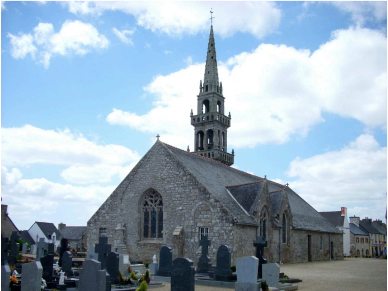
Saint-Vougay, église paroissiale Saint-Vougay : vue générale nord-est