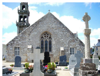
Saint-Vougay, église paroissiale Saint-Vougay : élévation est IVR53_20082906360NUCA