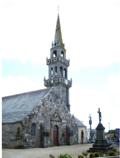
Saint-Vougay, église paroissiale Saint-Vougay : vue générale nord-ouest