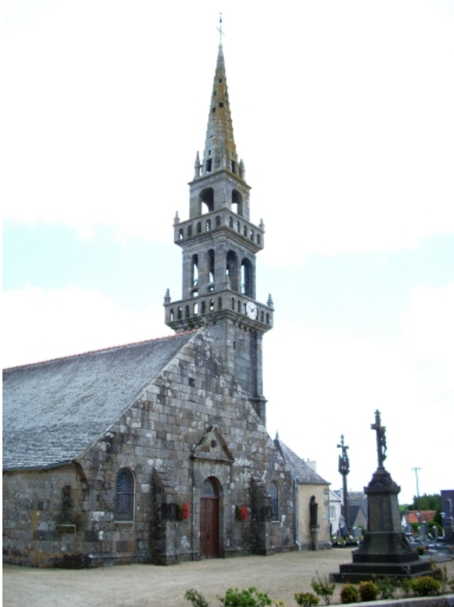
Saint-Vougay, église paroissiale Saint-Vougay : vue générale nord-ouest