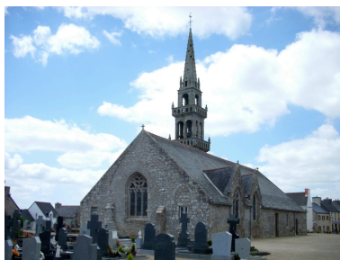
Saint-Vougay, église paroissiale Saint-Vougay : vue générale nord-est IVR53_20082906356NUCA