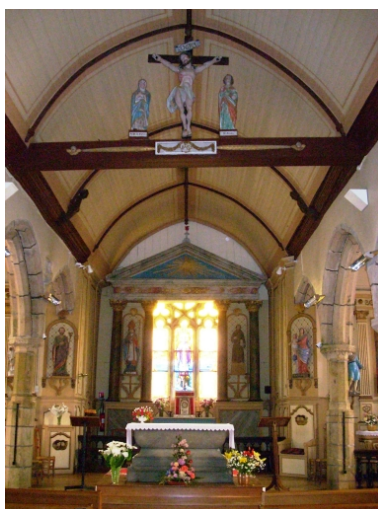
Saint-Vougay, église paroissiale Saint-Vougay : détail choeur et poutre de gloire IVR53_20082906362NUCA