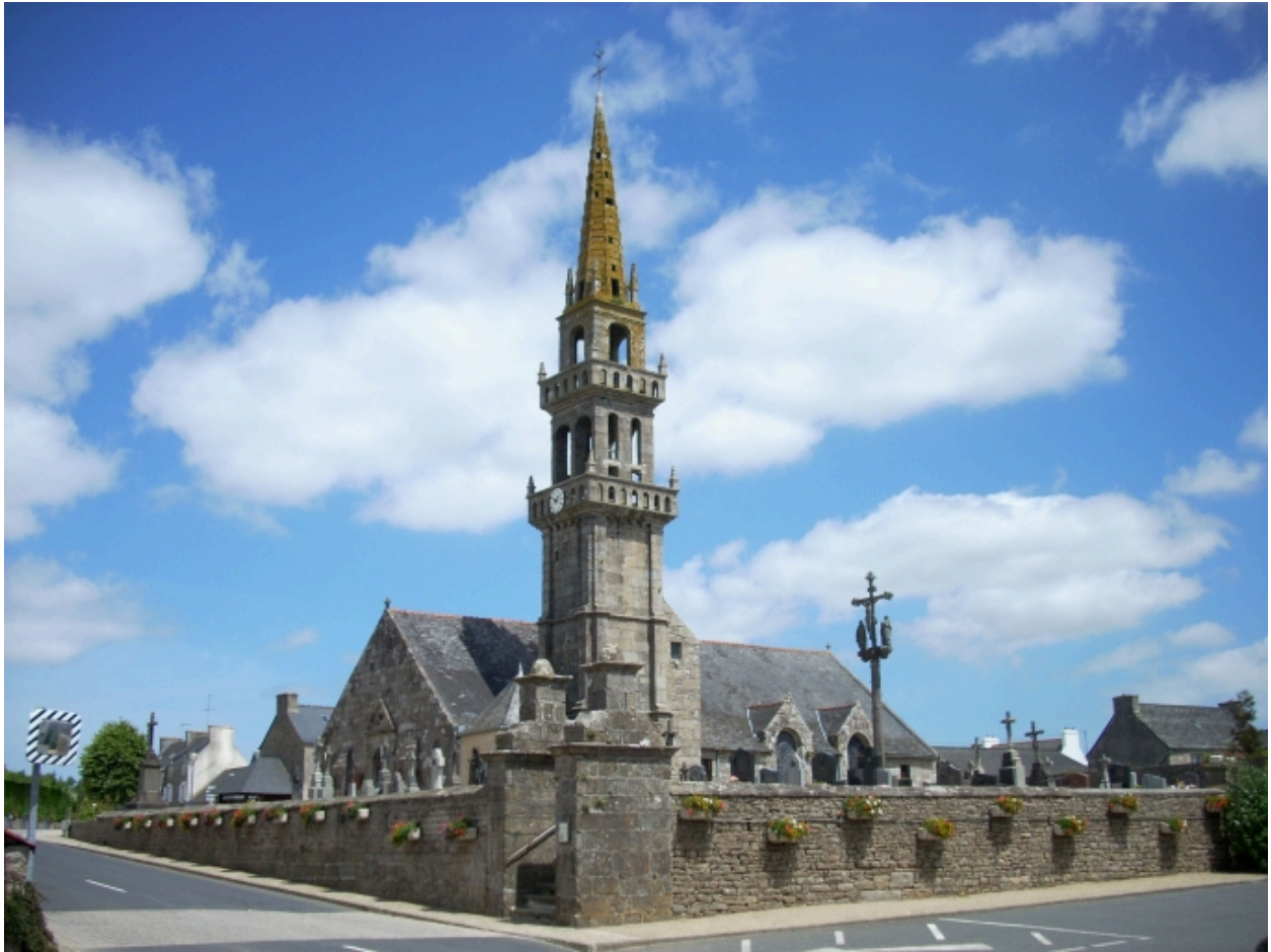
Saint-Vougay, église paroissiale Saint-Vougay : vue générale sud-ouest