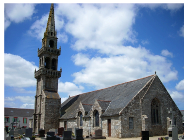
Saint-Vougay, église paroissiale Saint-Vougay : vue générale sud-est IVR53_20082906357NUCA