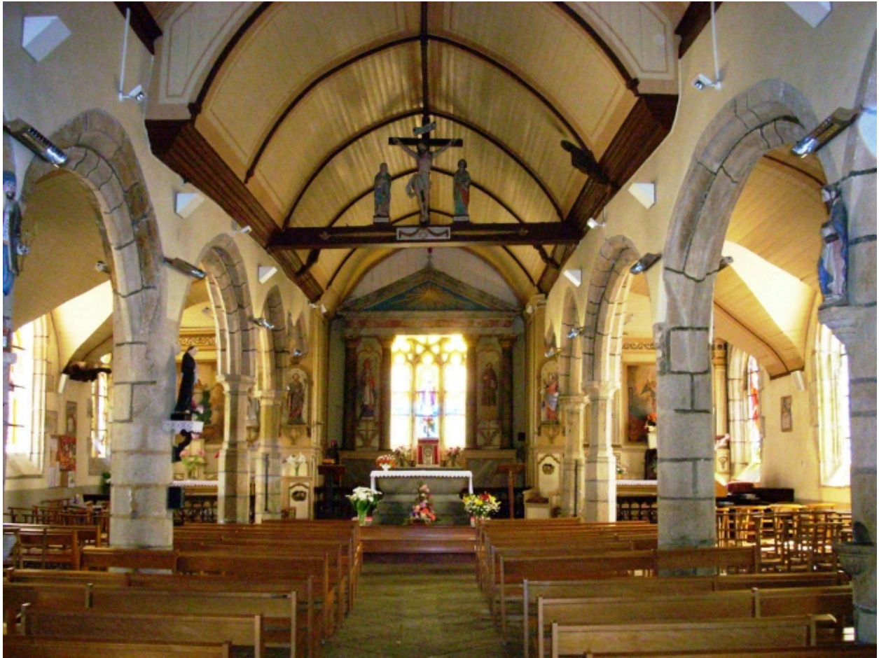
Saint-Vougay, église paroissiale Saint-Vougay : vue axiale est