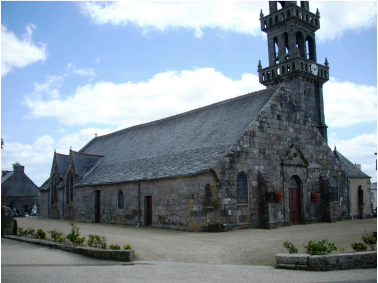
Saint-Vougay, église paroissiale Saint-Vougay : vue générale nord-ouest