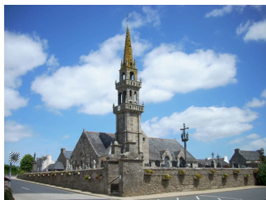
Saint-Vougay, église paroissiale Saint-Vougay : vue générale sud-ouest IVR53_20082906355NUCA