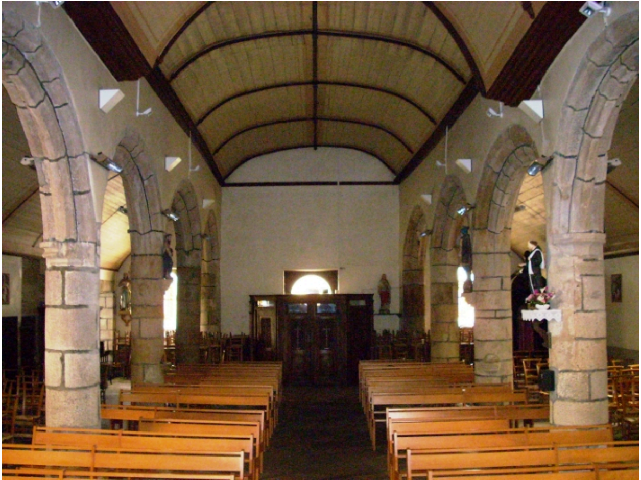
Saint-Vougay, église paroissiale Saint-Vougay : vue axiale ouest