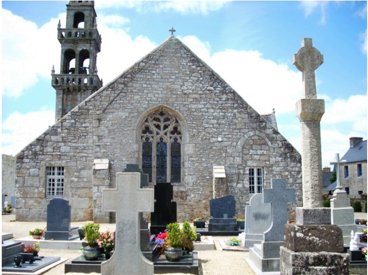
Saint-Vougay, église paroissiale Saint-Vougay : élévation est