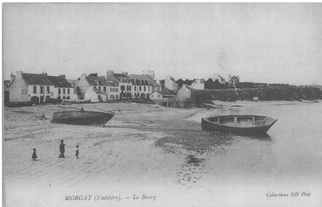
Carte postale : le bourg de Morgat