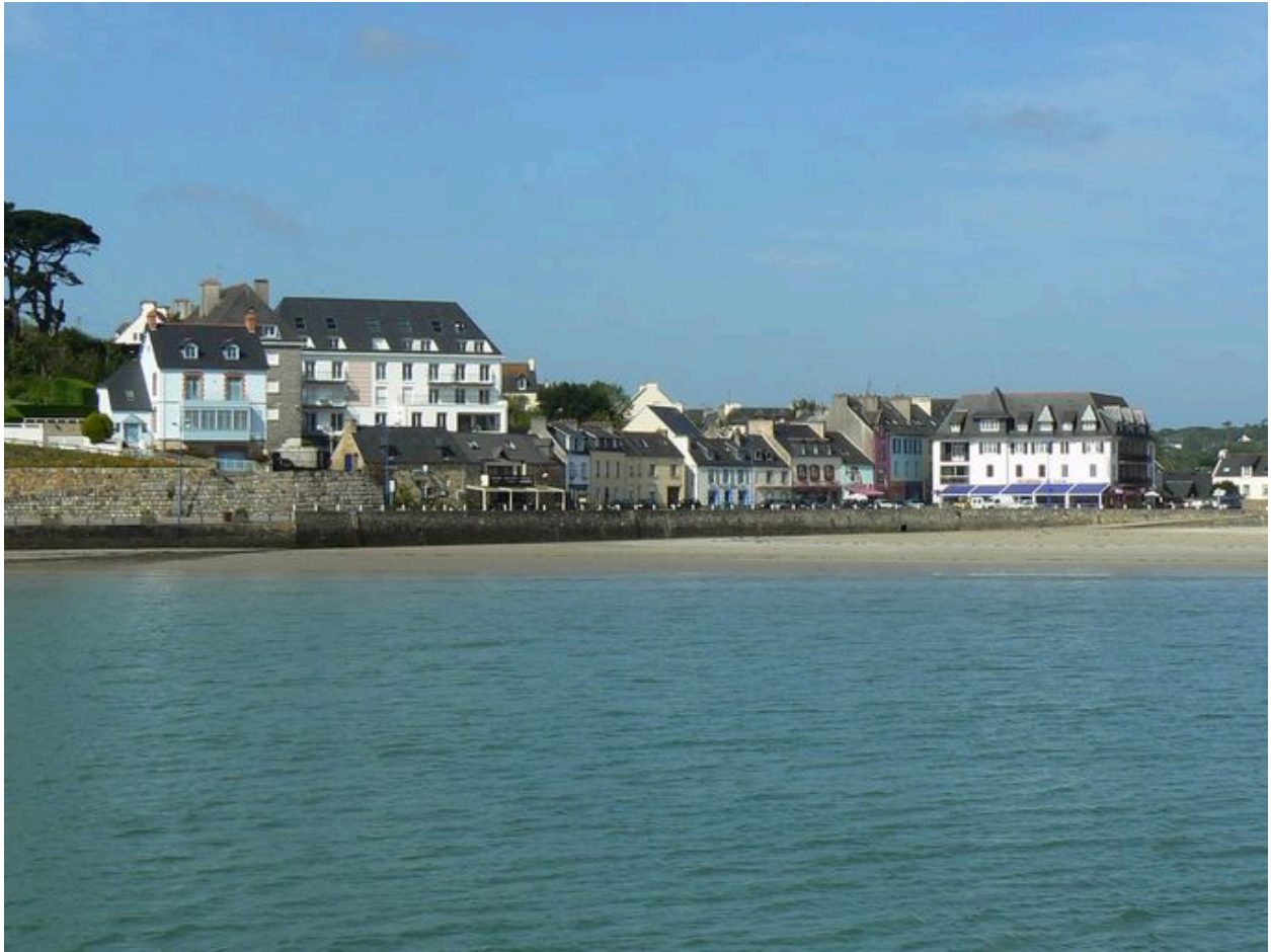
Front portuaire de Morgat