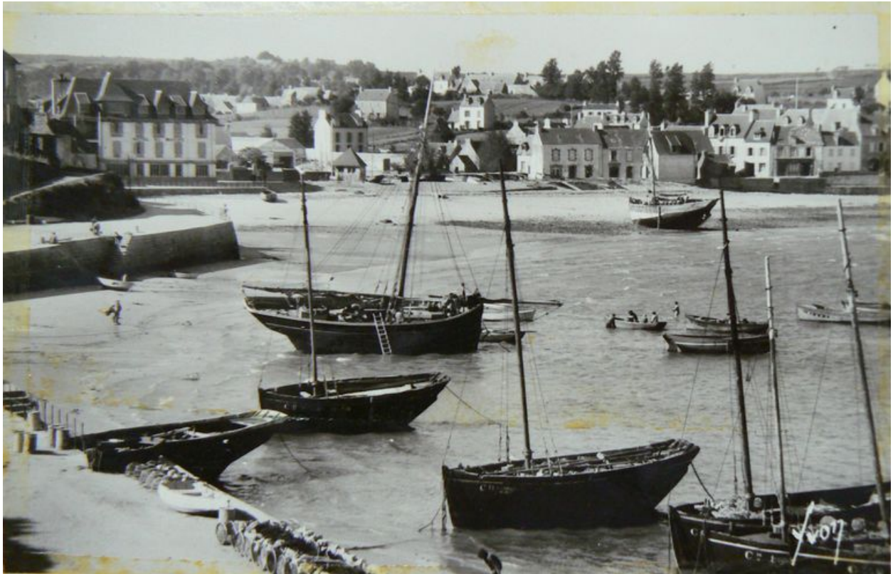
Vue ancienne du front portuaire de Morgat