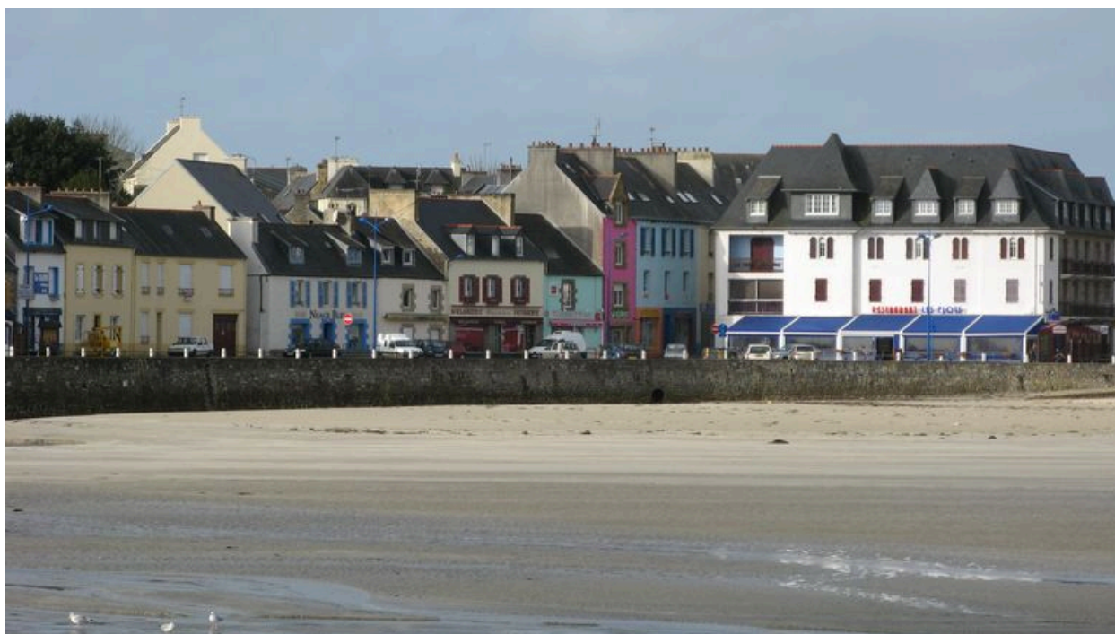
Front portuaire de Morgat