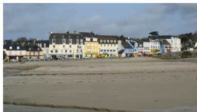
Front portuaire de Morgat IVR53_20072908751NUCA