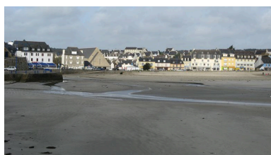
Vue générale du front portuaire de Morgat