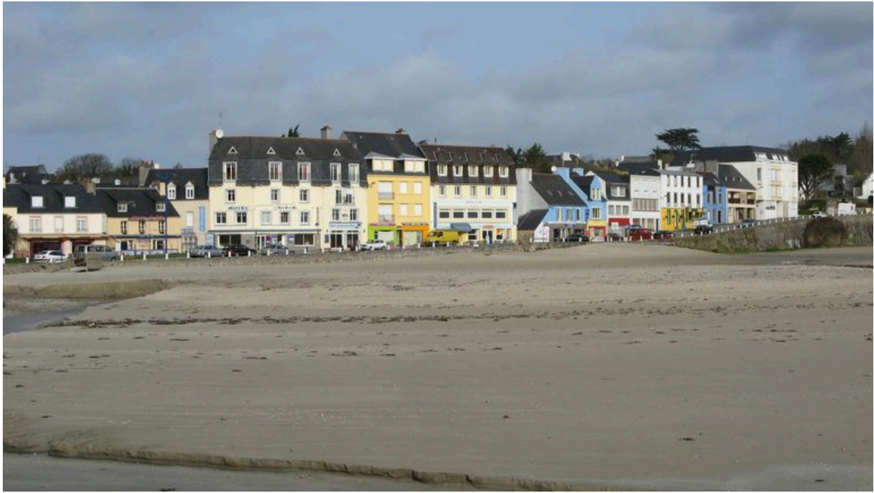
Front portuaire de Morgat