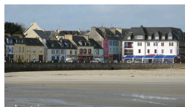
Front portuaire de Morgat IVR53_20072908749NUCA