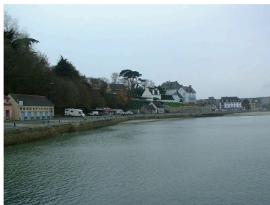
Front portuaire de Morgat IVR53_20062908618NUCA