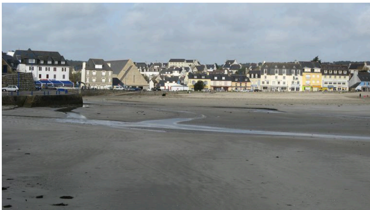
Vue générale du front portuaire de Morgat