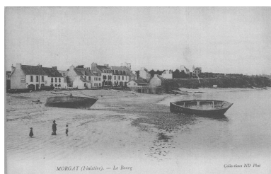
Carte postale : le bourg de Morgat IVR53_20082908380NUCB