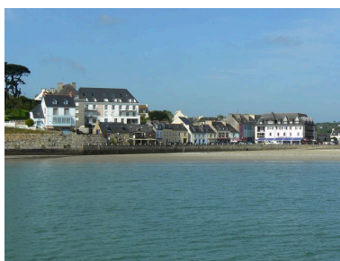
Front portuaire de Morgat