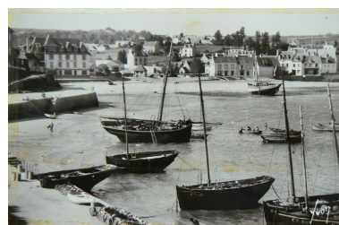
Vue ancienne du front portuaire de Morgat IVR53_20072908752NUC