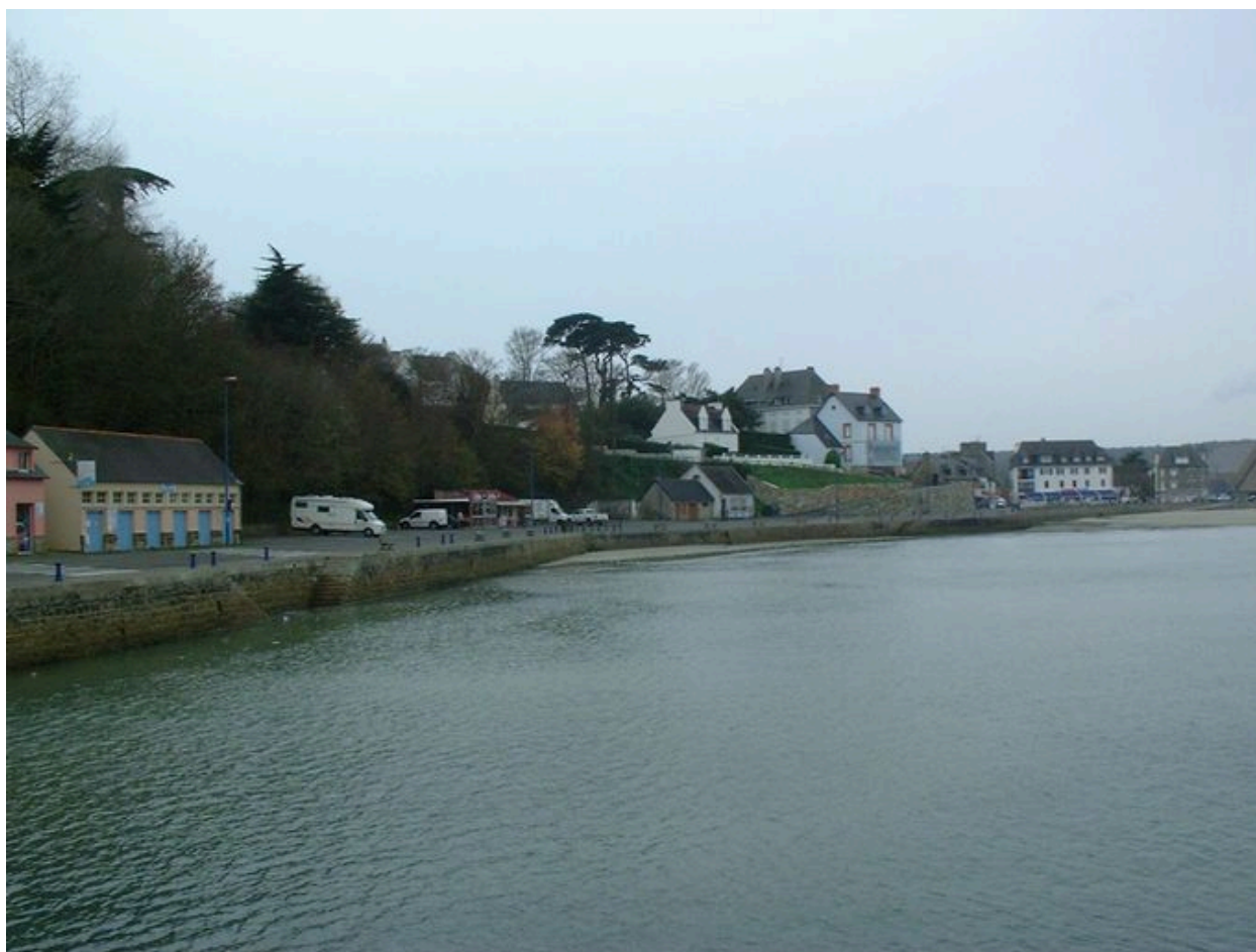
Front portuaire de Morgat