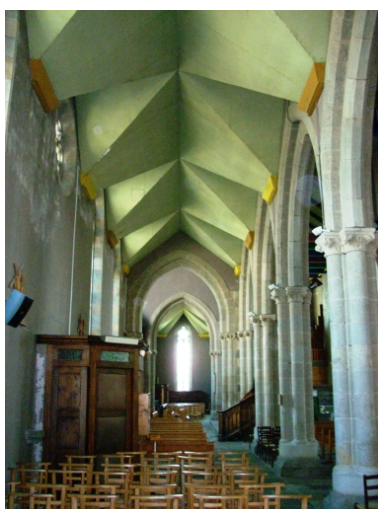
Plougastel-Daoulas, église Saint- Pierre : transept sud depuis l'est IVR53_20082906069NUCA