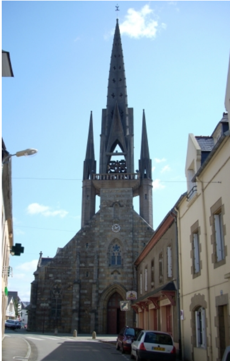
Plougastel-Daoulas, église Saint-Pierre : élévation ouest