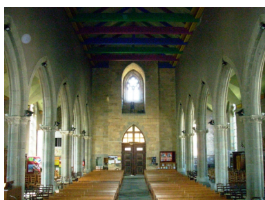
Plougastel-Daoulas, église Saint-Pierre : vue axiale ouest IVR53_20082906068NUCA