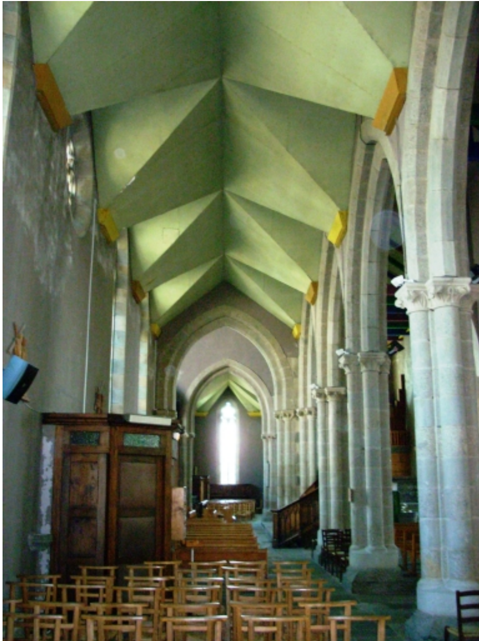
Plougastel-Daoulas, église Saint-Pierre : transept sud depuis l'est