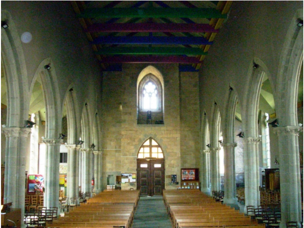
Plougastel-Daoulas, église Saint-Pierre : vue axiale ouest