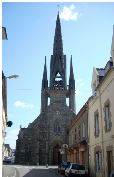
Plougastel-Daoulas, église Saint-Pierre : élévation ouest IVR53_20082906065NUCA