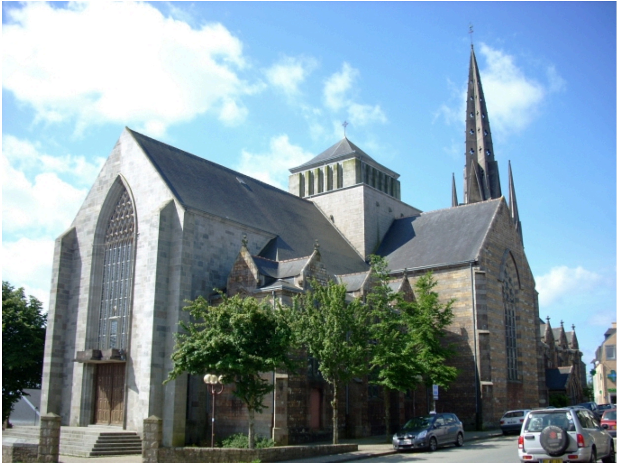
Plougastel-Daoulas, église Saint-Pierre : vue générale nord-est