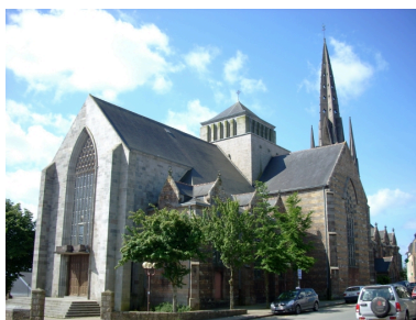
Plougastel-Daoulas, église Saint- Pierre : vue générale nord-est IVR53_20082906066NUCA