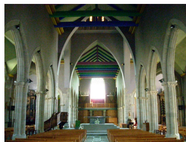
Plougastel-Daoulas, église Saint-Pierre : vue axiale est IVR53_20082906067NUCA