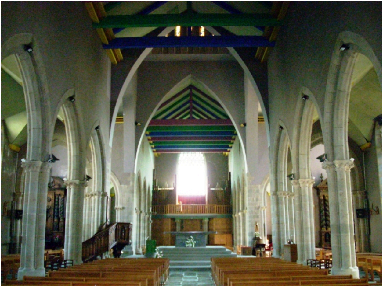
Plougastel-Daoulas, église Saint-Pierre : vue axiale est