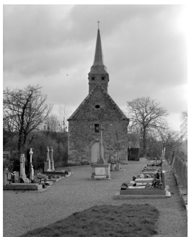
Elévation Ouest : vue générale IVR53_19943500689X