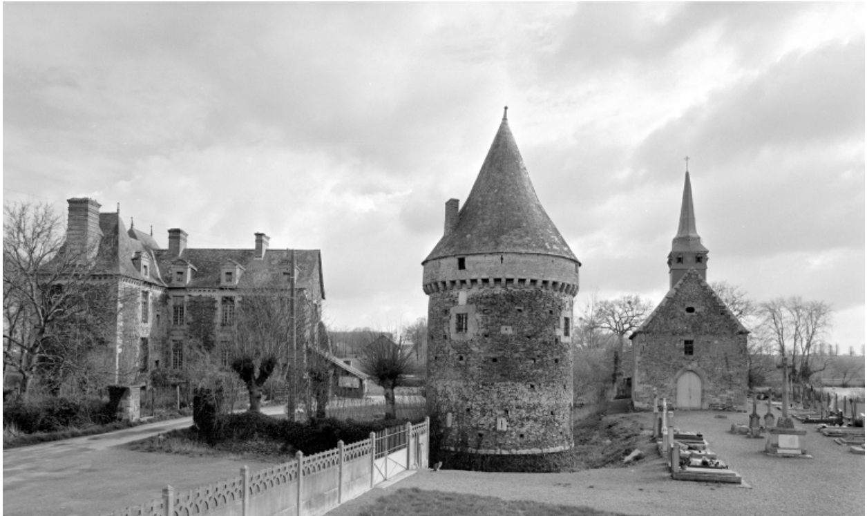
Elévation Ouest : vue de situation