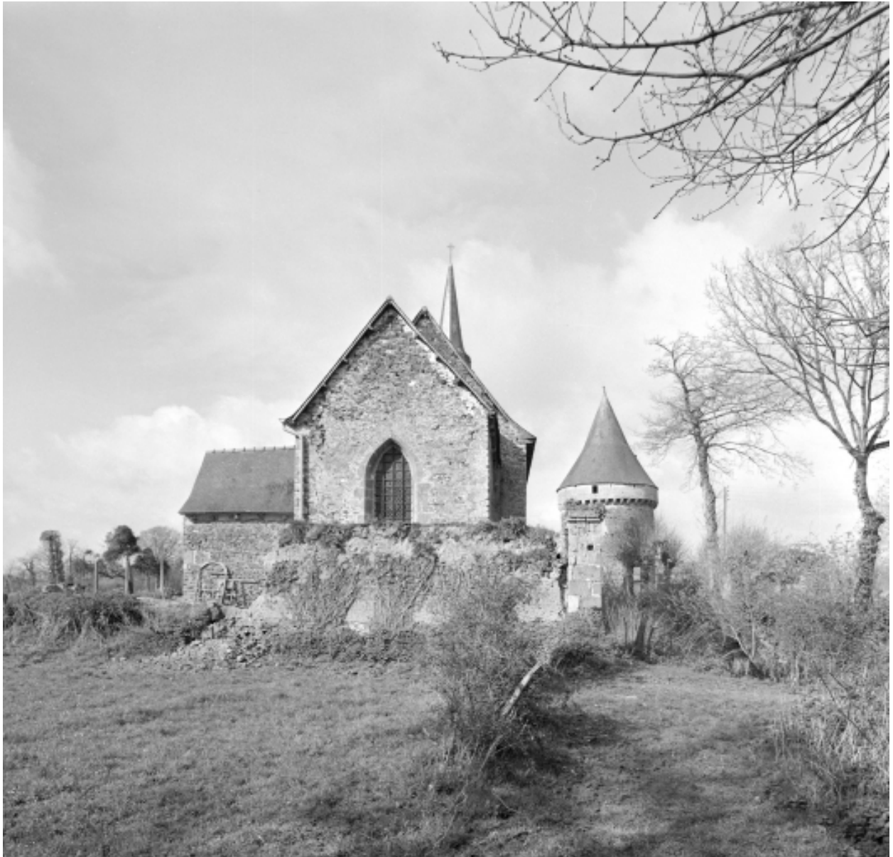
Elévation Est : vue générale