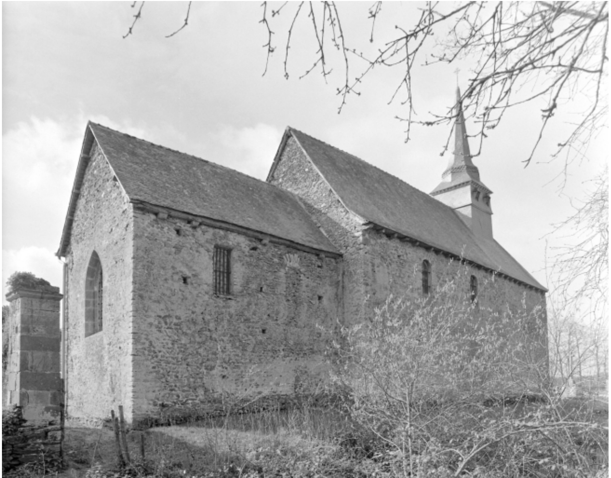
Elévation Nord-Est : vue générale