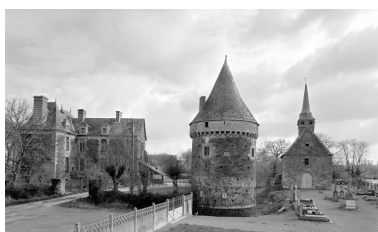
Elévation Ouest : vue de situation IVR53_19943500690X