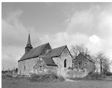
Elévation Sud-Est : vue générale IVR53_19943500687X