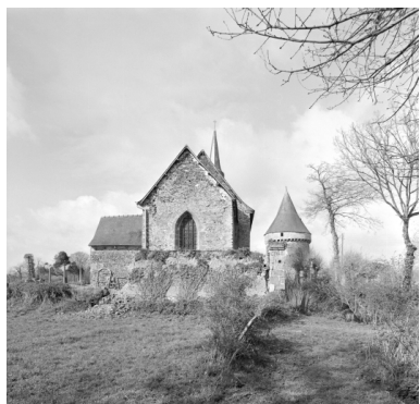
Elévation Est : vue générale IVR53_19943500686X