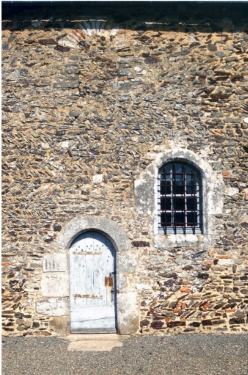
Elévation sud : détail porte.