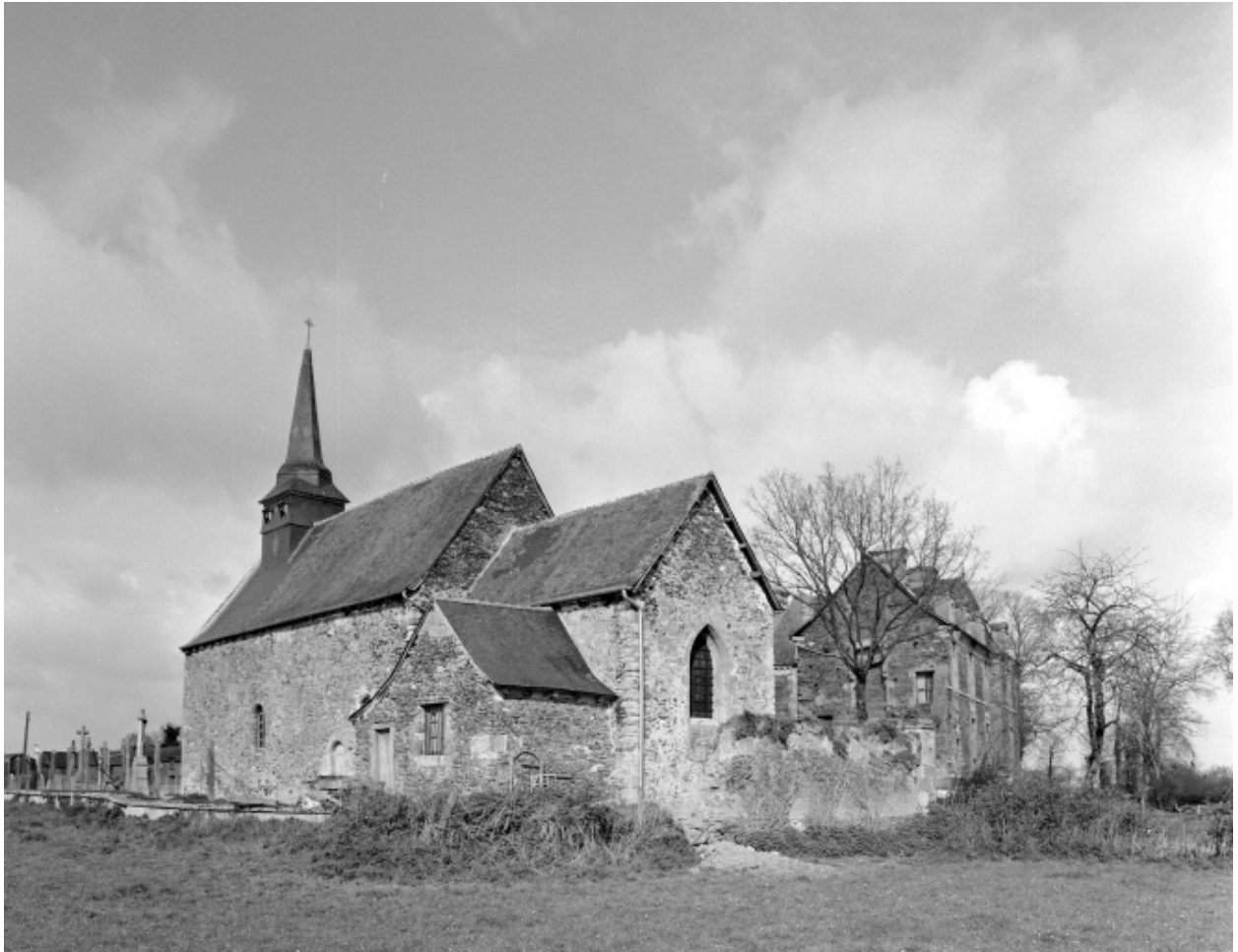
Elévation Sud-Est : vue générale