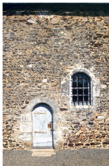
Elévation sud : détail porte. IVR53_19943501983ZA