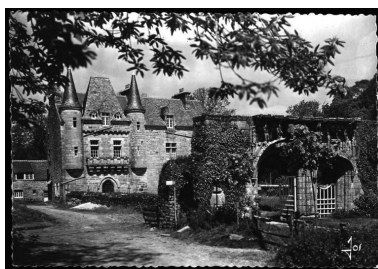
Trémel : manoir de Trébriant, vue générale depuis le sud, carte postale