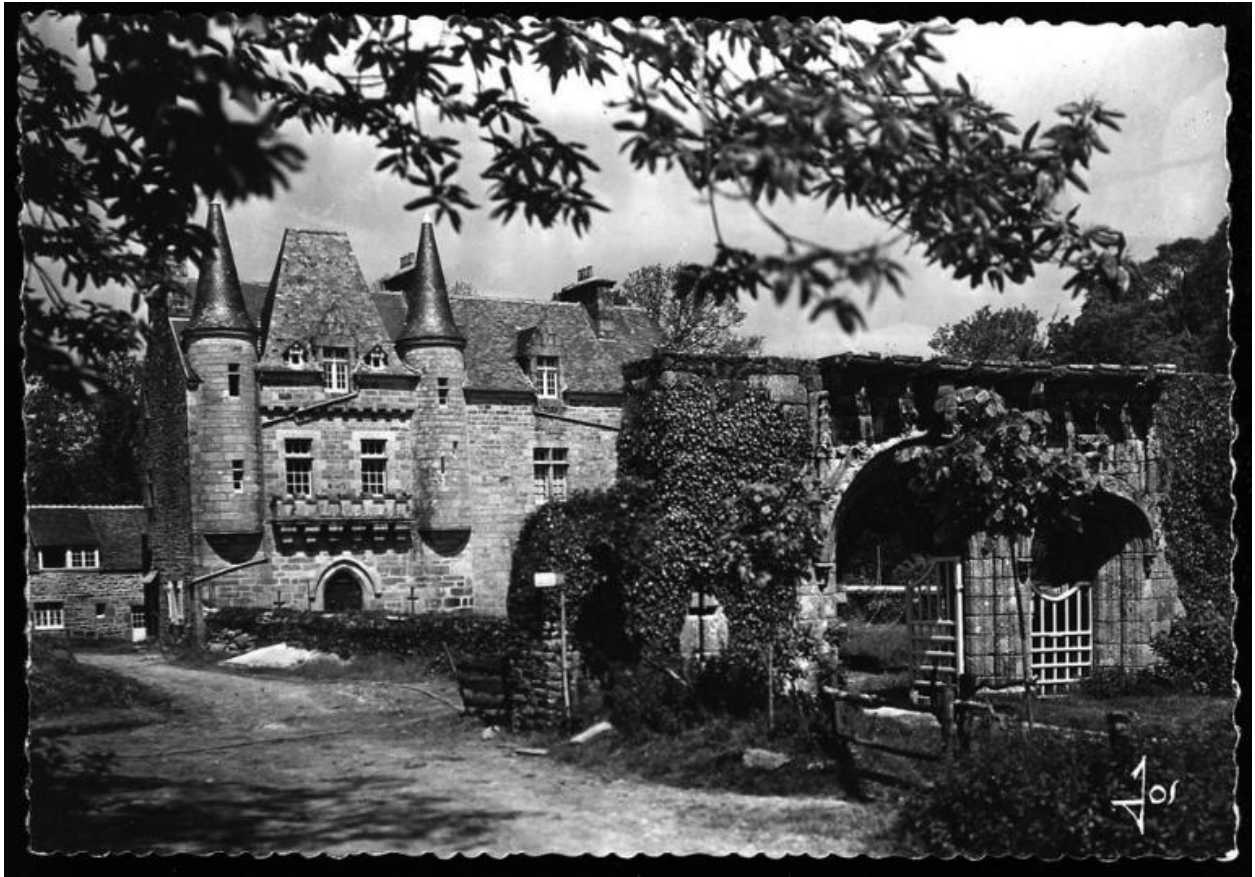
Trémel : manoir de Trébriant, vue générale depuis le sud, carte postale