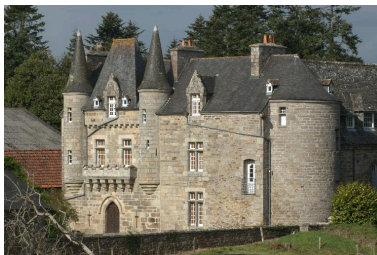
Trémel : manoir de Trébriant, vue générale depuis l'est, photographie de 2009 IVR53_20092200253NUCA