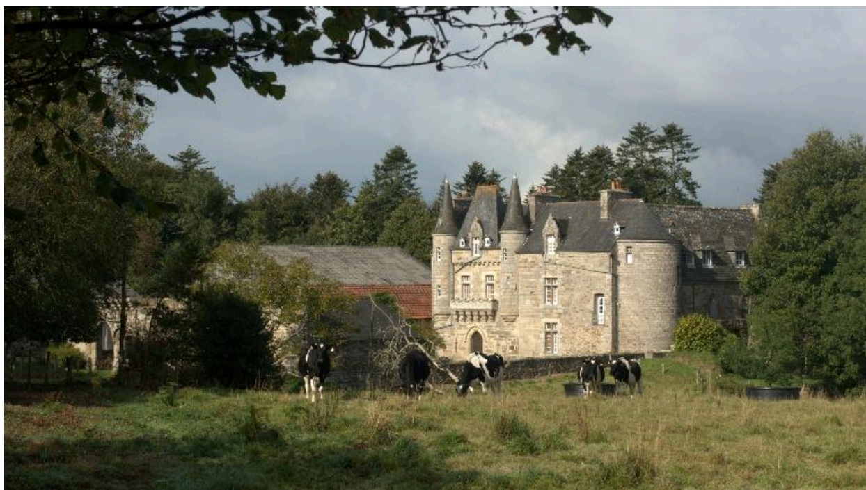
Trémel : manoir de Trébriant, vue générale depuis l'est, photographie de 2009