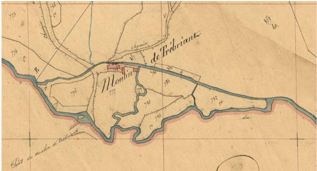
Extrait du cadastre ancien de la commune de Trémel, 1848 : moulin de Trébriant. Il était alimenté par le Douron