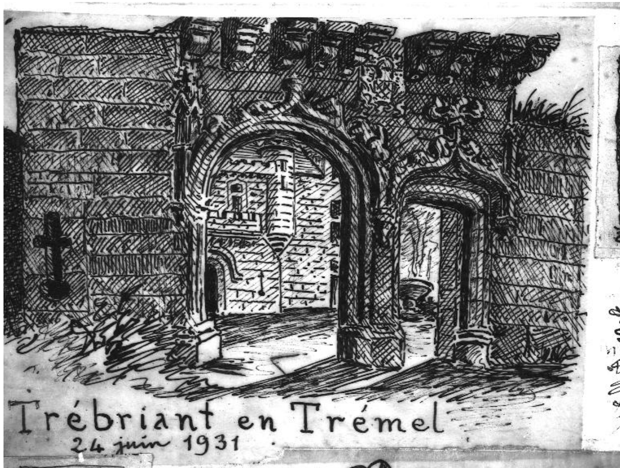
Trémel : manoir de Trébriant, vue du portail d'entrée (portes piétonne et charretière de style Gothique), croquis par Henri Frotier de la Messelière, 24 juin 1931