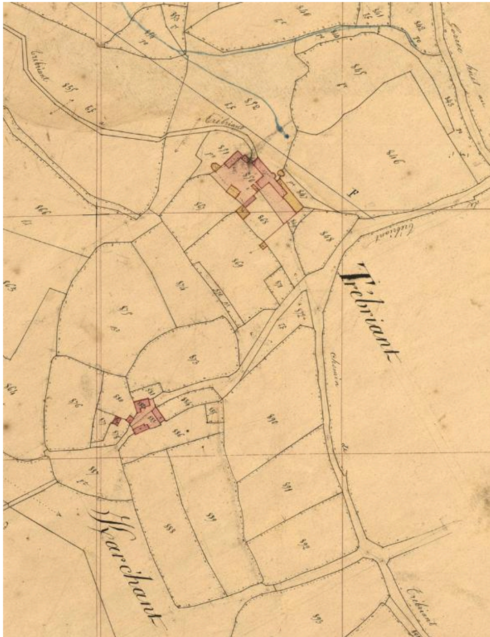
Extrait du cadastre ancien de la commune de Trémel, 1848 : Trébriant et K[er]arc'hant