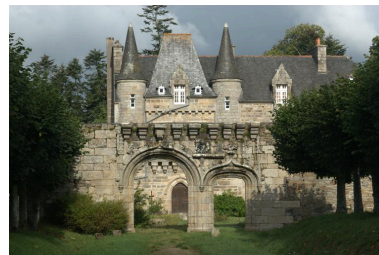
Trémel : manoir de Trébriant, vue générale depuis le sud-sud-est, photographie de 2009. Les portes charretière et piétonne (à arc surbaissé) étaient surmontées d'une galerie reposant sur des mâchicoulis