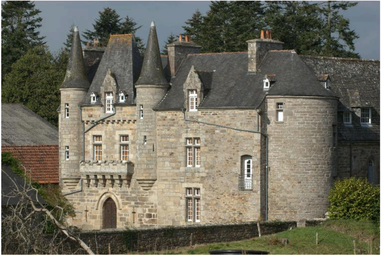
Trémel : manoir de Trébriant, vue générale depuis l'est, photographie de 2009