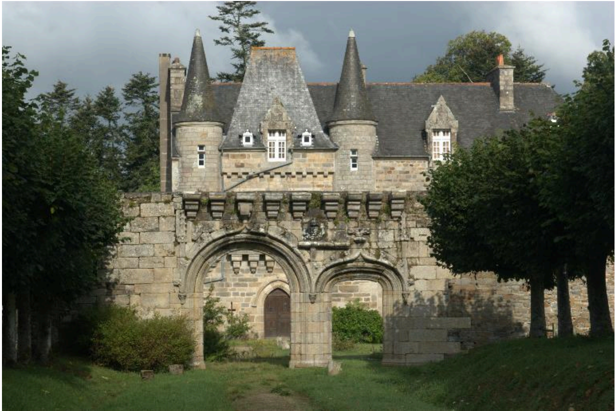
Trémel : manoir de Trébriant, vue générale depuis le sud-sud-est, photographie de 2009. Les portes charretière et piétonne (à arc surbaissé) étaient surmontées d'une galerie reposant sur des mâchicoulis