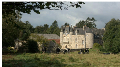
Trémel : manoir de Trébriant, vue générale depuis l'est, photographie de 2009 IVR53_20092200250NUCA

oblique depuis l'est, carte postale (collection particulière) IVR53_20142205655NUCA