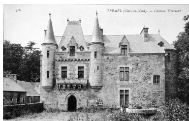
Trémel : manoir de Trébriant, élévation antérieure orientée vers le sud-est, carte postale Autr. Hamon