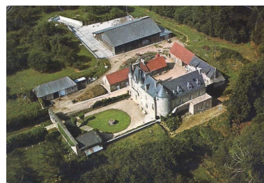
Trémel : manoir et métairie de Trébriant, vue aérienne