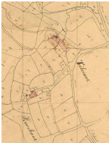
Extrait du cadastre ancien de la commune de Trémel, 1848 : Trébriant et K[er]arc'hant