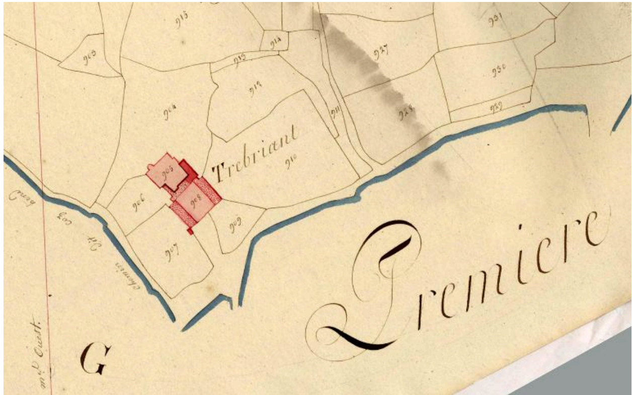
Extrait du cadastre ancien de la commune de Plestin, 1814 : manoir de Trébriant