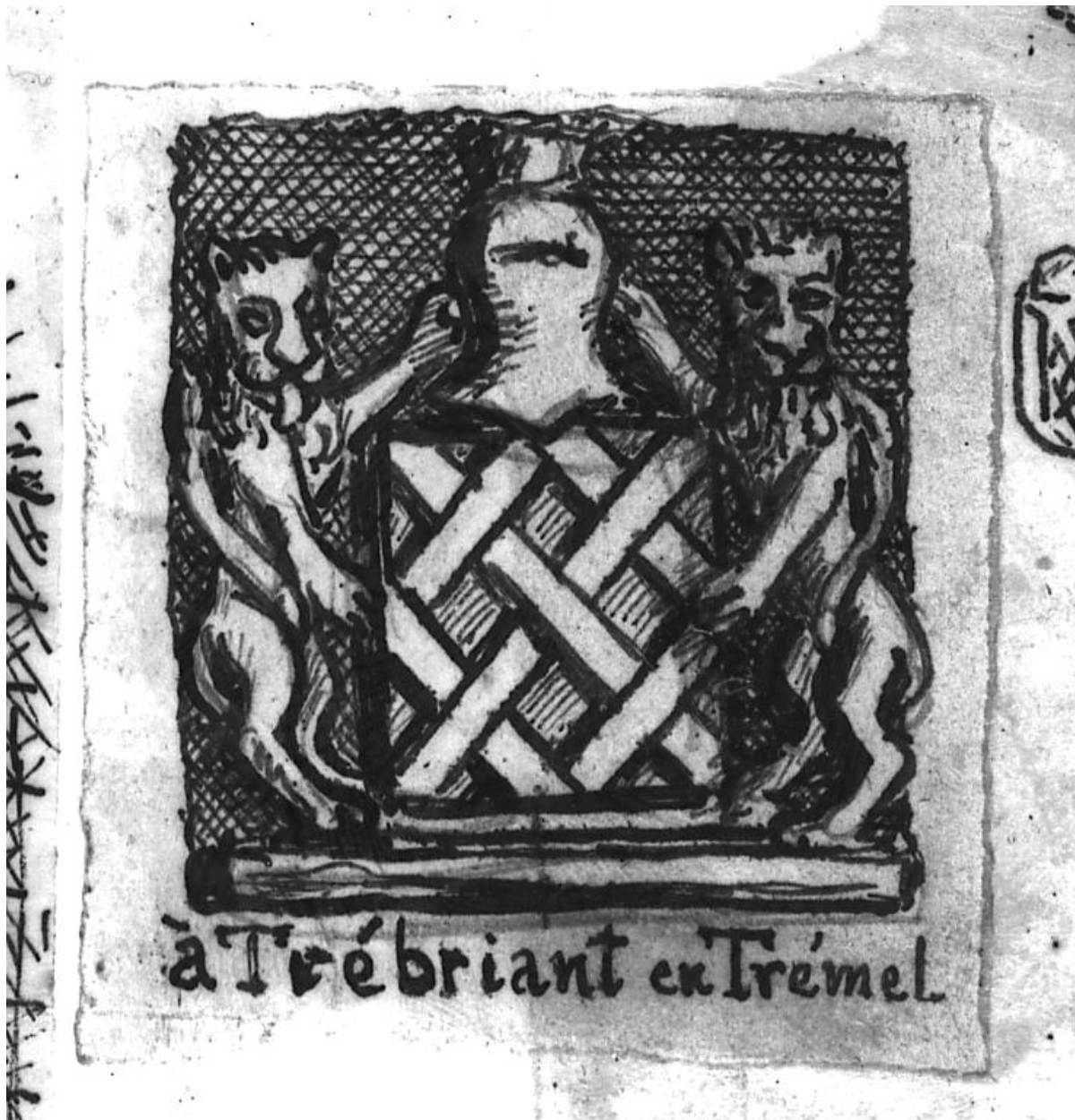
Trémeur : manoir de Trébriant, armoiries, croquis par Henri Frotier de la Messelière, 24 juin 1931