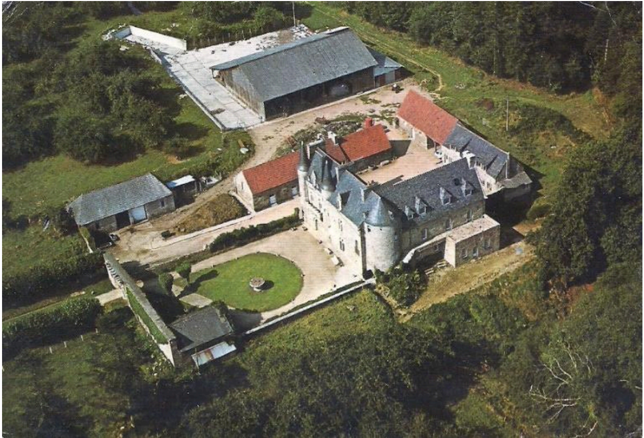
Trémel : manoir et métairie de Trébriant, vue aérienne oblique depuis l'est, carte postale