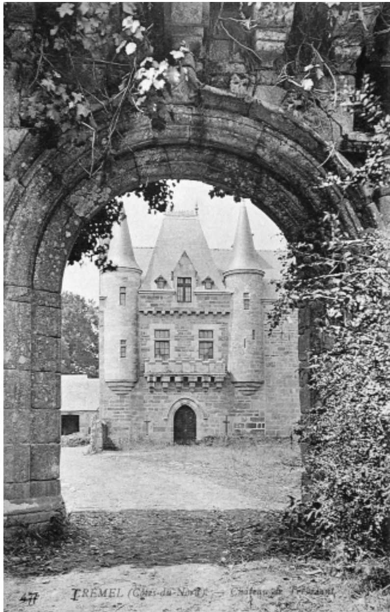
Trémel : manoir de Trébriant, vue du pavillon à travers le portail d'entrée, carte postale