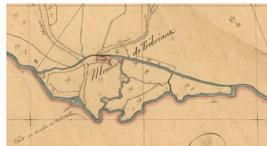
Extrait du cadastre ancien de la commune de Trémel, 1848 : moulin de Trébriant. Il était alimenté par le Douron