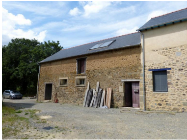
Vue générale sud de la dépendance IVR53_20243531372NUCA

IVR53_20243531369NUCA