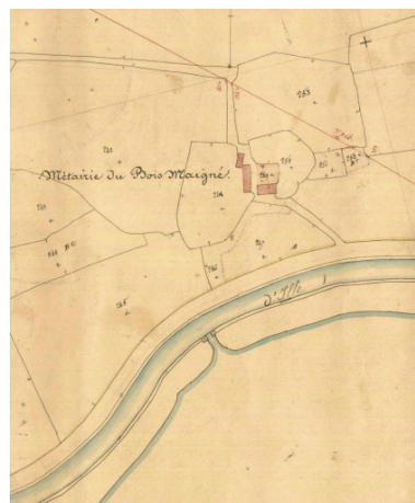
La métairie sur le cadastre de 1835