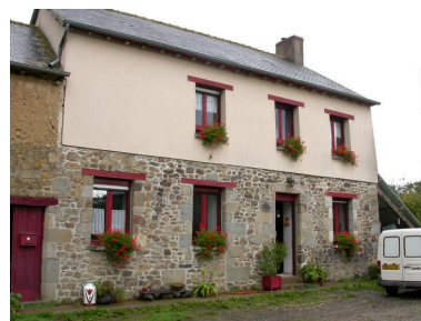
Le logis