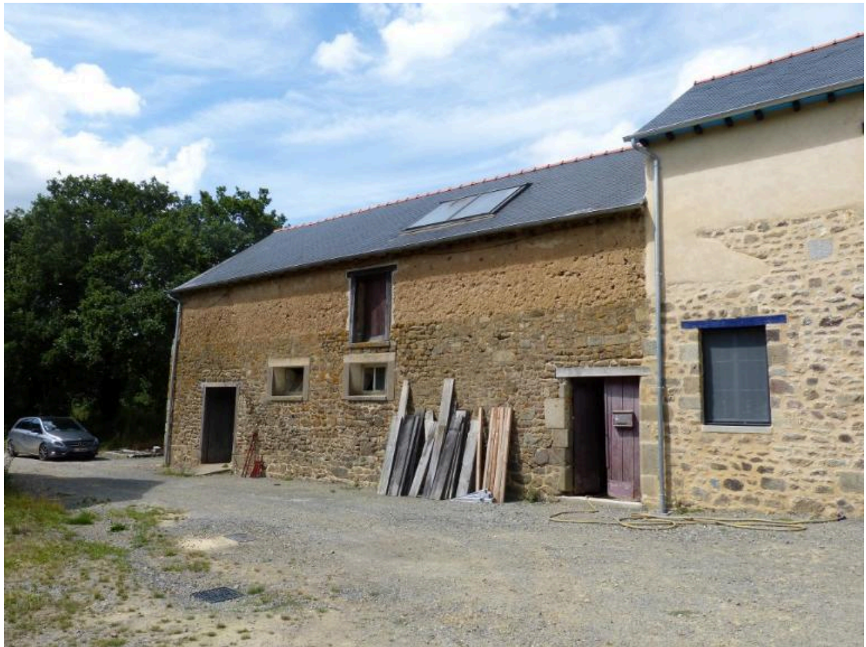
Vue générale sud de la dépendance