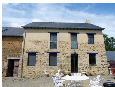
Vue générale sud