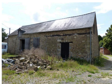
Vue générale est de la grange IVR53_20243531373NUCA