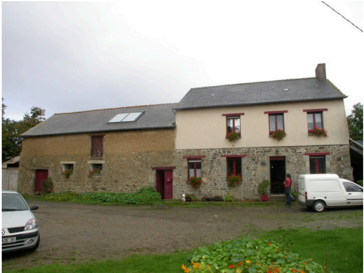
Vue générale sud