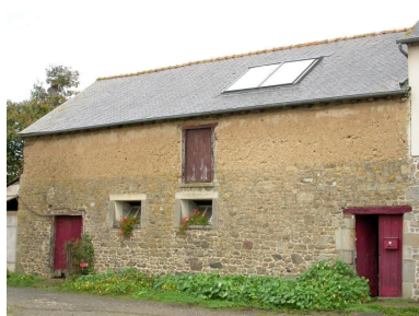
L'étable