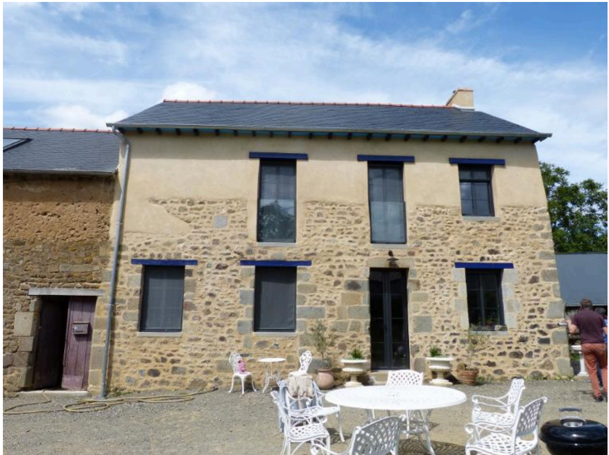
Vue générale sud