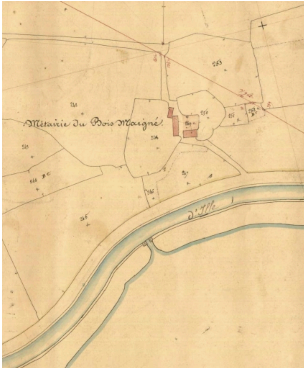
La métairie sur le cadastre de 1835