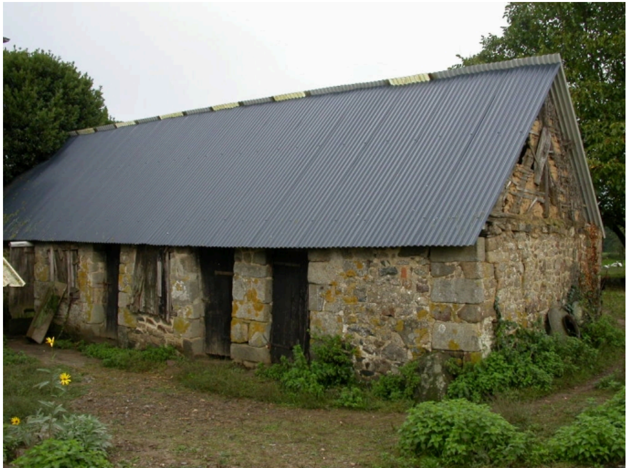
Les porcheries et le fournil