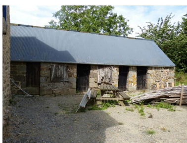
Vue générale sud de la porcherie