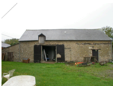
La grange