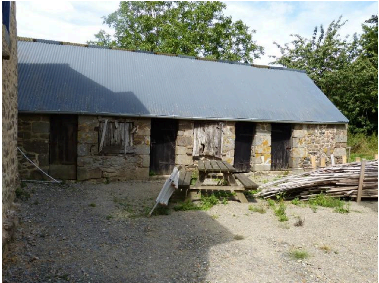
Vue générale sud de la porcherie