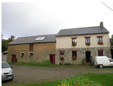
Vue générale sud IVR53_20053518925NUCA