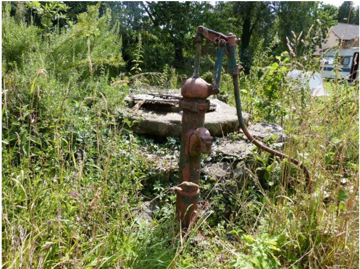
Puits et pompe à eau