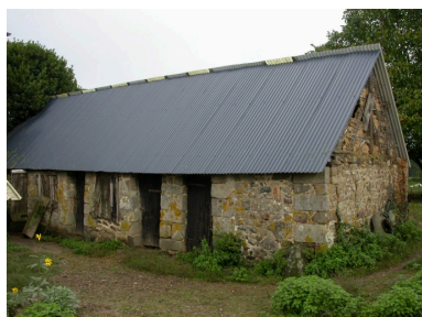
Les porcheries et le fournil IVR53_20053518930NUCA