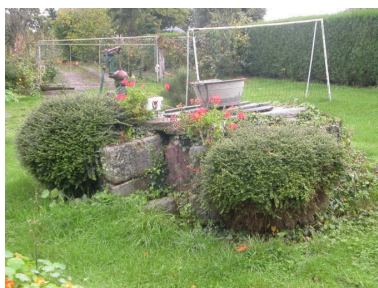
Le puits