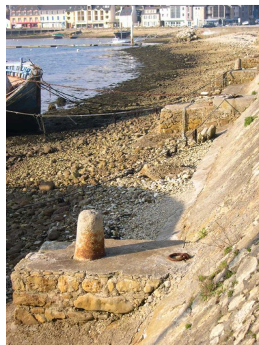
Bittes d'amarage