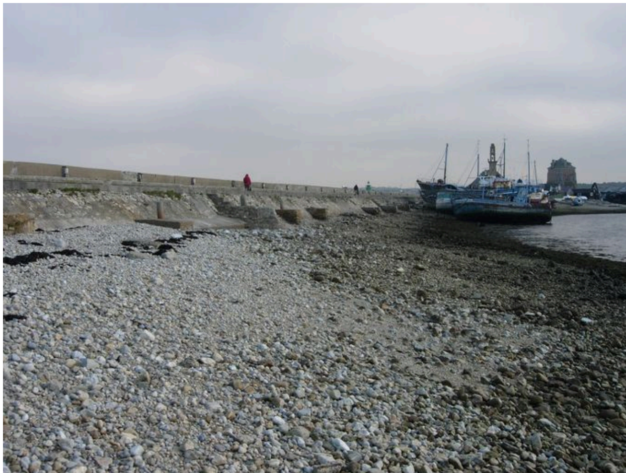
Vue de la digue depuis la grève