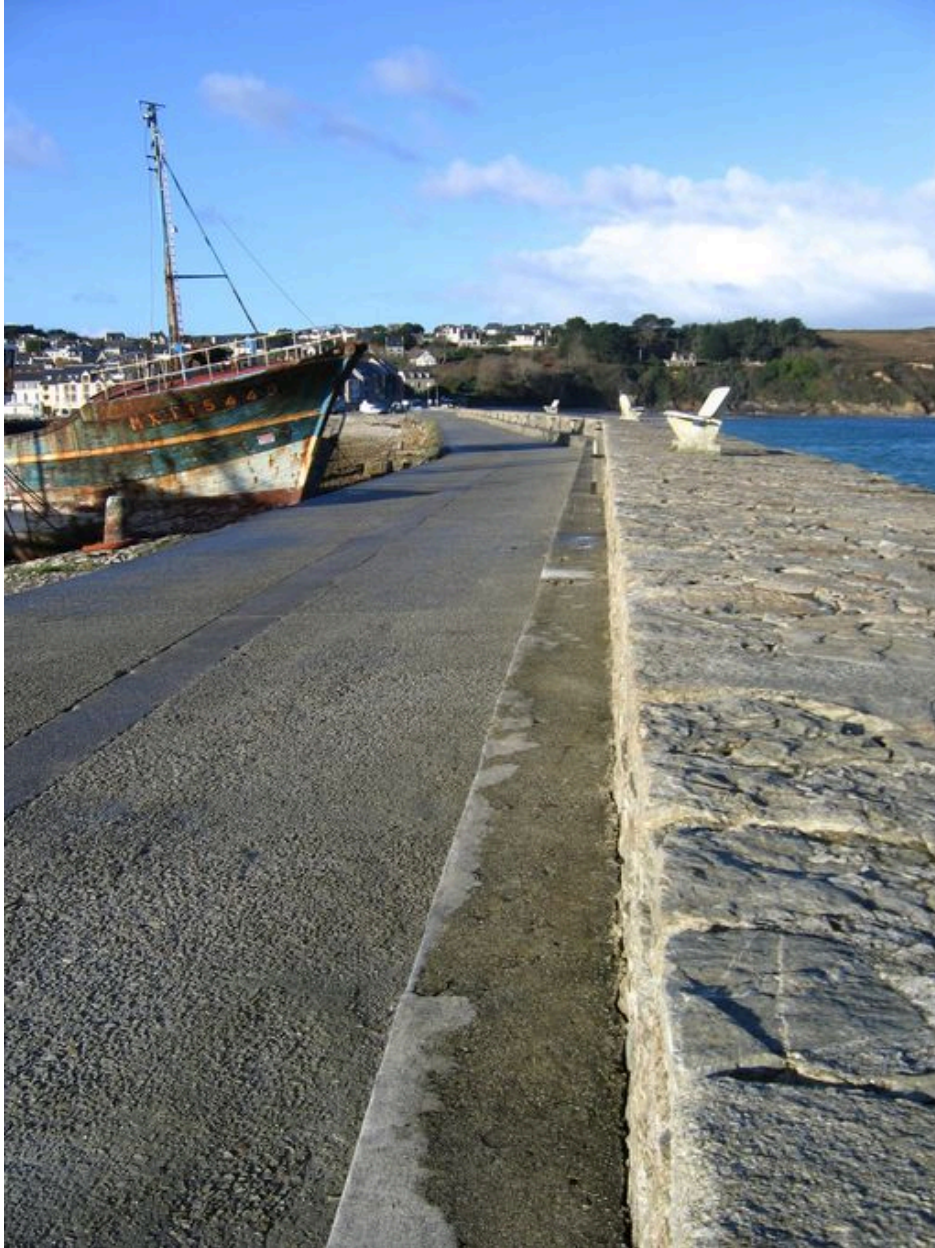
Vue générale de la digue-route du Sillon