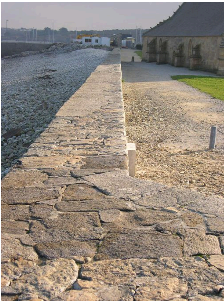
Vue de la digue vers l'est