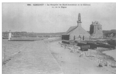
Carte postale : la chapelle de Roch'Amador et le château vu de la digue