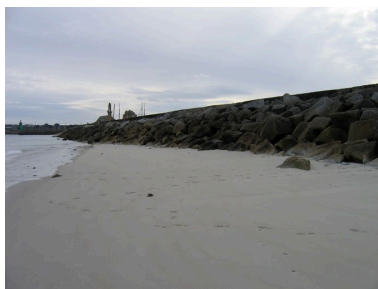
Vue de la digue-route depuis la plage du Corréjou IVR53_20062908395NUCA