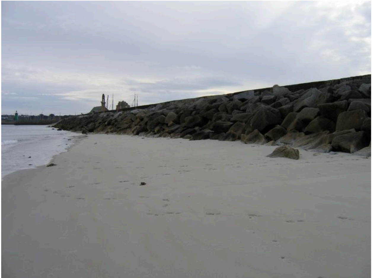
Vue de la digue-route depuis la plage du Corréjou