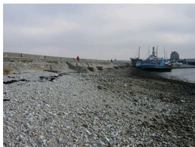
Vue de la digue depuis la grève IVR53_20062908387NUCA