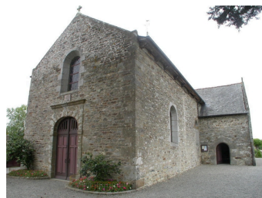
Vue sud-ouest IVR53_20053508252NUCA