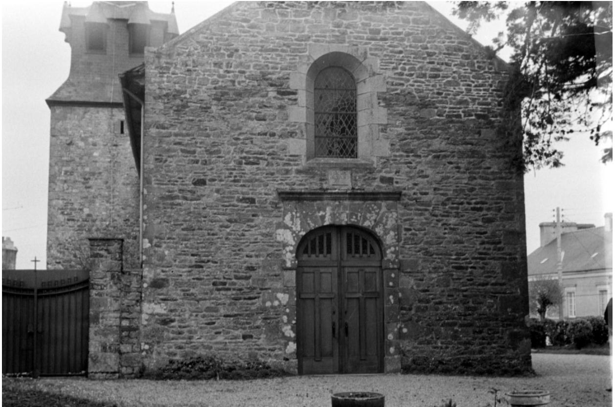
Entrée principale ouest, prise de vue de 1970