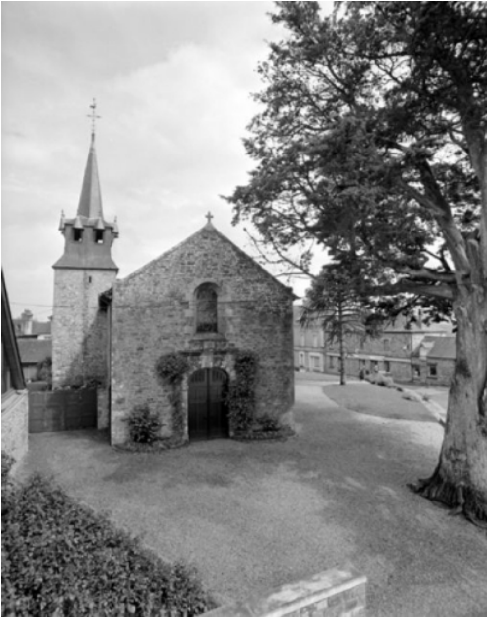
Elévation ouest : vue générale