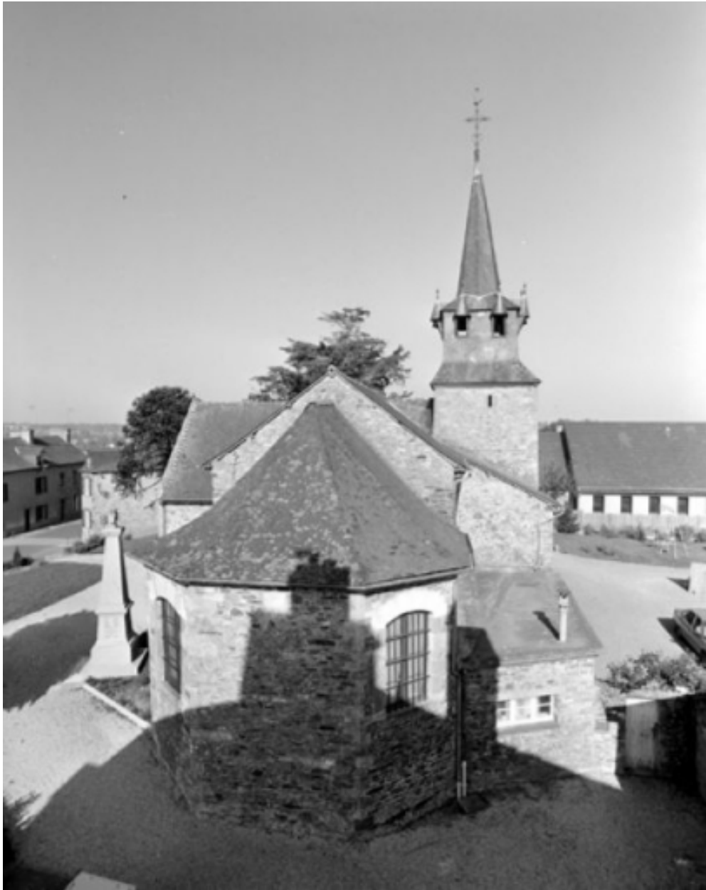
Elévation est : vue générale