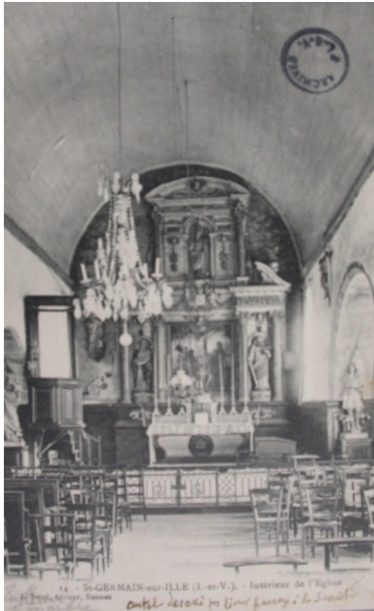
L'intérieur de l'église sur une carte postale ancienne