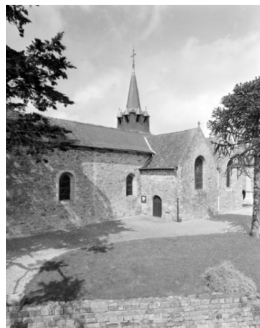
Elévation sud : vue générale IVR53_19943500927X