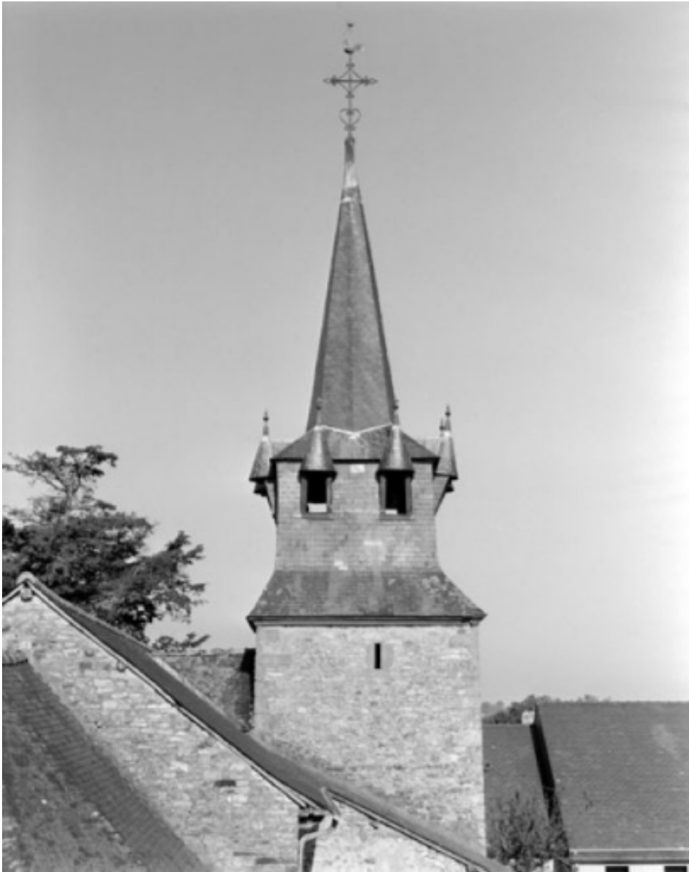
Elévation est, clocher : vue générale