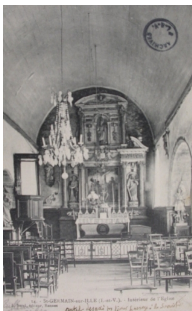
L'intérieur de l'église sur une carte postale ancienne IVR53_20053508467NUCA