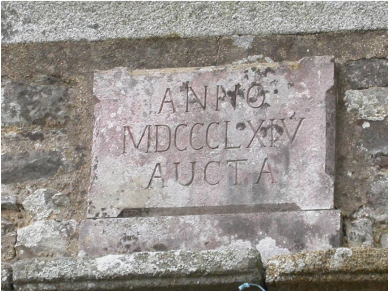
Détail de la plaque située au-dessus de la porte ouest