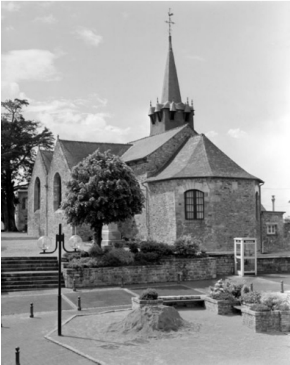
Elévation sud-est : vue générale