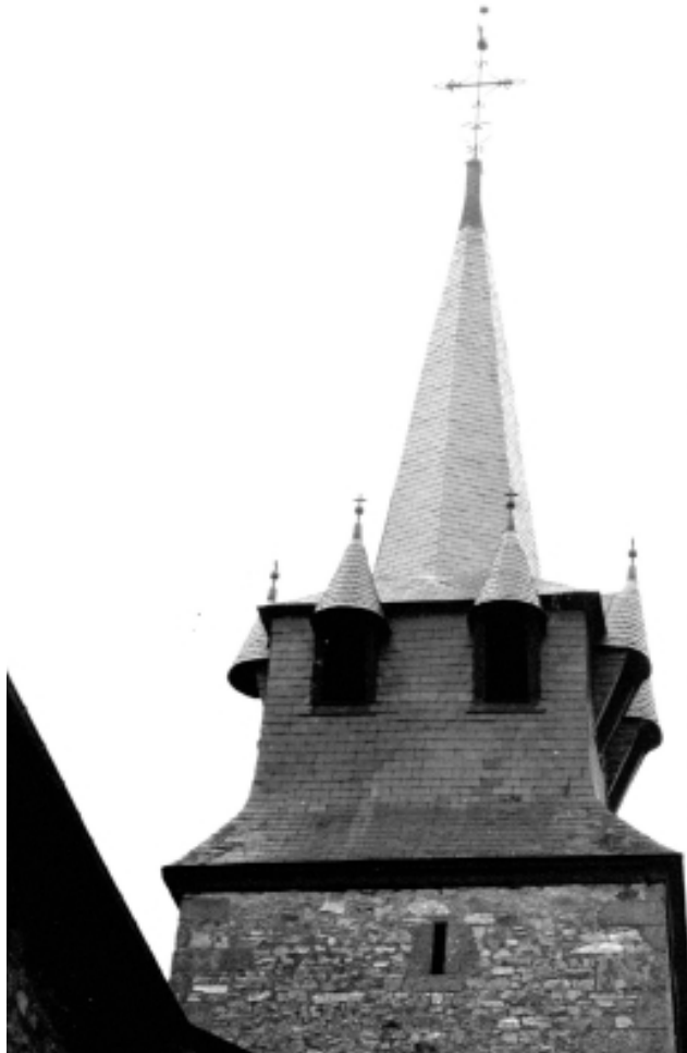
Le clocher, prise de vue de 1970