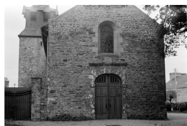
Entrée principale ouest, prise de vue de 1970 IVR53_19703501529Z