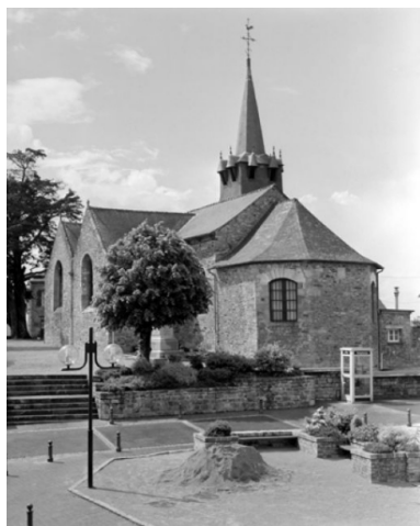
Elévation sud-est : vue générale IVR53_19943500925X