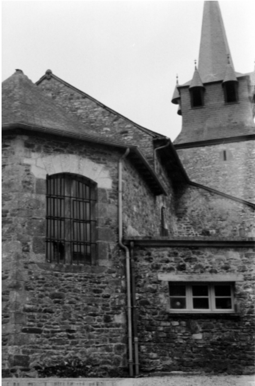
Nord-est de l'édifice, prise de vue de 1970