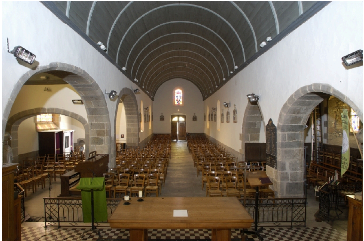
Vue intérieure prise du chœur vers la nef