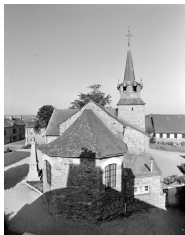
Elévation est : vue générale IVR53_19943500952X