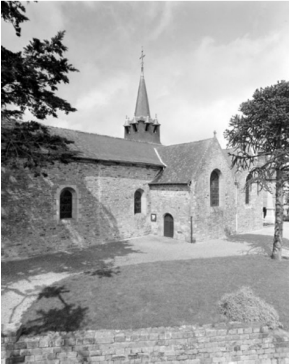
Elévation sud : vue générale