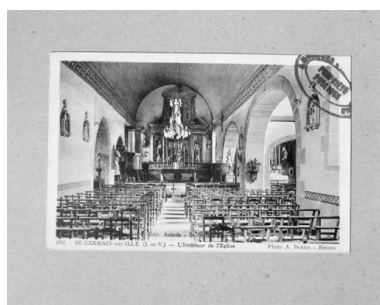
Intérieur : vue générale vers le chœur (Carte postale ancienne, AD35 : 6Fi) IVR53_19933500889XB