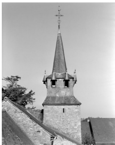
Elévation est, clocher : vue générale