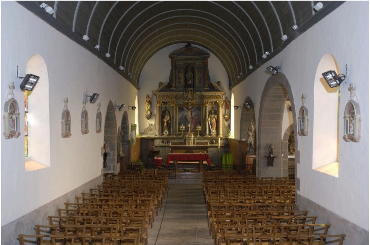
Vue intérieure prise de la nef vers le chœur