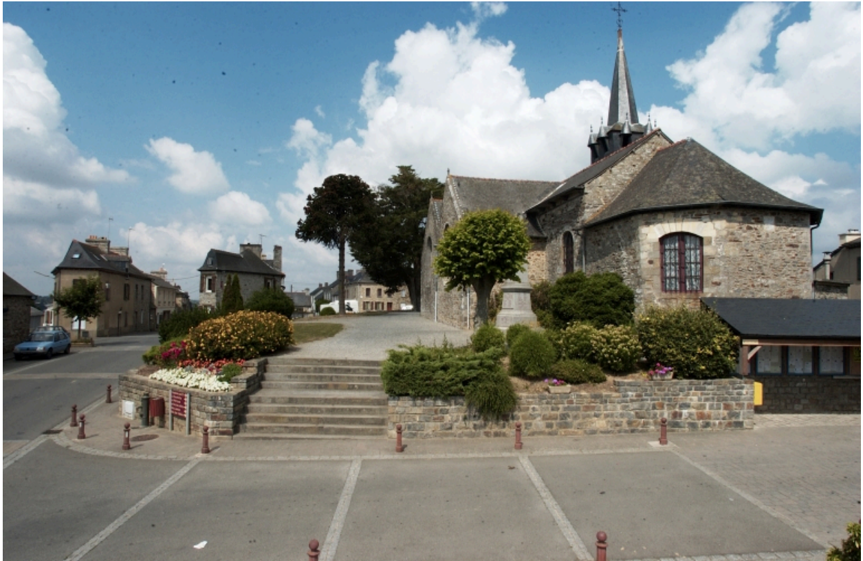
Vue est de l'église