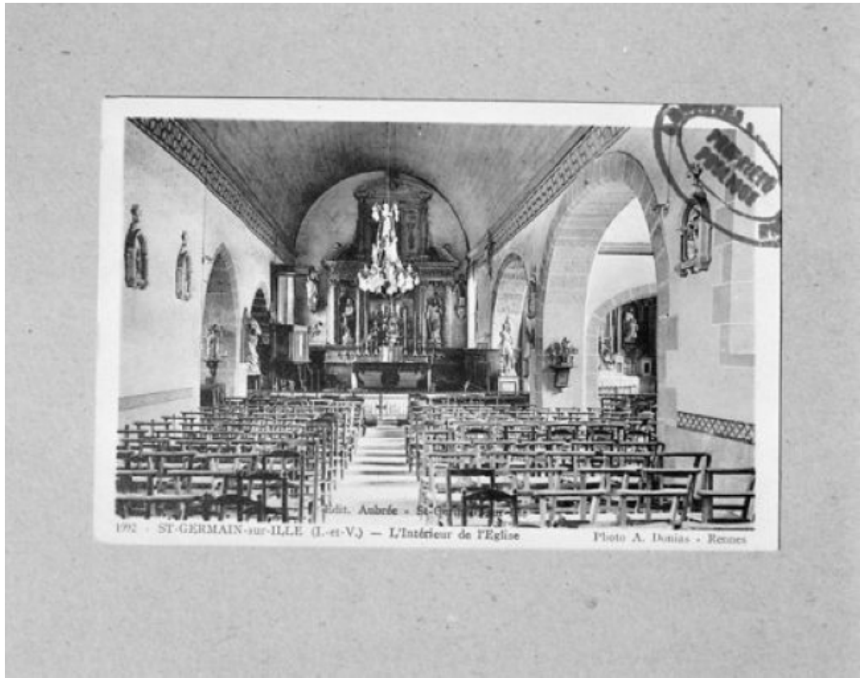
Intérieur : vue générale vers le chœur (Carte postale ancienne, AD35 : 6Fi)