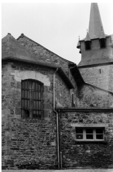
Nord-est de l'édifice, prise de vue de 1970 IVR53_19703501545Z