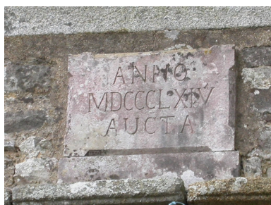
Détail de la plaque située au-dessus de la porte ouest IVR53_20053508253NUCA

IVR53_19943500953X