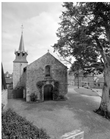
Elévation ouest : vue générale IVR53_19943500926X