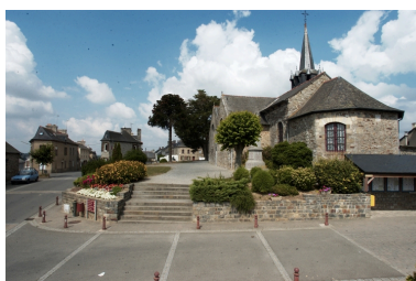
Vue est de l'église